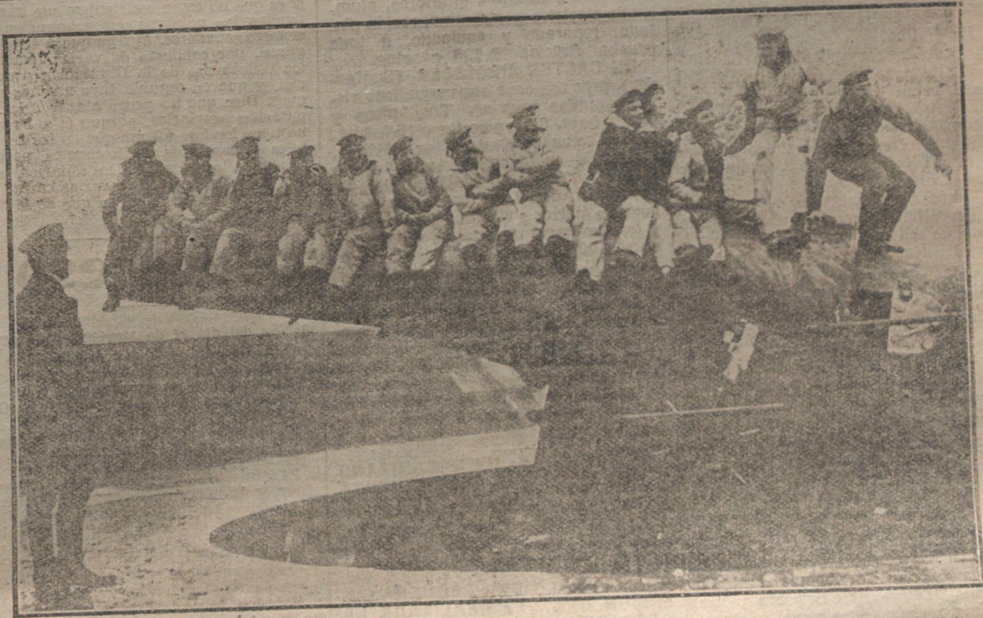
DESPUES DE LA GUERRA.—Uno de los grandes cañones alemanes de la costa belga, que con arreglo a las condiciones del armisticio, han pasado a poder de los aliados

En el hotel deja una danda bastante crecida, y a los padres Franciscanos también les ha sacado unos cuartos.