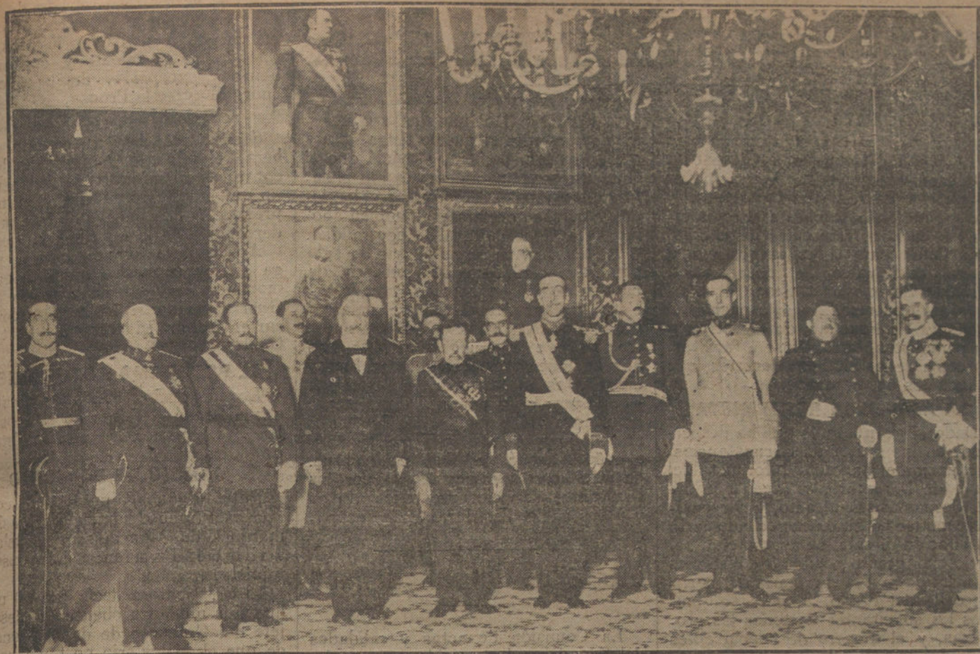
EN EL MINISTERIO DE LA GUERRA.—Imposición de cruces del Mérito Militar por el general Weyler, a la Comisión militar chilena, presidida por el general Brieva.