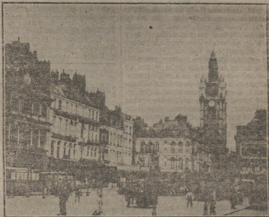
LA EJECUCION DEL ARMISTICIO. —Aspecto del mercado de Douai, una de las últimas poblaciones francesas evacuadas por los alemanes antes del armisticio.

¡Bueno, hombre, bueno! Le daremos la acostumbrada perrilla porque dejó de guitarrear tan á tontas y á locas. Pero, por Belcebú, no vuelva; que hay cosas que caen en gracia por una