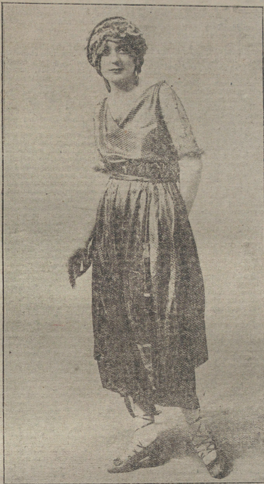
Original traje de tafetán á cuadros, plata y negro, con adornos de blonda, modelo de la casa Jenny.

lo de calificar de angustiosa é insostenible nuestra situación. Si no fuera cansar demasiado su atención, le citaría casos concretos. Basta decirle que le pudiera mencionar muchísimos, que tienen dos, tres y cuatro hijos pequeños, en cuyas casas se consumen sólo en pan 64 y más pesetas al mes, y lo que viene á cobrar un caminero, deducidos todos los descuentos, son 58,30 pesetas mensuales.