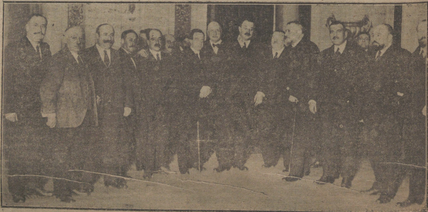
El nuevo alcalde de Madrid, Sr. Garrido Jauristi, después de la toma de posesión del cargo. (Fotografía VIDAL.) Ayuntamiento de Madrid

EL ANUNCIO EN «LA TRIBUNA» ES EL MAS PRODUCTIVO POR SU AMPLIA PUBLICACION Y SU EXTENSION. SA TIRADA.