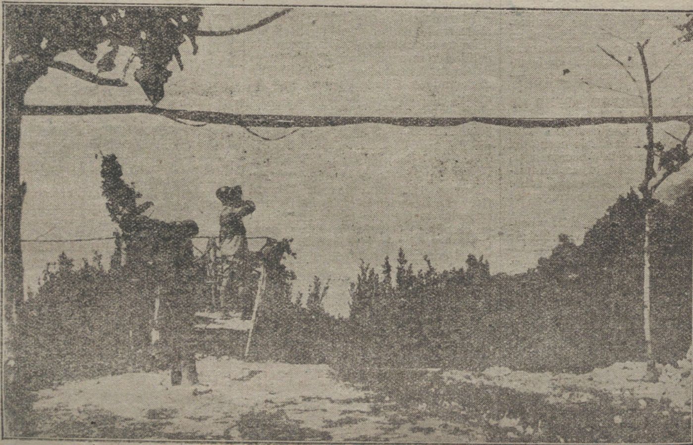
DESPUES DE LA GUERRA.—Puesto de vigías contra aeroplanos, en el Garda, desde donde se presenciaba la evacuación de las tropas enemigas.

Obra de caridad es atender a la angustiosa situación de los camineros españoles. Crea, señor, que no hay hipérbole en