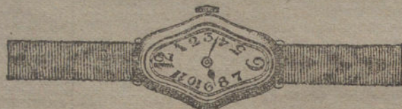
Núm. 9.—Ancora de precisión 15 rubíes oro de ley 18 quilates con pulsera de moiré. Pesetas 275.