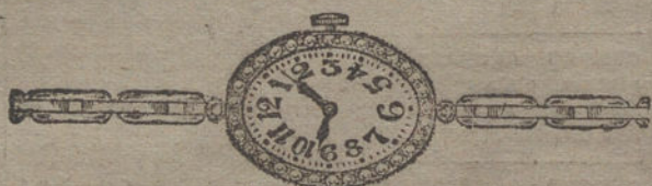
Núm. 18.—Platino y oro de ley 18 quilates, con brillantes y diamantes, pulsera extensible. Pesetas 625.