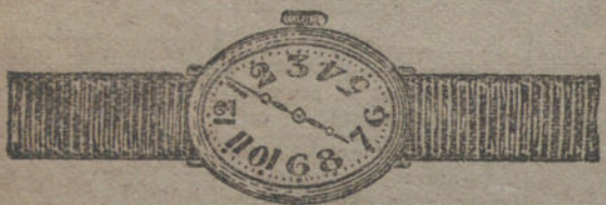
Núm. 3.—Ancora de precisión, oro de ley 18 quilates con pulsera de moiré. Pesetas 125.