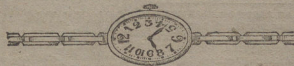
Núm. 14.—Ancora 15 rubíes, oro de ley 18 quilates, con pulsera extensible. Pesetas 375.