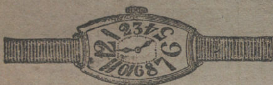
Núm. 4.—Ancora de forma oro de ley 18 quilates con pulsera de moiré. Pesetas 140.