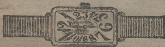
Núm. 5.—Rectangular áncora oro de ley 18 quilates con pulsera de moiré. Pesetas 150.