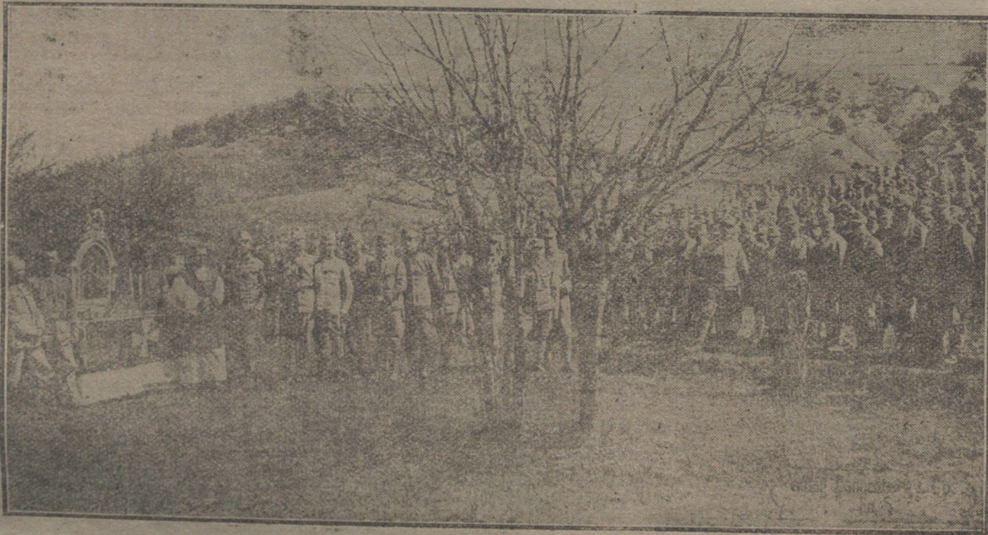
LA EJECUCION DEL ARMISTICIO.—Misa de campaña celebrada en un campamento austriaco de la línea de fuego, antes de la evacuación del territorio.

De varios artículos, entre los que se encuentran el arroz y los garbanos, se