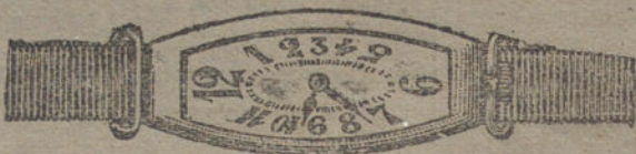
Núm. 7.—Ancora de precisión oro de ley 18 quilates con pulsera de moiré. Pesetas 175.