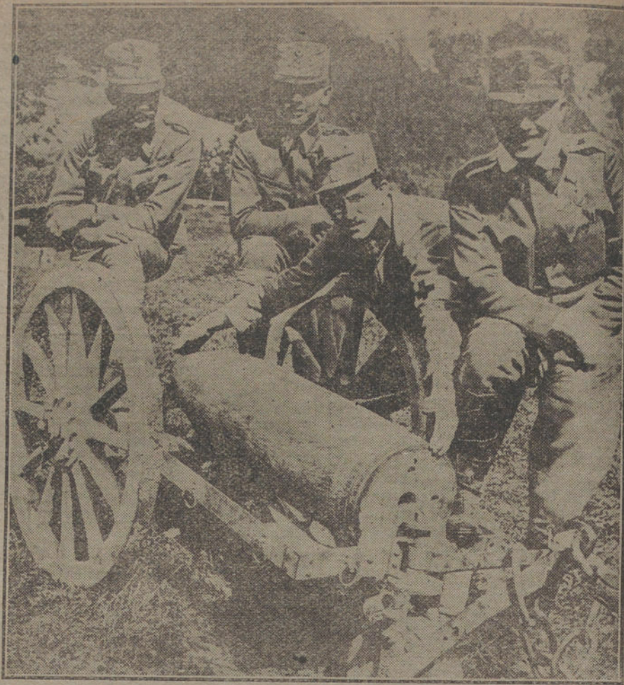
DESPUES DE LA GUERRA.—Soldados austriacos retirando las municiones en el campamento de Artillería del frente italiano.