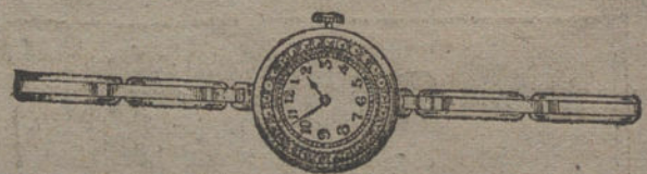
Núm. 19.—Platino fino, orla de diamantes, pulsera extensible. Pesetas 725.

Factura de garantía en todas las compras