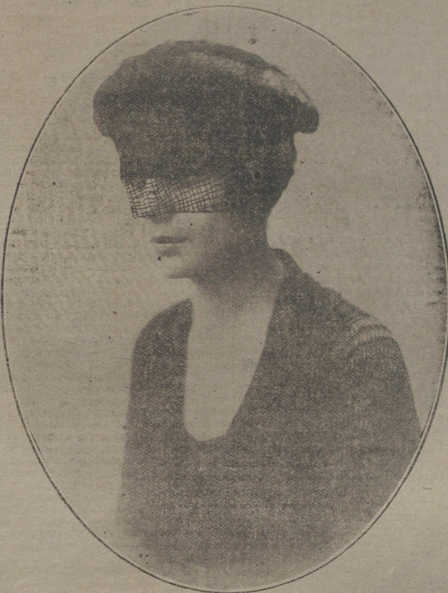
Sombrero de «peluche» y piel del Canadá, en colores oscuros, con velo de rejilla, modelo presentado por la CASA L E R V I S.