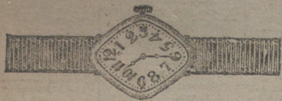
Núm. 1.—Cilindro fino oro de ley 18 quilates con pulsera de moiré. Pesetas 80.