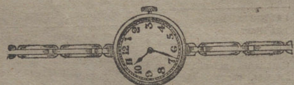
Núm. 17.—Platino fino, áncora de precisión, pulsera extensible. Pesetas 500.