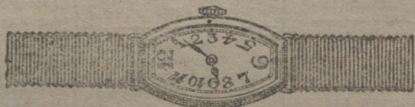
Núm. 8.—Máquina de forma oro de ley 18 quilates con pulsera de moiré. Pesetas 250.