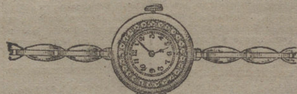
Núm. 16.—Platino y oro de ley 18 quilates, con orla de brillantes, pulsera extensible. Pesetas 450.