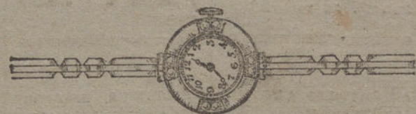
Núm. 15.—Platino y oro de ley 18 quilates, con brillantes, pulsera extensible. Pesetas 400.