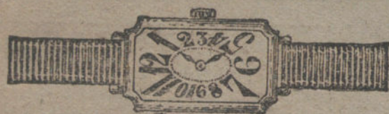
Núm. 6.—Ancora 16 rubíes oro de ley 18 quilates con pulsera de moiré. Pesetas 160.