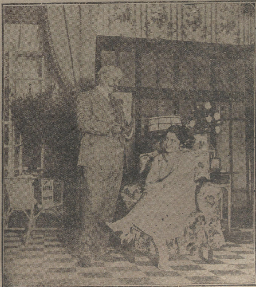
Una escena de la comedia de Linares Rivas, «En cuerpo y alma», que se estrena esta noche en el teatro de la Infanta Isabel.

Una Comisión del Sindicato de empleados y obreros de los ferrocarriles del Norte, acompañada del diputado a Cortes Sr. Anguiano, ha visitado al marqués de Alhucemas, en su despacho del ministerio de Fomento, para interesarle en la reclamación que tienen formulada a la Compañía de que se suprima la selección del personal ferroviario de la misma, y que dejen de prestar servicio los individuos del regimiento de Ingenieros de Ferrocarriles.