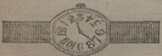
Núm. 2.—«Tonneau» oro de ley 18 quilates con pulsera de moiré. Pesetas 90.