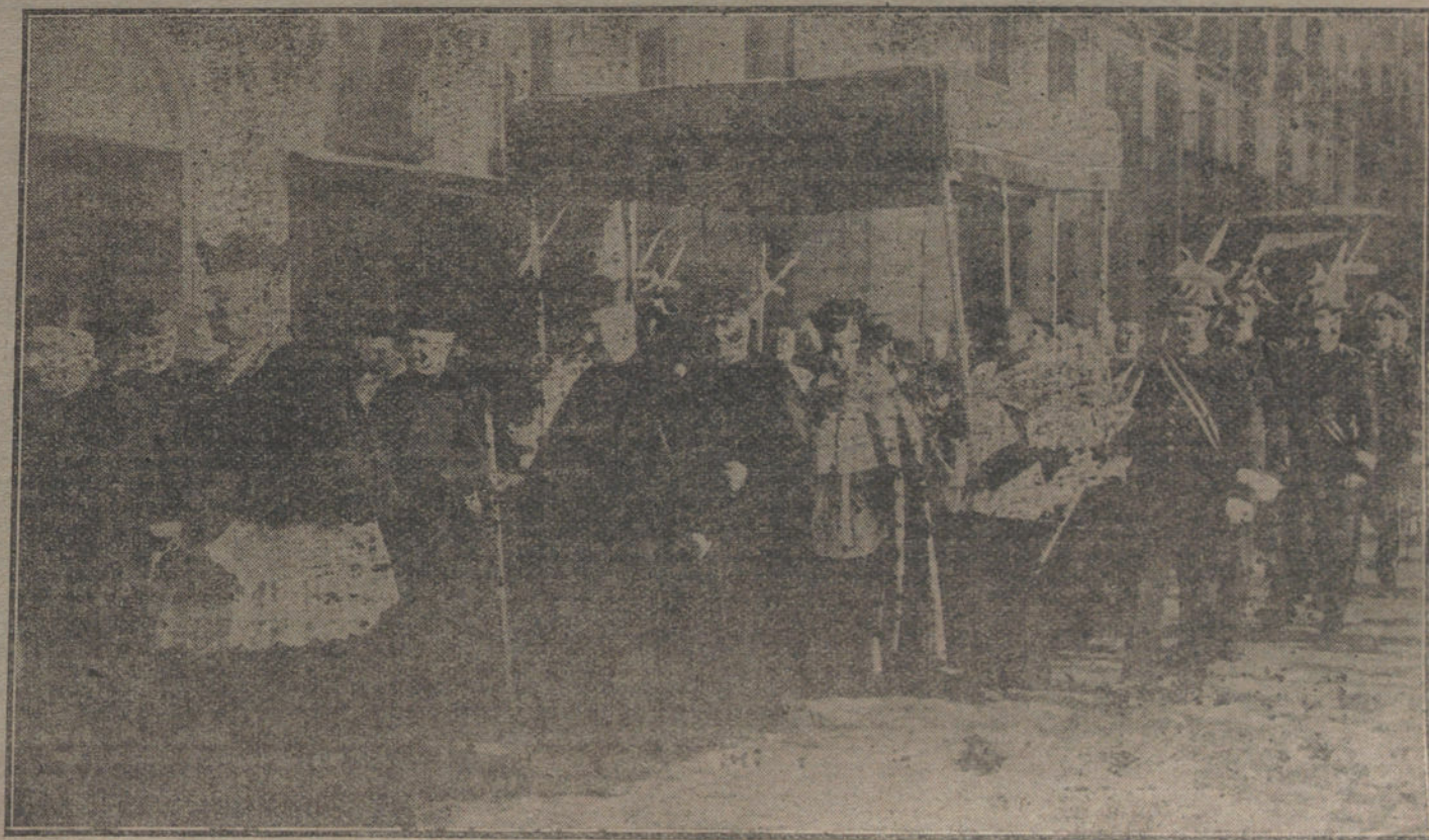
La procesión verificada esta mañana para la promulgación de la bula, dirigiéndose desde la iglesia pontificia de San Miguel a la catedral de la Almudena.

Entre tanto, a todos nos incumben—en nombre de ese patriotismo tan ultrajado con intenciones hipócritas adulaciones—poner frenos a la pasión política y juzgar los acontecimientos con la fría serenidad que el bien de España nos exige.