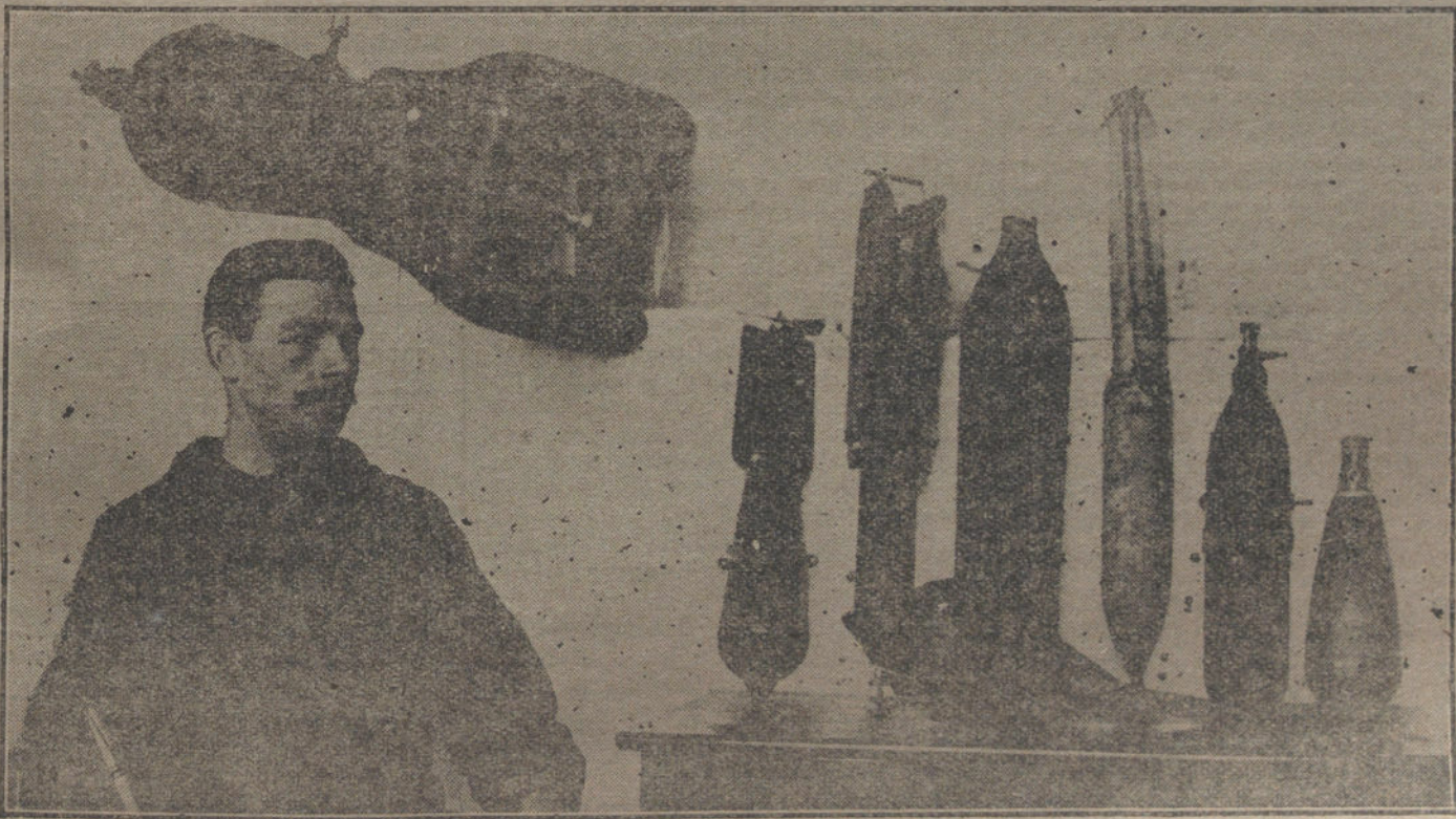
DESPUES DE LA GUERRA.—Bombas que utilizaban los aviadores aliados en sus ataques á las capitales enemigas.

Hoy se celebró un mitin socialista, para pedir la libertad de los presos por causas políticas.