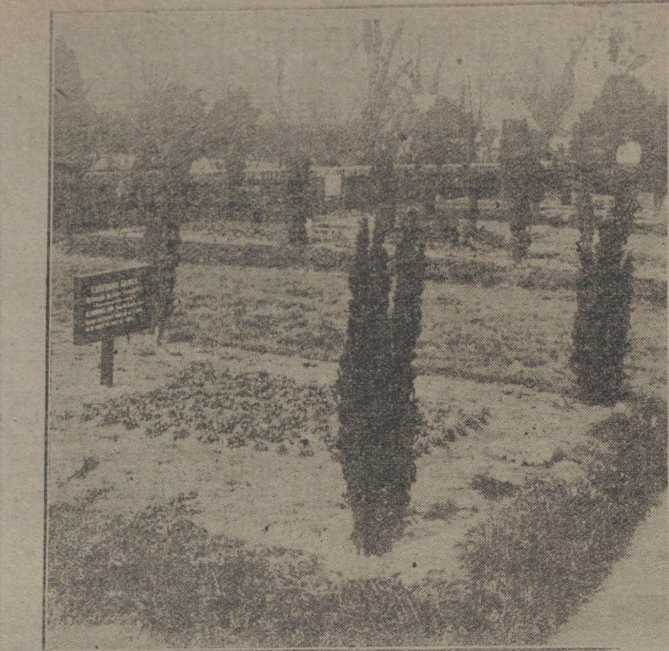
LAS VICTIMAS DE LA GUERRA. —Tumbas abiertas en un cementerio inglés, en memoria de las víctimas del «Lusitania».

Amplia reforma tributaria, inspirada en el principio de que el capital, en sus distintas manifestaciones, ha de ser el principal fundamento de todo gravamen, mientras que el trabajo, en sus diversas fases, ha de quedar liberado, en lo posible, de las cargas fiscales, y dentro de ese criterio deben asignarse las cuotas más elevadas, y siempre en escala progresiva, a los capitales inmovilizados e improductivos, y las más bajas a los que sirvan de base a una explotación agrícola o in-