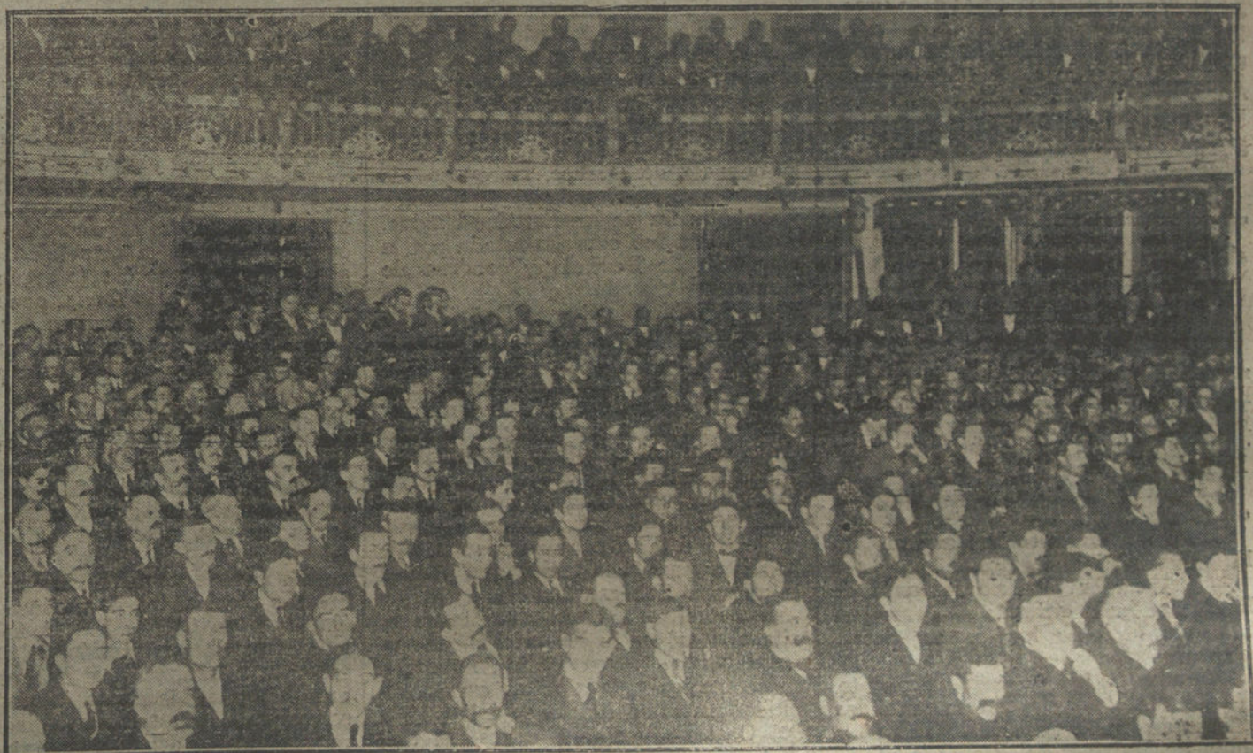
Aspecto del teatro de la Zarzuela durante el mitin católico verificado ayer.