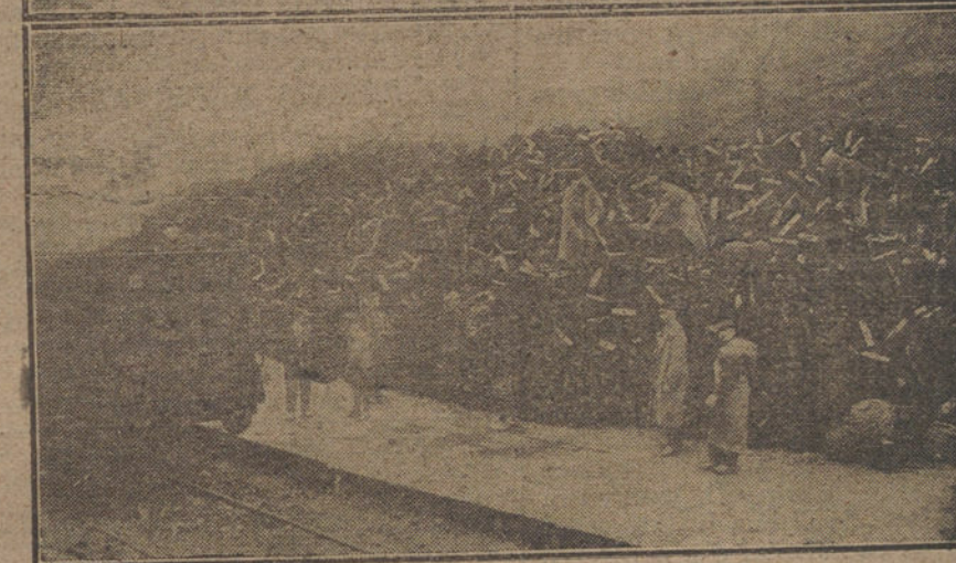
Tropas alemanas, preparando la requisa del material de guerra, antes de la evacuación de la zona francesa.

mento de la Inmaculada, obra del insigne escultor Collaut Valera, situado en la Plaza del Triunfo.