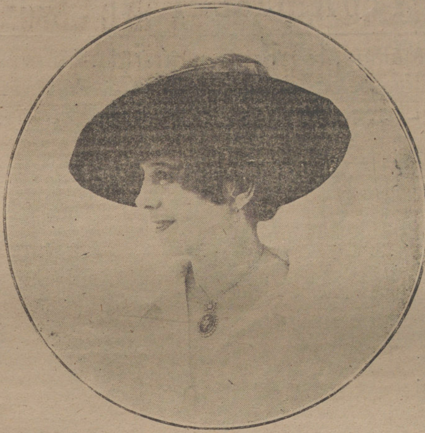
Sombrero de terciopelo y plumas, en colores de fuerte contraste, modelo de la casa Jeanne Blanchot.

Al tratar de los millares de hombres que se encontrarán sin trabajo como consecuencia del fin de la guerra, expuso la necesidad del desarrollo de las obras públicas y de poner en cultivo grandes extensiones de terreno yermo, ganando con esto la agricultura 300 millones de acres. A este fin habrá que ampliar los créditos aprobados.