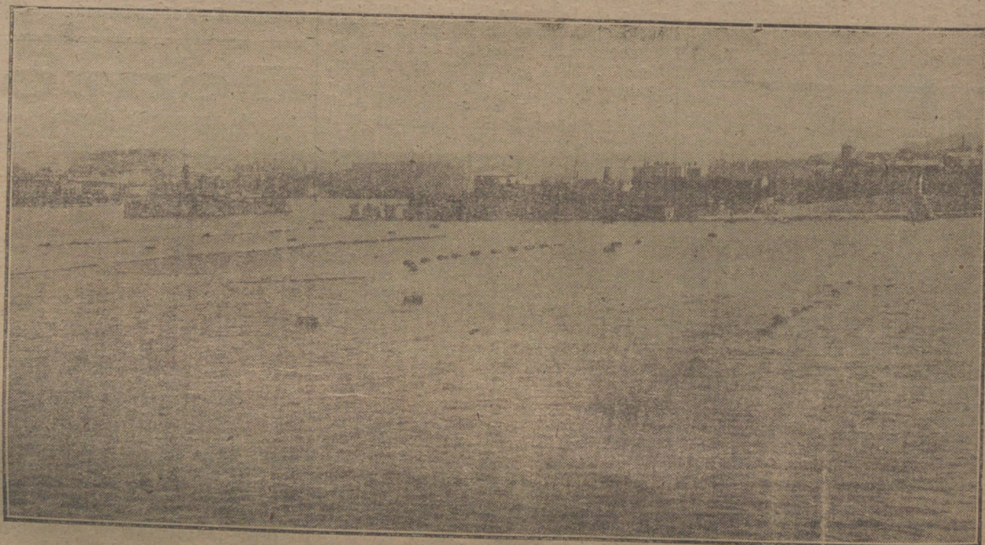
LA EJECUCION DEL ARMISTICIO.—Un aspecto del puerto de Sebastiel, durante la desmovilización á que ha dado lugar el armisticio.

Nuestros valientes soldados fueron á combatir en tierra y mar por nuestros ideales, que yo he intentado poner de manifiesto. Yo debo volar por que no se den falsas interpretaciones á estos ideales, y para que se hagan todos los esfuerzos posibles para realizarlos. Tengo la obligación de sostener mi actitud hasta el fin, teniendo en cuenta que nuestros soldados ofrecieron para su obtención su vida y su sangre. Me doy cuenta de la amplitud y dificultades de este deber. Me he puesto al servicio de la nación, y á ella consagro lo mejor de mi alma. Durante mi ausencia permanecerá en contacto directo con vosotros por cable y telegrafía sin hilos. Mi ausencia será lo más corta posible.»