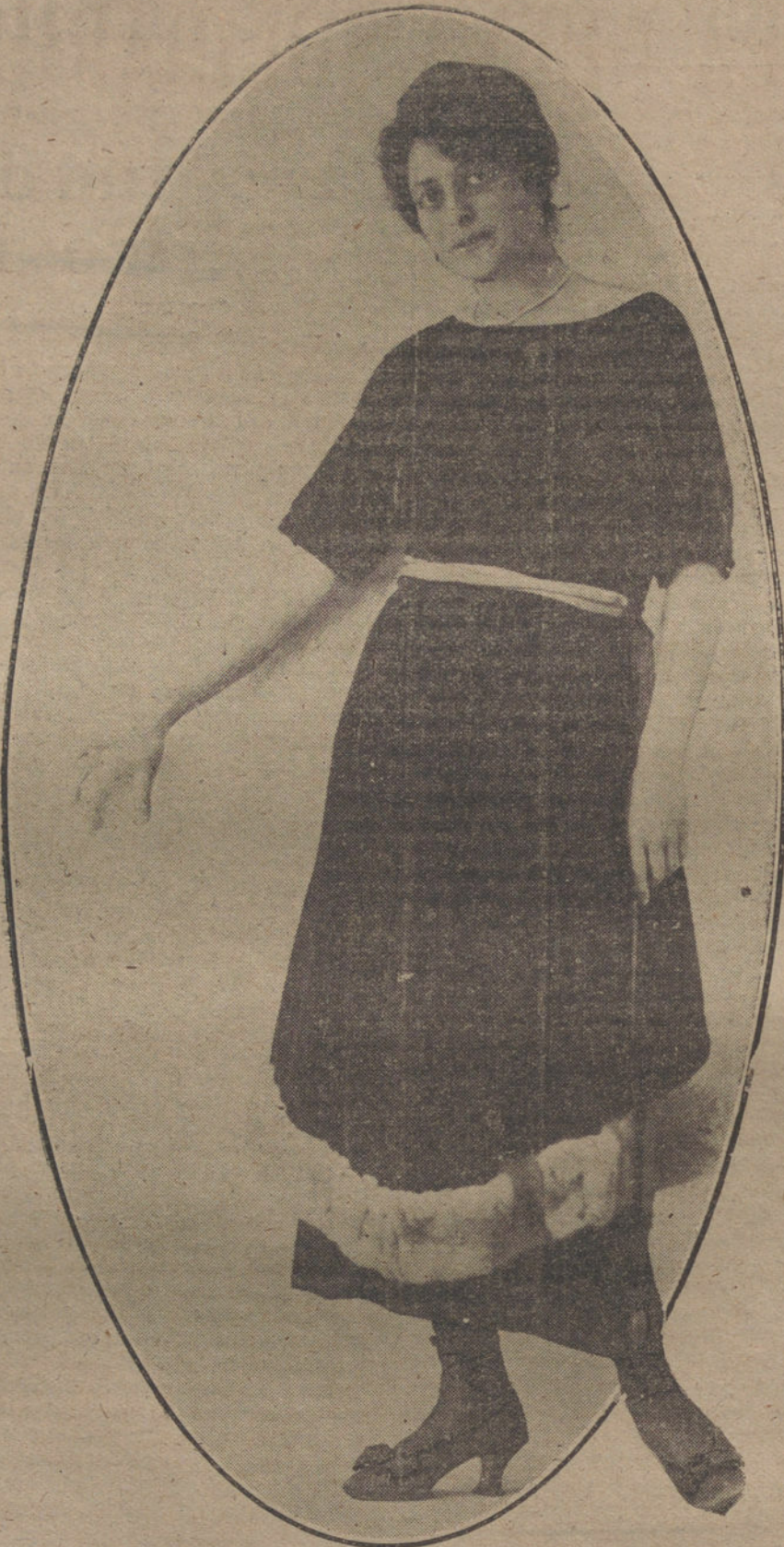
Traje de terciopelo, con adornos de nutria y cordón de oro, modelo de la casa Marthida.

industriales y comerciales, sino utilizarlos para aumentar la producción, y no en bien de capitalistas particulares, sino en interés del Estado.