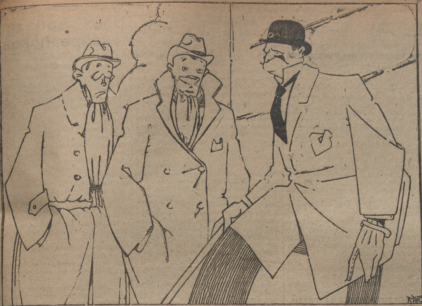
EL MAL CARACTER

—A mí me perjudica mucho este maldito carácter.