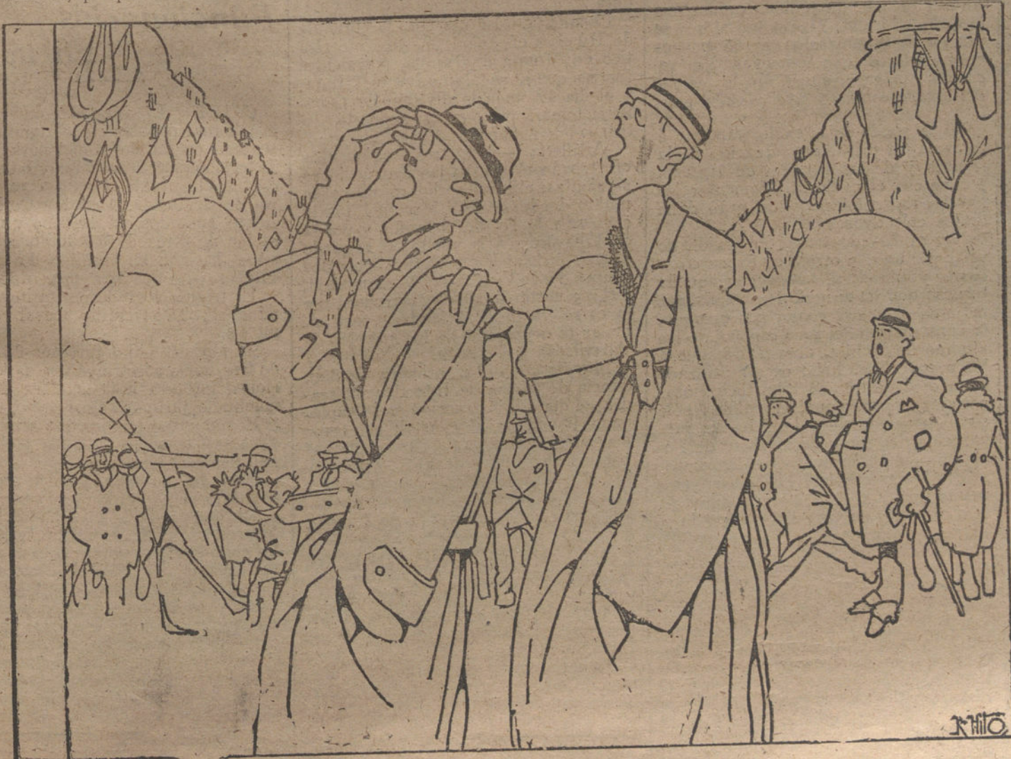
COMENTARIOS A UN VIAJE

Así, pues, pensando en que el problema no admite dilaciones, en que la serenidad y la tolerancia deben anteponerse a toda otra convicción, en que las Cortes actuales están facultadas para discutir, pero no para resolver, y en que el país desea aclarar su situación interior, entremos en el debate de esta tarde confiados en la rectitud y el patriotismo de los parlamentarios y el Gobierno.