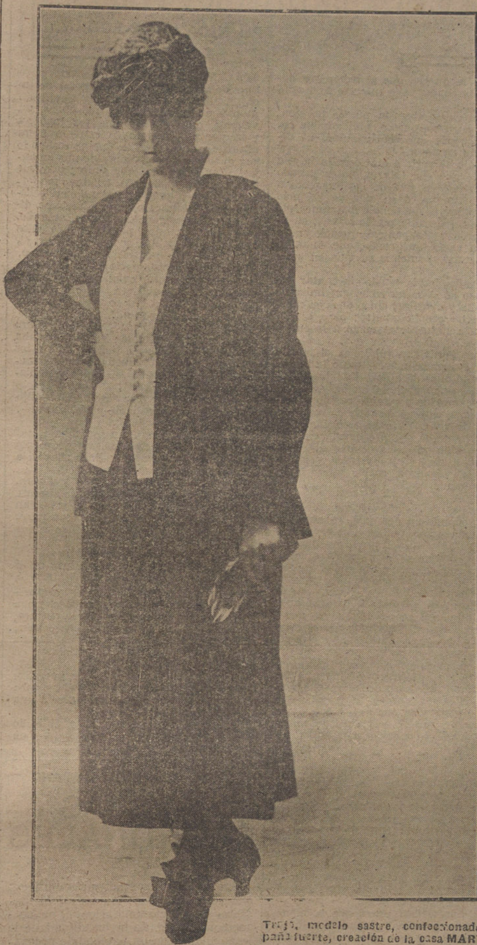
Tercer modelo sastre, confeccionado en paño fuerte, creación de la casa MARTHY