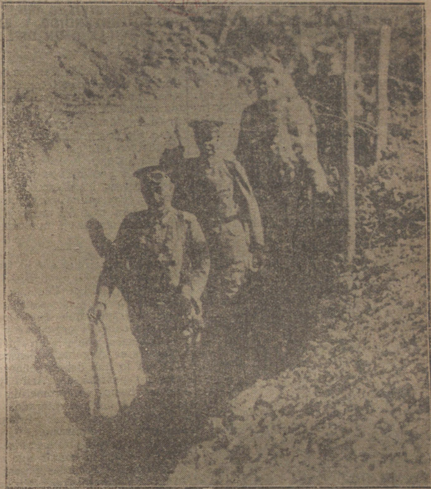
Una de las últimas fotografías del Káiser, en una trinchera del frente occidental, durante la visita que hizo pocos días antes de su abdicación.

Así ha podido decirse que estas Cortes no significan la voluntad del pueblo ni están capacitadas para nada que sea obra duradera y vigorosa. Cortes estériles, por ser engendradas en las entrañas de las viejas organizaciones, no pueden resolver problemas biológicos. Es necesario, pues, ir, como piensa el Gobierno, a unas Cortes nuevas; pero aún es más necesario que esas Cortes respondan al sentido verdaderamente patriótico, que anima las modernas orientaciones.