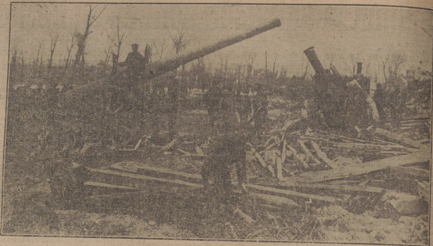
LA EJECUCION DEL AMISTICIO.—Soldados ingleses, desmontando un campamento de las líneas avanzadas, en virtud de la suspensión de las hostilidades

Se vende una partida de este combustible en condiciones ventajosas. Razón: Sección de Compraventa de LA TRIBUNA Plaza de Canalejas, 6.