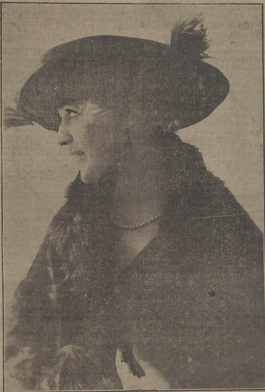
Sombrero y pieles, modelos de la casa BLANCHOT.

garantía, sino cuando no puede ser conculcado. ¿De qué nos sirven las nociones de Patria, de Justicia, de Derecho y de Libertad, si pueden estar á merced de la habilidad de un técnico de la dialéctica?