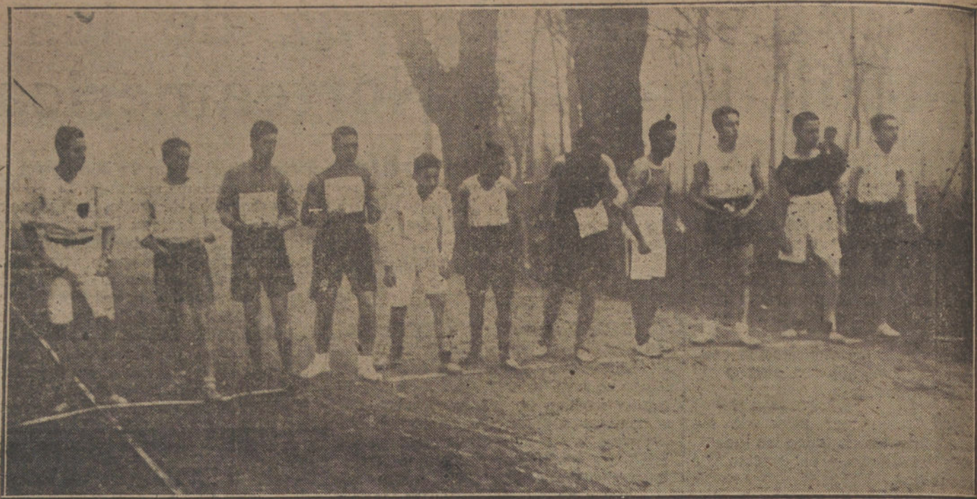
Salida de los corredores que han tomado parte en las carreras de cinco kilómetros, organizadas por los Exploradores de España.

—Su Majestad el Rey ha enviado un sentido telegrama de pésame á la familia de Sidonio Paes.