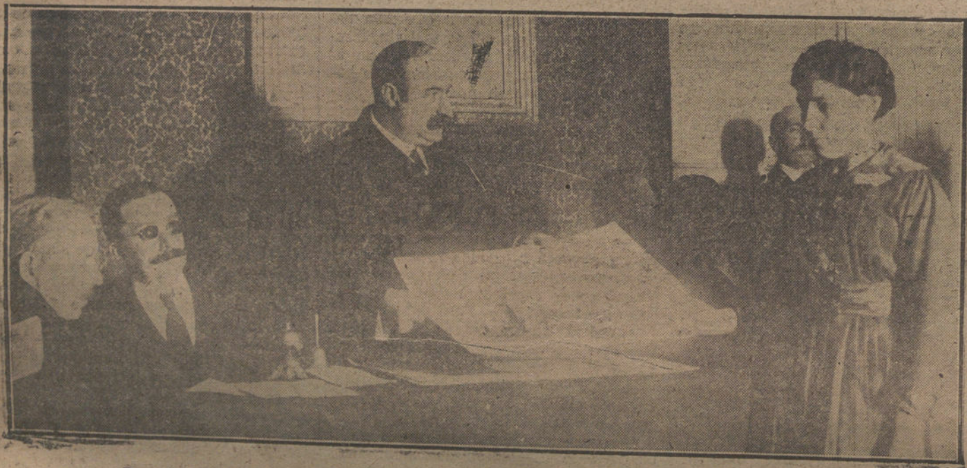
Reparto de premios, verificado ayer en el Instituto Protector de Ciegos.

Parroquia de San Ginés.—(Cuarenta Horas).—Continúa la novena á Nuestra Señora de los Remedios; á las ocho, Exposición de S. D. M. á las diez, misa solemne; á las cinco y media de la tarde, la novena, predicando el Sr. Superior Fr. Fausto; bendición y reserva.