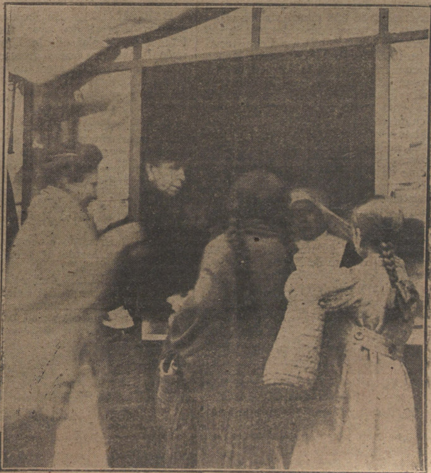
LA CARIDAD DE LA REINA MADRE.—Su Majestad la Reina Doña María Cristina, repartiendo comidas á los pobres, en el Asilo de Lavanderas, acto verificado ayer tarde.