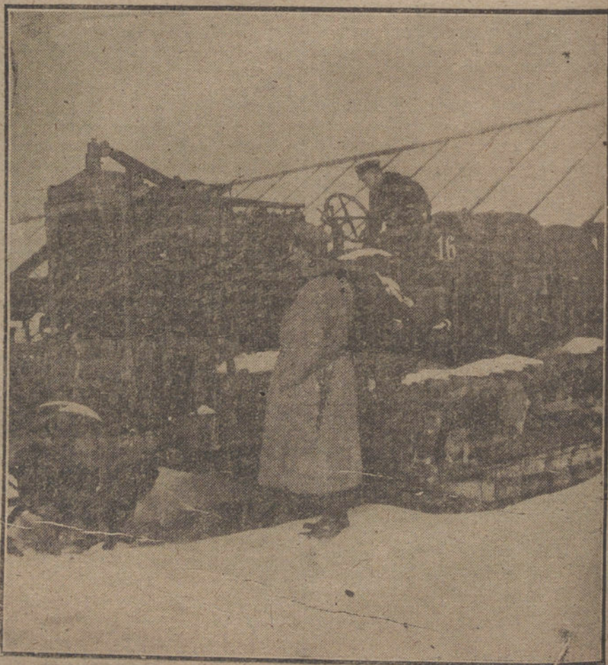
LA EJECUCION DEL ARMISTICIO.—Uno de los tanques utilizados en la pasada guerra por el Ejército alemán para el aprovisionamiento, y que en virtud del armisticio se ha quedado en las líneas francesas.