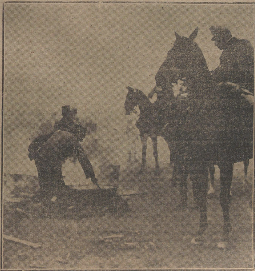
LAS MANIOBRAS MILITARES DE AYER.—Su Majestad el Rey viendo preparar el rancho de la tropa.

Terminado el Consejo de ministros el conde de Romanones recibió a una Comisión numerosa de ferroviarios, que iba a conocer el acuerdo del Gobierno acerca de sus peticiones.