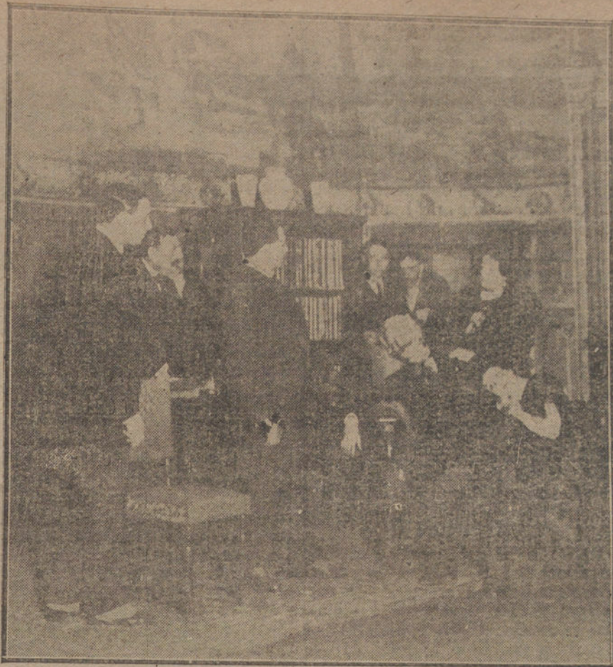
Una escena de «Kip Senders», obra estrenada esta tarde en el teatro de Price.

Esto ha motivado algunas protestas. La actuación del alcalde después de la Asamblea no fué otra que la de presidir la Comisión de representantes de Ayuntamientos que se trasladó a la Diputación. Cuando se dirigía a ella el grupo de comisionados, se formó un