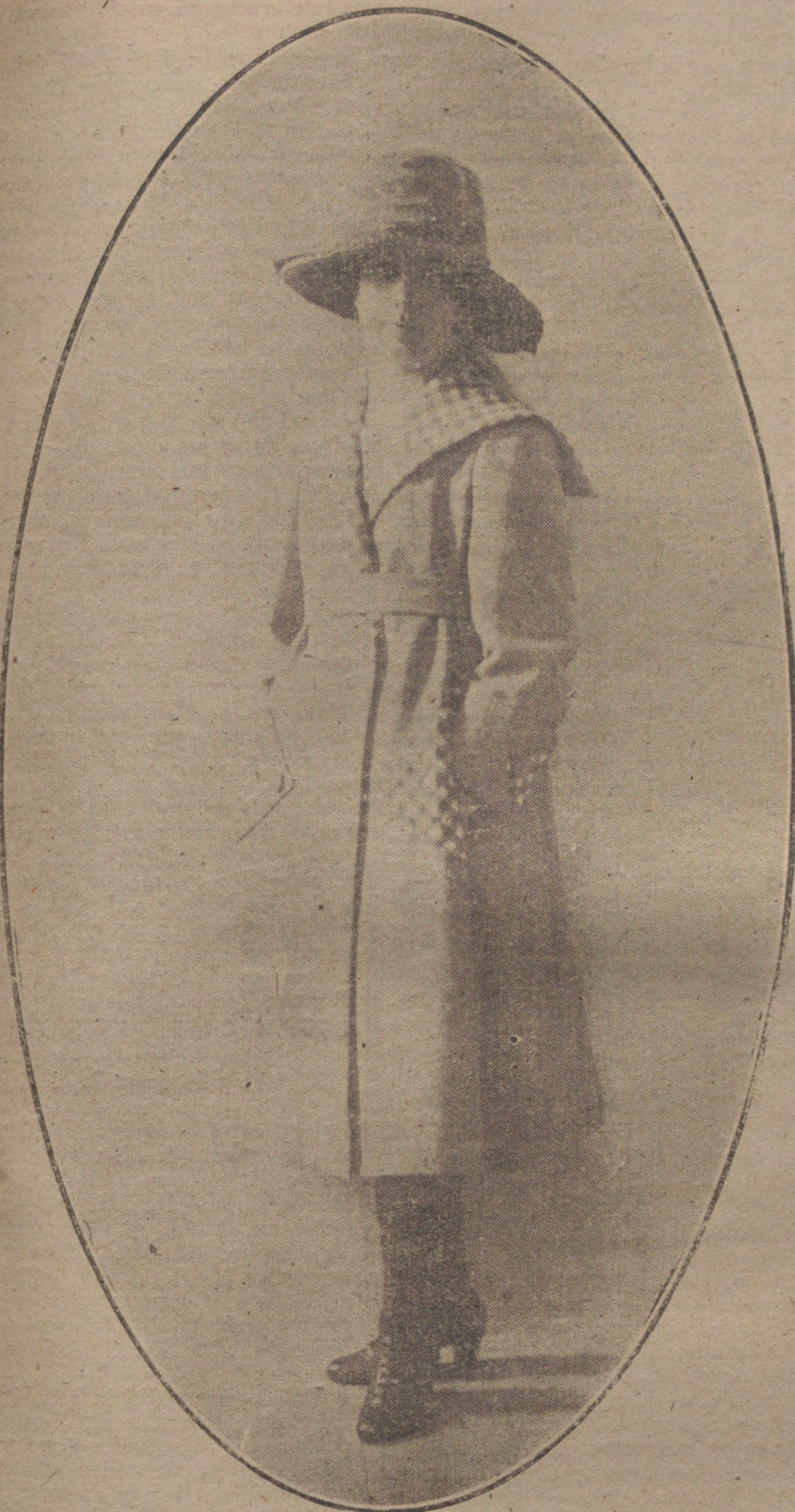
Modelo de gabán de paño, color claro, con vueltas a cuadros, creación de la casa Berthelle.