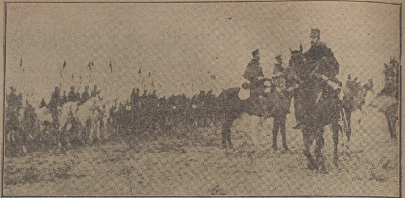
DE LAS MANIOBRAS DE AYER.—Su Majestad el Rey, pasando revista al regimiento de Lanceros.

Los manifestantes cantaron durante la aprobación del pueblo, marcharon en busca del Presidente Wilson; pero consultado el Gobierno telefónicamente por las autoridades, decidió prohibir el paso á la manifestación, violentamente, á ser preciso, sin consideración á los mutilados que la componían, al noble objeto del acto que celebraban.