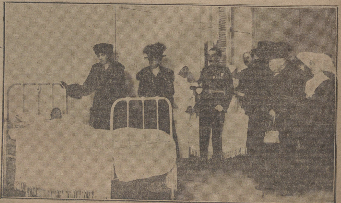
EN EL HOSPITAL DE SAN JOSE Y SANTA ADELA.—Sus Majestades las Reinas Doña Victoria y Doña Maria Cristina, con su alteza la Infanta Doña Isabel, visitando una de las salas de enfermeras, después de haber inaugurado el curso de Damas Enfermeras de la Cruz Roja.

Tengo la convicción de que es posible fijar cuatro semanas antes de la fecha para las elecciones de la Asamblea nacional, sin violar derecho ó interés alguno. La reunión votó á continuación una resolución, dirigiendo al Congreso nacional de los Consejos de obreros y soldados la urgente decisión de fijar para el 19 de Enero las elec-