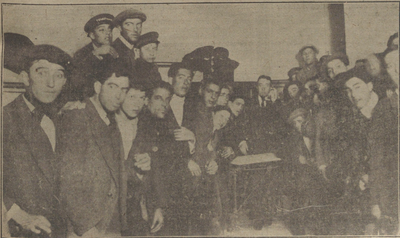
Los corredores de telegramas y telefonemas, esperando las órdenes en el café de París, donde se han reunido este año los correspondientes.

Este millón lo cobrarán los zamoranos. Lo dicho: ¡Madrid, desdichadísimo!