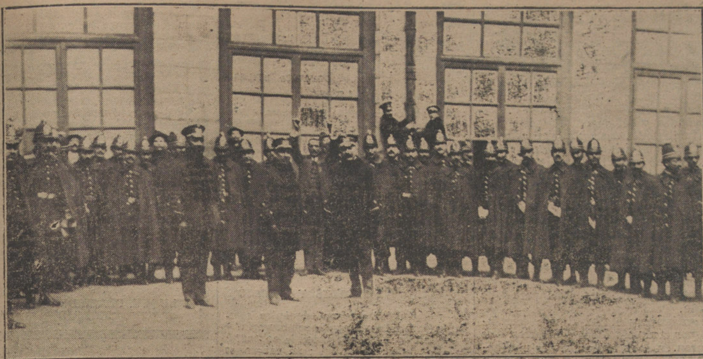
LA LOTERIA DE HOY.—La sección del Cuerpo de Seguridad, del distrito del Centro, á la cual ha correspondido un premio de 100.000 pesetas.

inauguración. Digamos también que su sentimiento hermano muy bien con el temperamento de D. Bartolomé.