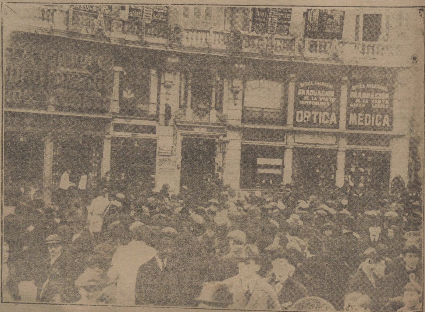
LA LOTERIA DE HOY.—El público es atraído hacia las pizarras de LA TRIBUNA.

La Sinfonía Pastoral, á pesar de las frecuentes audiciones que de ella nos dan las orquestas, resulta menos envejecida que otras de sus congéneres, y siempre hay momentos de verdadera emoción, del reflejo sonoro de una tarde pasada en el campo, de la verdad del sentimiento, sin buscar la descripción material, tal como se hace ahora. Además, es una de las obras preferidas por la Orquesta Filarmónica, ya que su estudio remonta al programa de