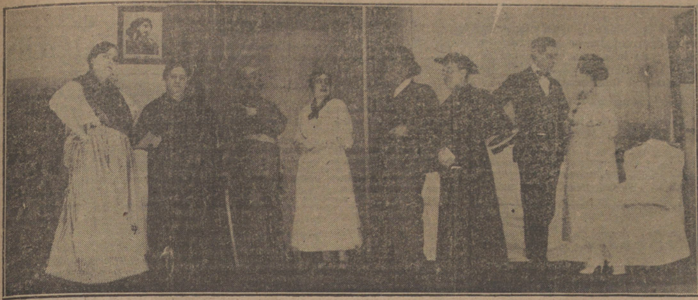
Una escena de la obra «Como el agua de la sierra», que se estrena mañana en Lara.

Don Alfonso contestó que recibía la honorífica distinción como una prueba más de que Francia ha visto en él los sentimientos de simpatía que hacia ella siente el Rey, el Gobierno y el pueblo español.