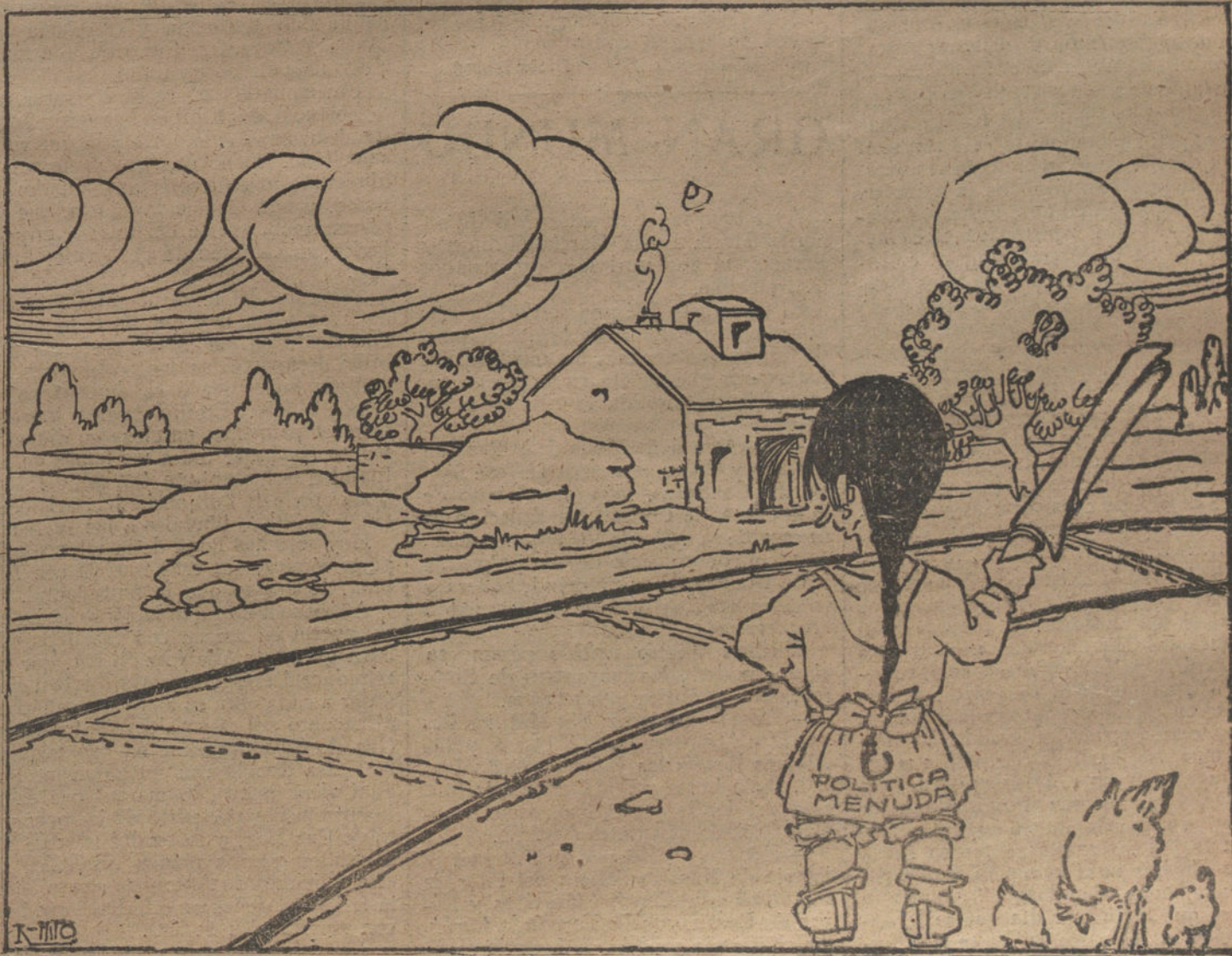
MADRID-PARIS-MADRID [Via libre!]

Tercera parte.—Sinfonía XI (millar), Haydn.