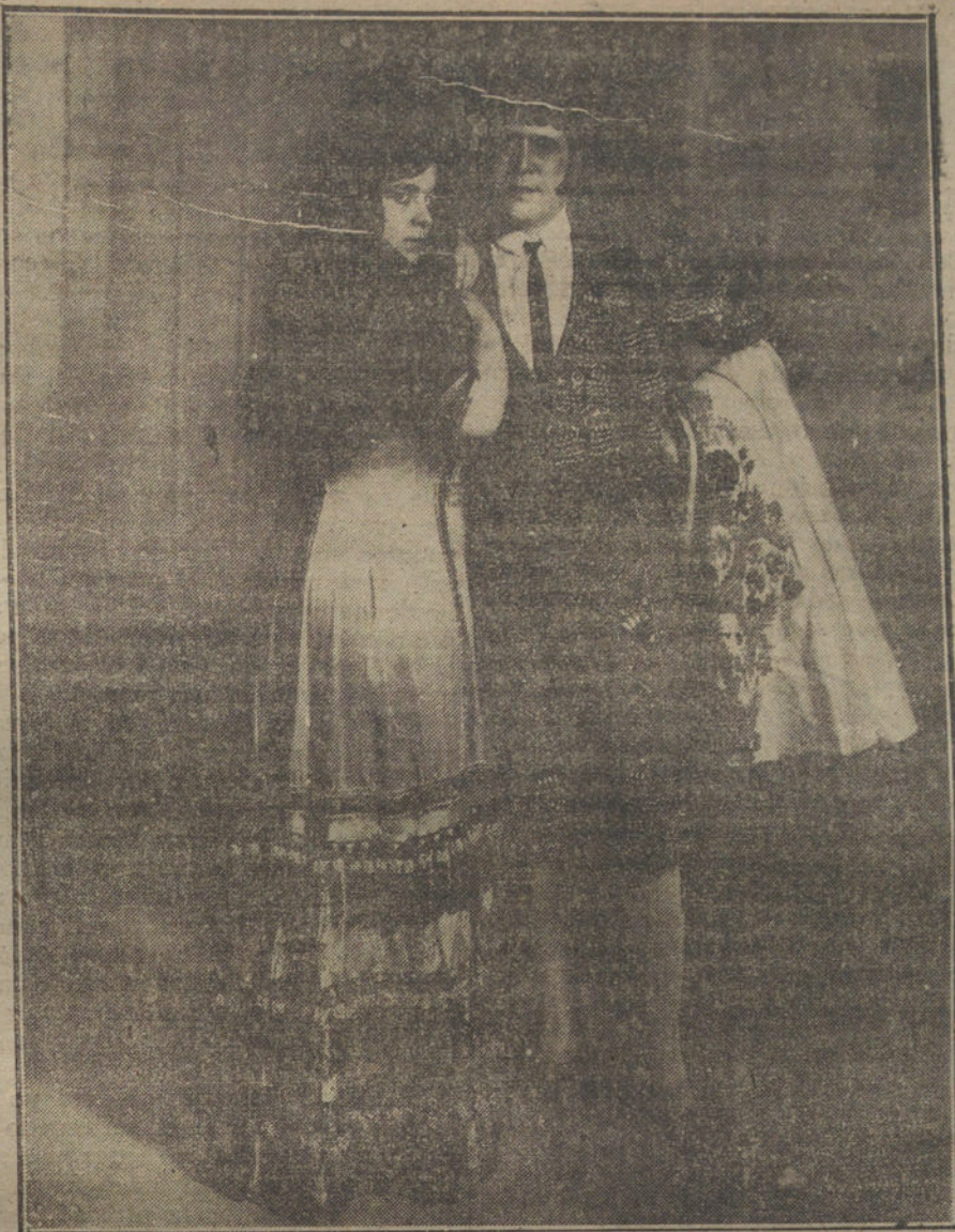
Curiosa fotografía de María Gay con Titta Ruffo, en «Carmen», después de una representación en la Habana.

Como cantante lució su voz sobre las de los demás, tanto por su calidad como por su escuela.