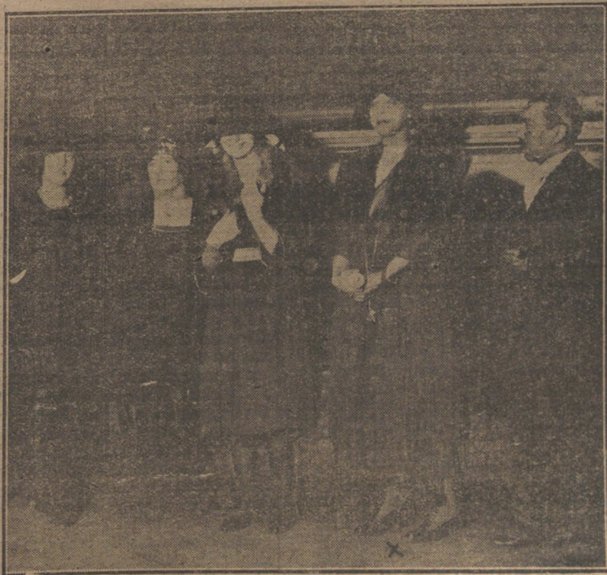
ferencia de anoche en el Ateneo, sobre Margarita Nelken (x), después de su con- «Feminismo».

Jueces supremos é implacables, como el tiempo y la opinión, harán justicia a su debida hora. El veredicto está pendiente de respuesta.