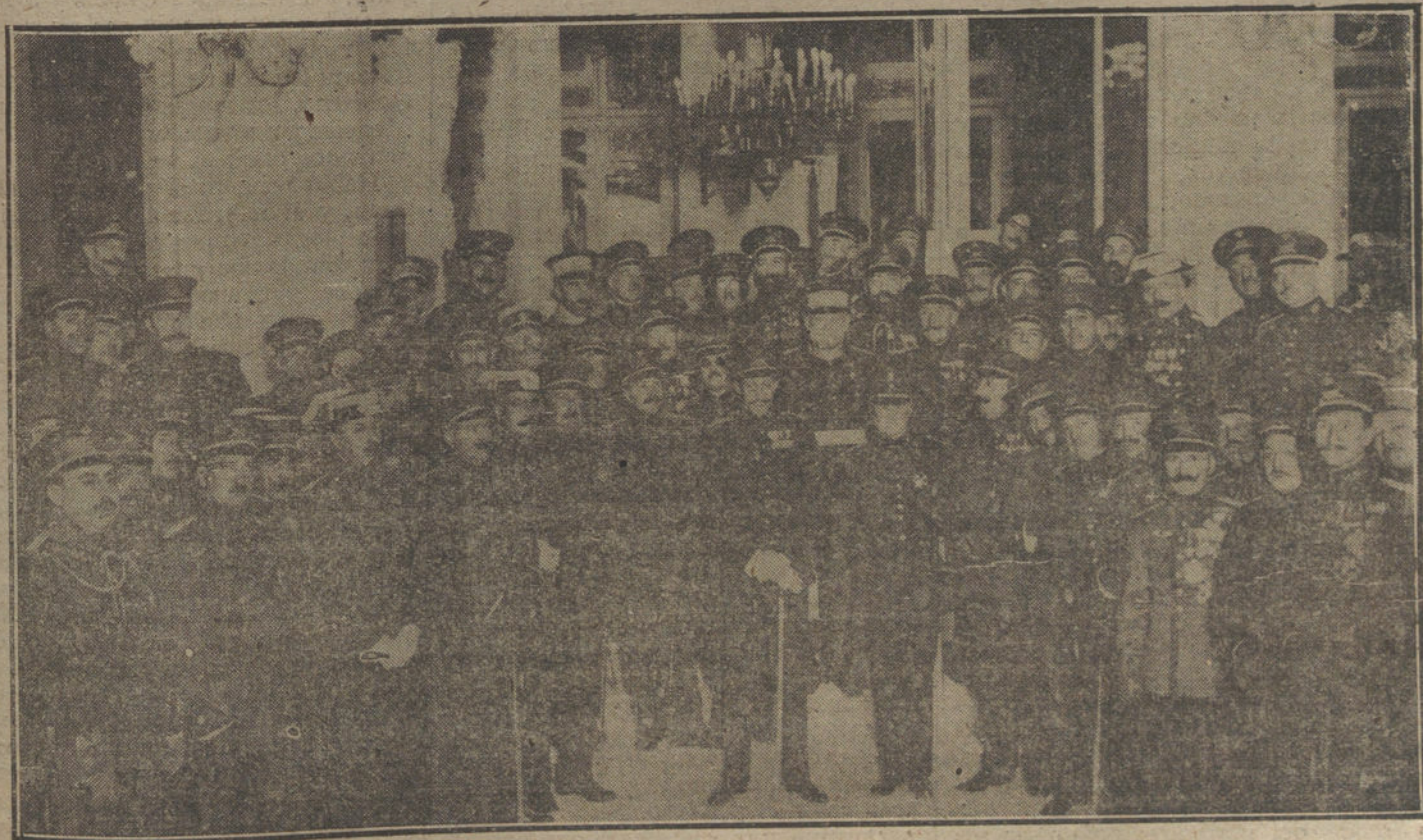
Su Majestad el Rey, rodeado de sus compañeros de promoción, después del banquete que le ofrecieron anoche en el Centro del Ejército y de la Armada.

¿TIENE USTED QUE VENDER O COMPRAR ALGUNA CASA, SOLAR, MUEBLES O AUTOMOVIL? PASE ANTES POR LA SECCION DE COMPRA-VENTA DE «LA TRIBUNA».