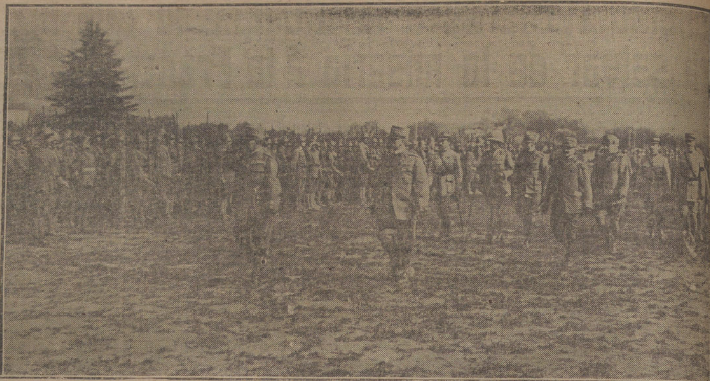
LA EJECUCION DEL ARMISTICIO.—El generalísimo Diaz, revistando las fuerzas italianas que han prestado servicio en el frente francés.

Como ya dijimos, las tarjetas, al precio de 17 pesetas, pueden adquirirse en el Círculo de Bellas Artes, Casino de Autores, Centro de Hijos de Madrid, teatro del Centro, hotel Inglés, café Lyon d'Or, administración de «Heraldo de Madrid», y en las librerías de Fe, Beltrán y Pueyo.