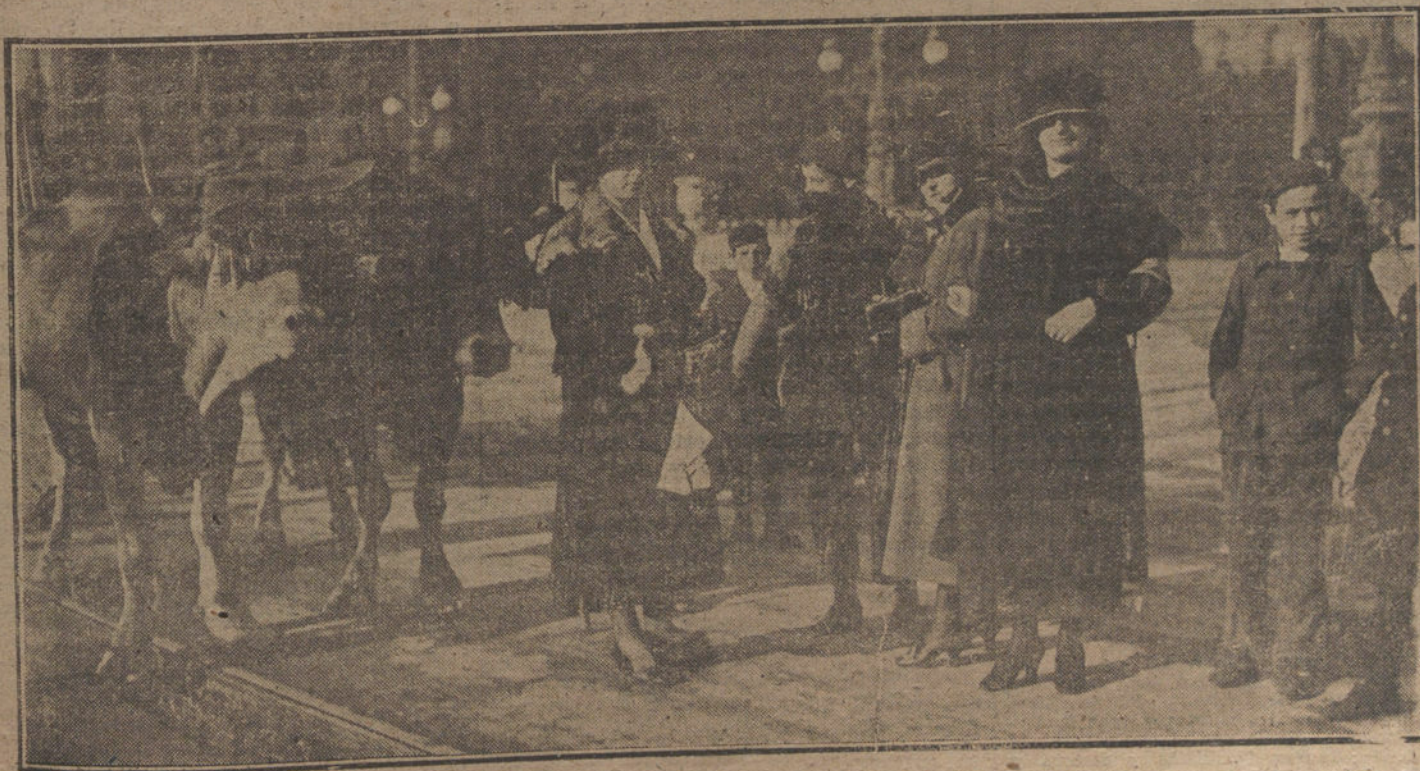
Un detalle de la fiesta de la Flor, celebrada en San Sebastián.

Algunos suponen que la causa era las pérdidas que tenía en el negocio.