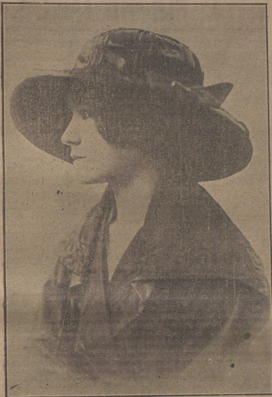
Sombrero de «falla» y terciopelo, modelo de la casa Marguerite et Leonie