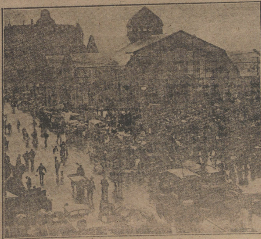
ENTRE LA PAZ Y LA GUERRA.—Aspecto del famoso mercado de Hamburgo al iniciarse la desmovilización de las tropas.

Estas sortijas, que son de oro, y de las modernas de sello, le han sido presentadas á S. M. el Rey, mercedo su regio agrado, por el que ha hecho transmitir su felicitación al autor de ellas.