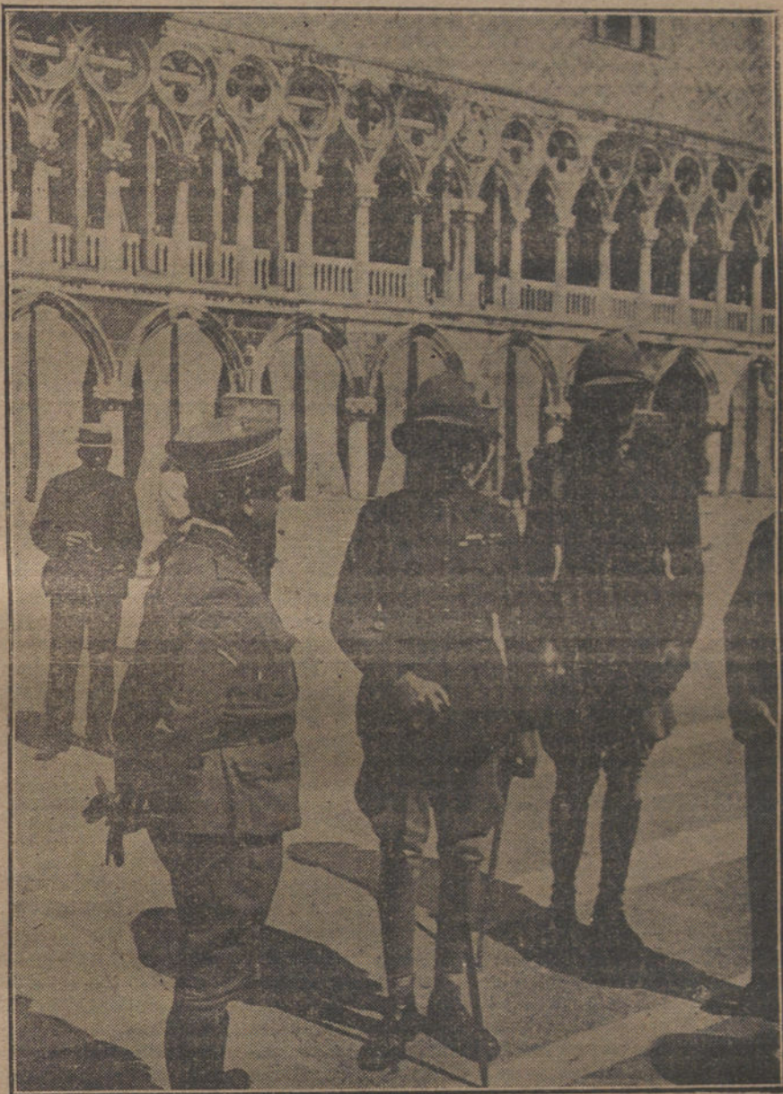
La Misión militar inglesa, conferenciando con las autoridades de Venecia, acerca de las cláusulas del armisticio.

podrán las niñas aportar dote cuando contraigan matrimonio, y los varones quizás establecerse y escapar de las miserias y vejaciones del asalariado.