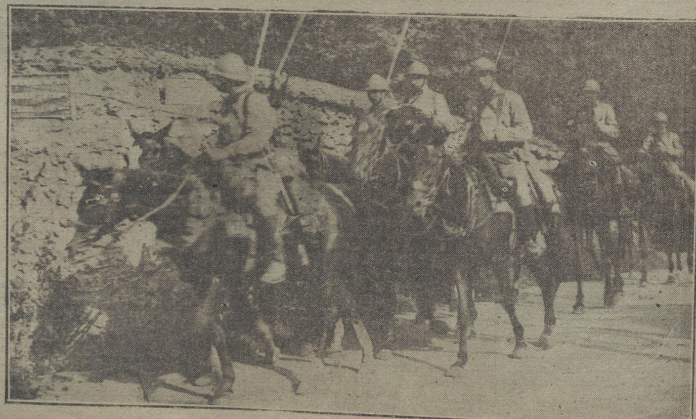
ENTRE LA GUERRA Y LA PAZ.—Caballería francesa, entrando en una localidad del Norte de Francia, que ha estado en poder de los alemanes desde el principio de la guerra.

Los ladrones se apoderaron de muchas alhajas de gran valor y ropa blanca, calculándose lo robado en unas 35.000 pesetas.