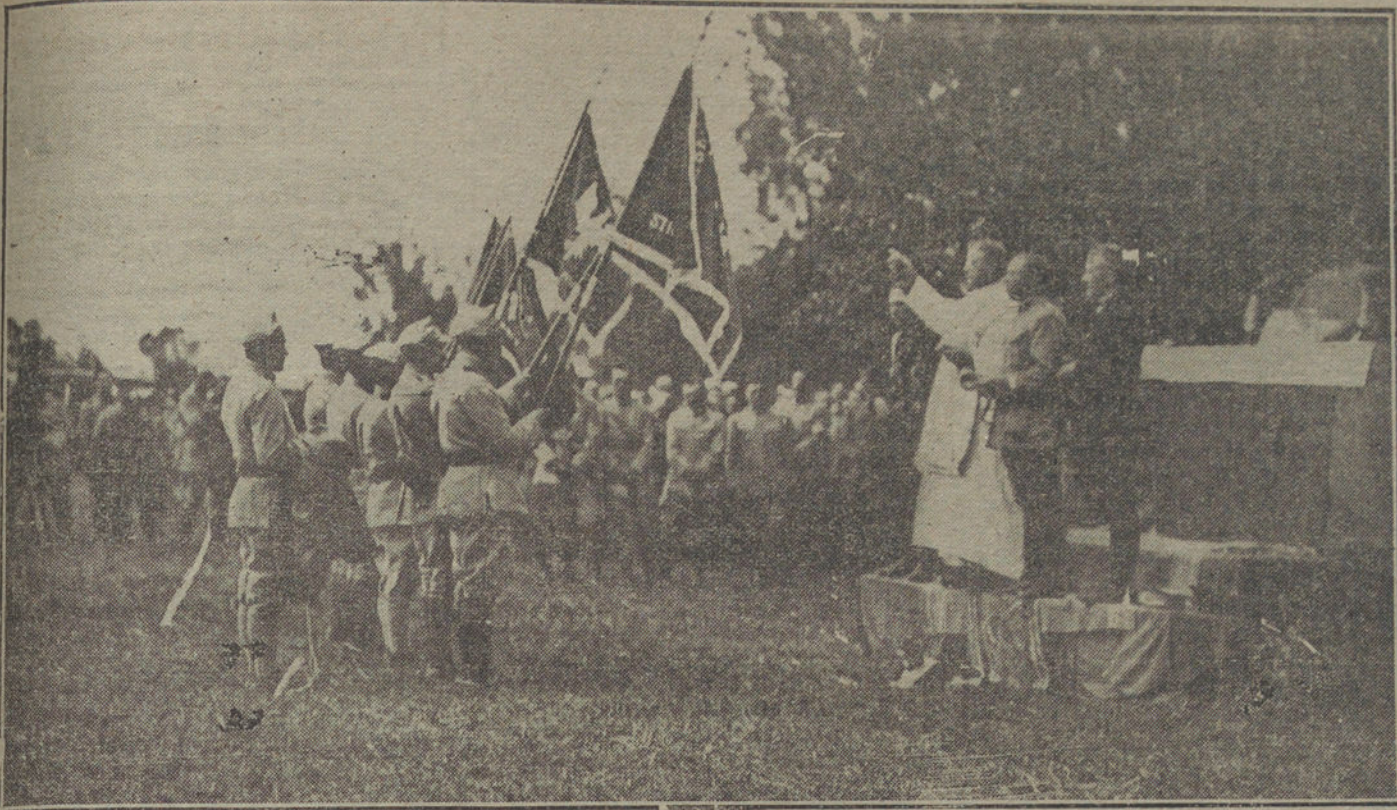
DURANTE EL ARMISTICIO.—Bendición de banderas polacas en el frente francés, 21 iniciarse la desmovilización de las tropas.

«Si Dios hubiera hecho de vino el mar...»