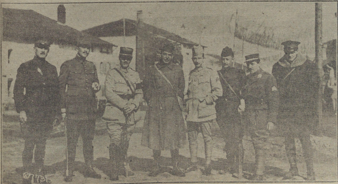
LA EJECUCION DEL ARMISTICIO. —Oficiales americanos, que están dirigiendo la desmovilización en el frente francés, acompañados de los intérpretes.

«Hemos de manifestar, en cuanto respecta a nuestro partido, que los socialistas no tendrán representación alguna en dicha Comisión. Nuestros compañeros, ni están dispuestos a perder el tiempo ni a ser instrumentos de ninguna habilidad.»