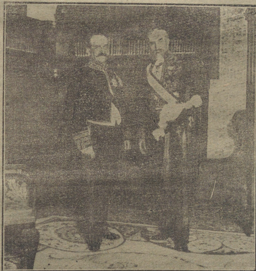
El nuevo embajador de Francia, con el conde de Romanones durante la visita que ha hecho al ministro de Estado, al término de la recepción.

El Soberano abandonó la estación para trasladarse á Palacio, siendo aclamado por el público.