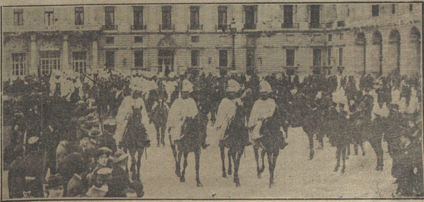
La comitiva que ha acompañado al nuevo embajador, á su llegada á Palacio.