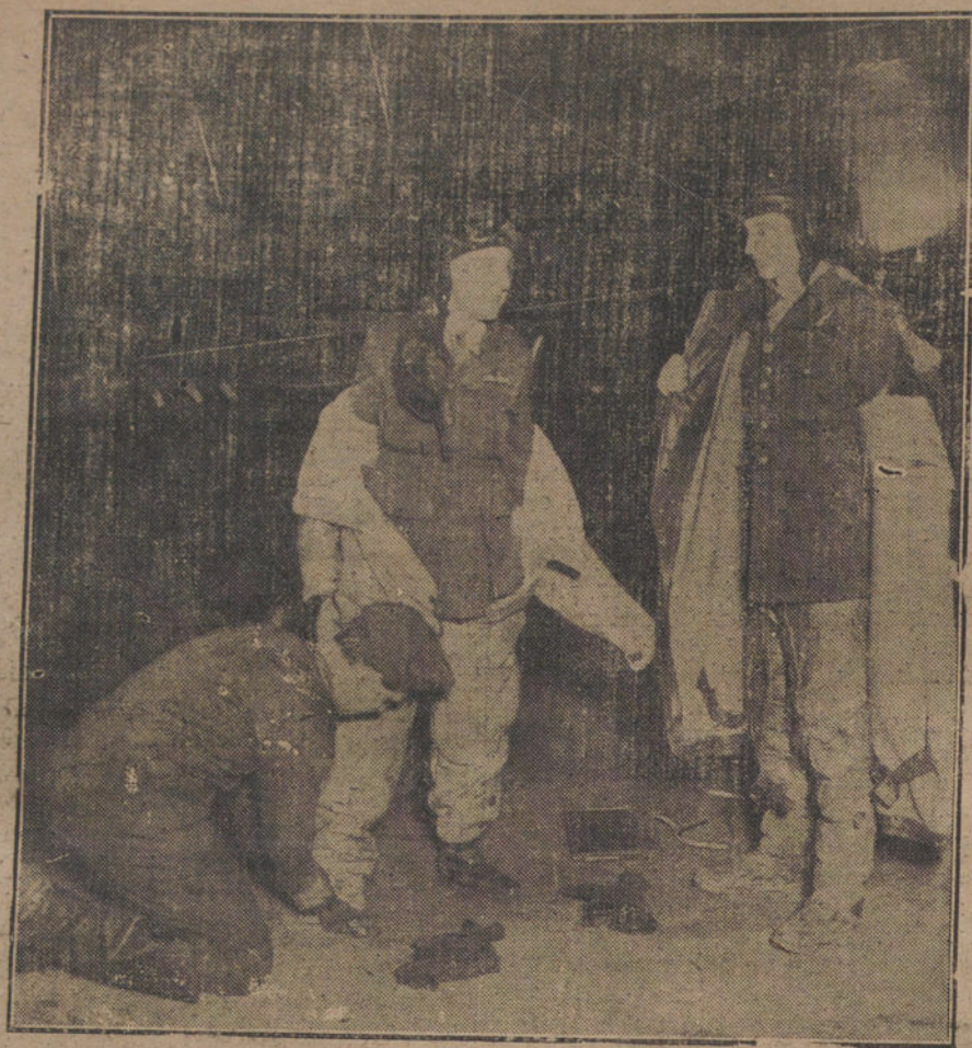
LA EJECUCIÓN DEL ARMISTICIO. Regreso de un avión de guerra después de un «raid» para vigilar las maniobras de evasión de los alemanes.

«Tipo por tipo, nuestros buques de guerra pueden rivalizar favorablemente en potencia con los de cualquier otra nación. Seis buques de guerra, cuyas quillas serán colocadas en breve, tendrán un desplazamiento de 43.000 toneladas, de un andar de 23 nudos, con una batería principal de 12 cañones de 16 pulgadas, siendo además fuertemente armados. Estos buques son los más poderosos navíos de guerra que hay en construcción actualmente.»