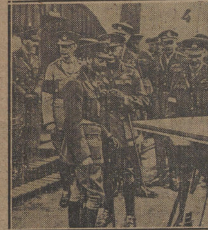
Numero 1, El automóvil que conduce al Rey de Inglaterra a su llegada a los campos de batalla de Francia.—Numero 2, Jorge V y Poincaré en una vagóneta, dirigiéndose a las antiguas líneas de fuego.—Numero 3, Los dos jefes de Estado visitando los sitios de los últimos combates.—Numero 4, El Rey de Inglaterra examinando los planos de las pasadas operaciones.

cumplimiento de la Real orden que sobre higiene de la prostitución dictó el Sr. Bahamonde, pocos días antes de abandonar el ministerio.