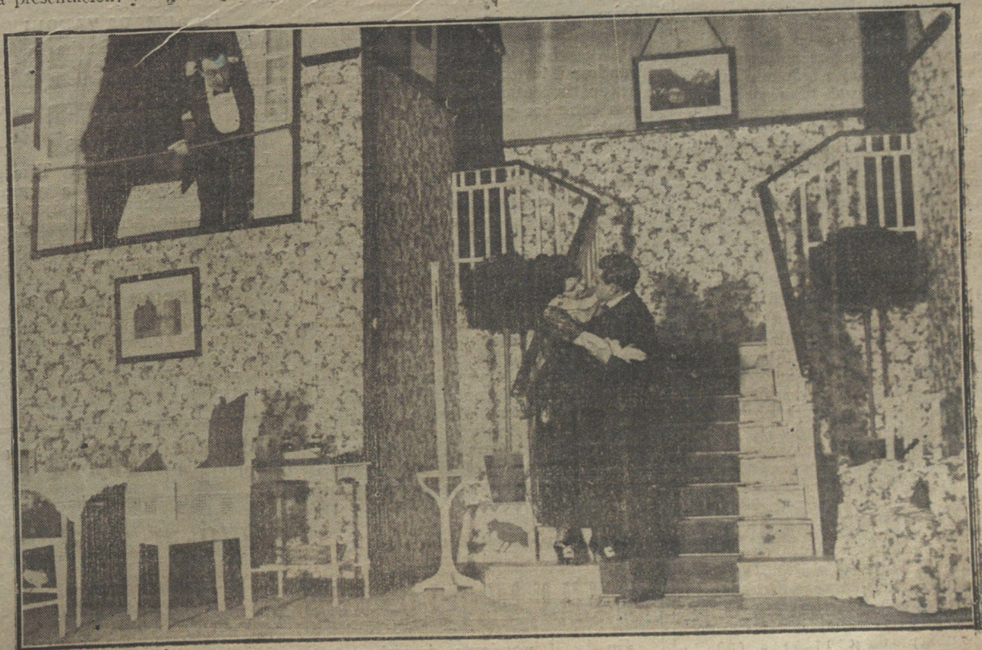
Una escena de «La corte de los gorriones», obra estrenada ayer en el teatro de la Infanta Isabel.

¿TIENE USTED QUE VENDER O COMPRAR ALGUNA CASA, SOLAR, MUEBLES O AUTOMOVIL? PASE ANTES POR LA SECCION DE COMPRA-VENTA DE «LA TRIBUNA».