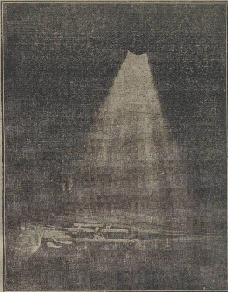
DE LA GUERRA A LA PAZ.—Un reflector poderoso iluminando un campo de aviación, donde actualmente se están reconcentrando las fuerzas militares aéreas.

Hoy día, que la victoria está ganada por la Entente, esta fórmula, como la de desarme general, es odiosamente abandonada por los que la defendían más.