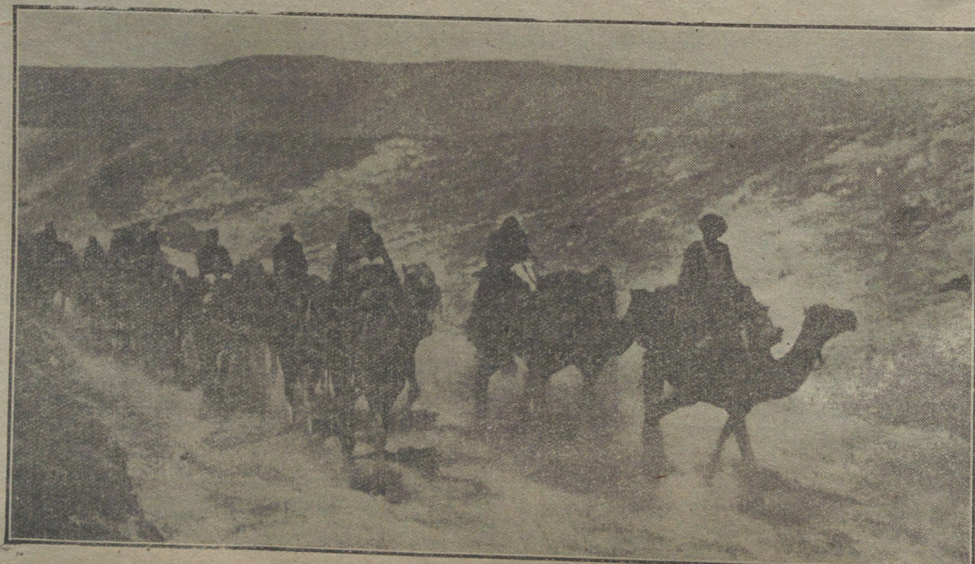
EN PLENO ARMISTICIO.—Un convoy llevando aprovisionamientos para la población civil de los territorios de Egipto.

El que no colabore, impide el cumplimiento de los acuerdos del Congreso de los Consejos de obreros y soldados, impide la socialización de empresas en condiciones para tal fin y arrastra la vida económica alemana a un abismo. Debe llamarse la atención del pueblo alemán a tal catástrofe, que destruiría el futuro de sus generaciones venideras. El Consejo central sacrificará todas sus energías para la realización de estas misiones. Condición primordial para ello es el mantenimiento del orden público, impedir