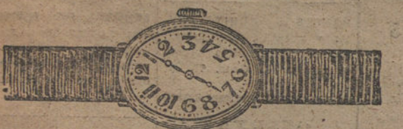
Núm. 4.—Forma ovalada, oro de ley 18 quilates, con pulsera de moiré. Ptas. 75. Con pulsera extensible » 115.