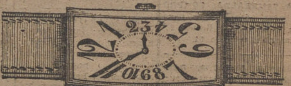
Núm. 18.—Rectangular en oro, ancora 15 rubies, oro de ley 18 quilates, pulsera moiré. Ptas. 150. En plata de ley » 75.