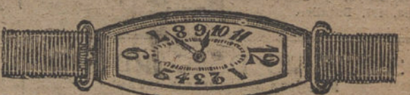
Núm. 19.—«Tonneau» alargado, ancora de precisión, pulsera moiré, oro de ley 18 quilates. Ptas. 175. En plata de ley » 85.

Factura de garantía en todas las compras