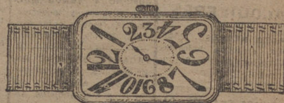
Núm. 15.—Ancora de precisión, 15 rubies, con pulsera de moiré, oro de ley 18 quilates. Ptas. 110. En plata de ley » 55.