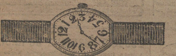
Núm. 6.—Forma «tonneau», oro de ley 18 quilates, con pulsera de moiré. Ptas. 90. Con pulsera extensible » 120.