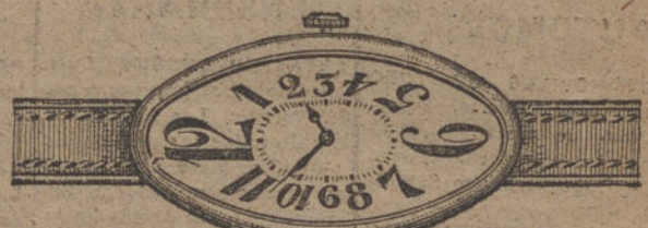
Núm. 17.—Ancora 15 rubies, pulsera de cuero, oro de ley 18 quilates. Ptas. 135. En plata de ley » 65.