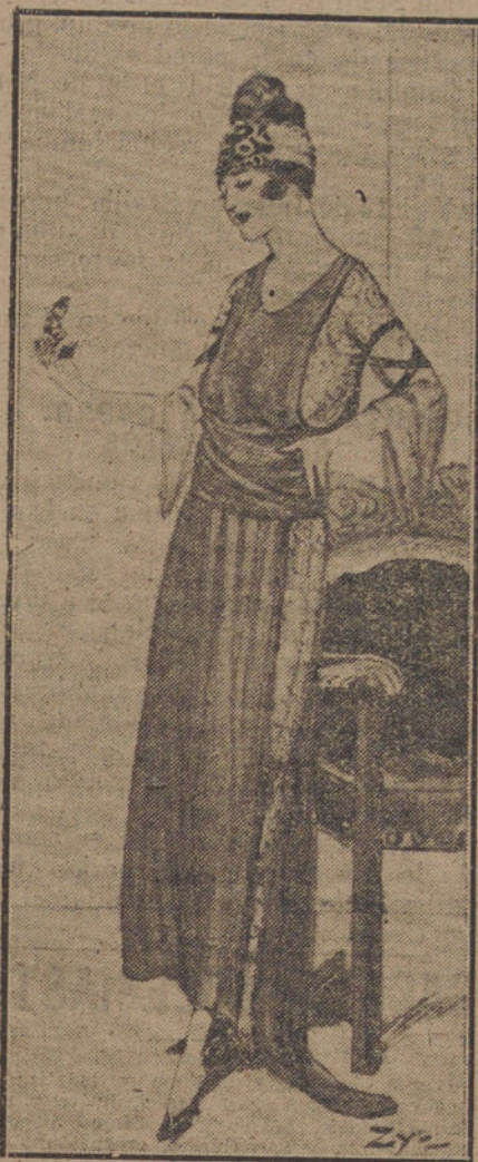
Traje de estilo japonés, creación de la casa inglesa Gown.