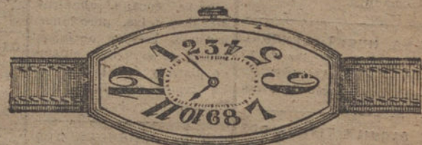
Núm. 16.—«Tonneau», ancora de precisión, pulsera de cuero, oro de ley 18 quilates. Ptas. 135. En plata de ley » 60.