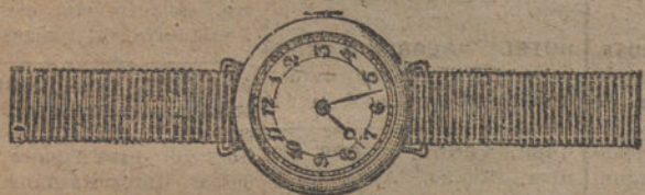
Núm. 1.—Máquina fina con 10 rubies oro de ley 18 quilates con pulsera de moiré. Ptas. 60. Con pulsera extensible » 90.