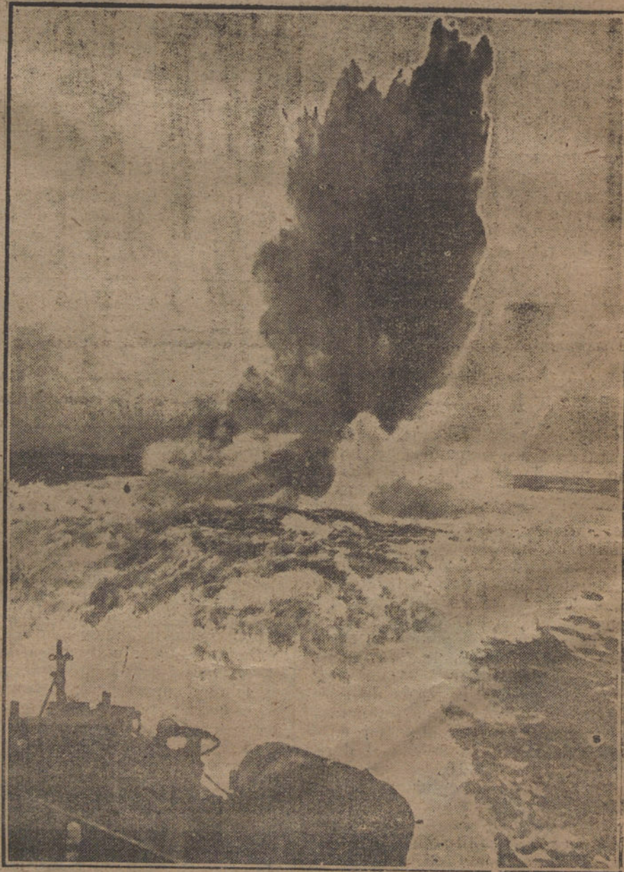
LA EJECUCION DEL ARMISTICIO.—Buques de la escuadra inglesa, destruyen un campo de minas.

Ya se verá cómo solucionados los problemas de ahora, surgen espontáneamente los mandatarios del pueblo, y la decadencia actual es estímulo de nobles y vigorosas rectificaciones futuras.