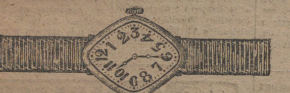
Núm. 5.—Forma rombo, oro de ley 18 quilates, con pulsera de moiré. Ptas. 80. Con pulsera extensible » 110.