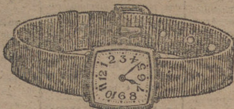
Núm. 7.—Ancora de precisión, 15 rubies, oro de ley 18 quilates, con pulsera de moiré. Ptas. 150. Con pulsera extensible » 200.