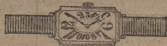
Núm. 10.—Ancora de forma, 16 rubies, oro de ley 18 quilates, con pulsera de moiré. Ptas. 160. Con pulsera extensible » 210.