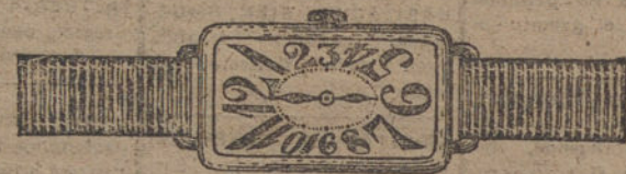
Núm. 9.—Ancora de forma, oro de ley 18 quilates, con pulsera de moiré. Ptas. 150. Con pulsera extensible » 200.