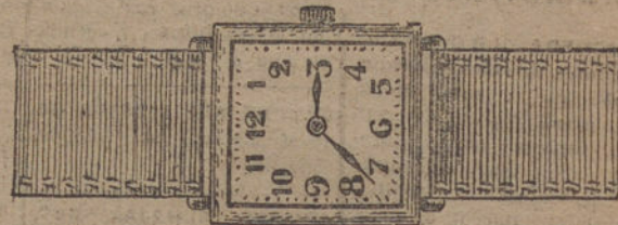
Núm. 14.—Ancora fina con pulsera de cuero, oro de ley 18 quilates. Ptas. 95. En plata de ley » 45.