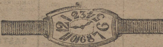
Núm. 8.—Ancora de precisión, 16 rubies, oro de ley 18 quilates, con pulsera de moiré. Ptas. 140. Con pulsera extensible » 190.