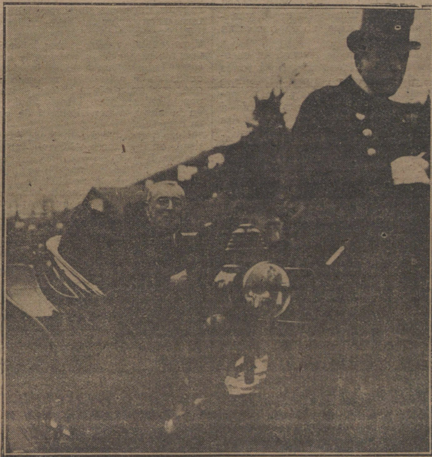
LA ESTANCIA DE WILSON EN PARIS.—El Presidente de los Estados Unidos, acompañado de Poincaré, visitando la ciudad.

Como ustedes ven, prosigo mi camino serenamente y con la conciencia