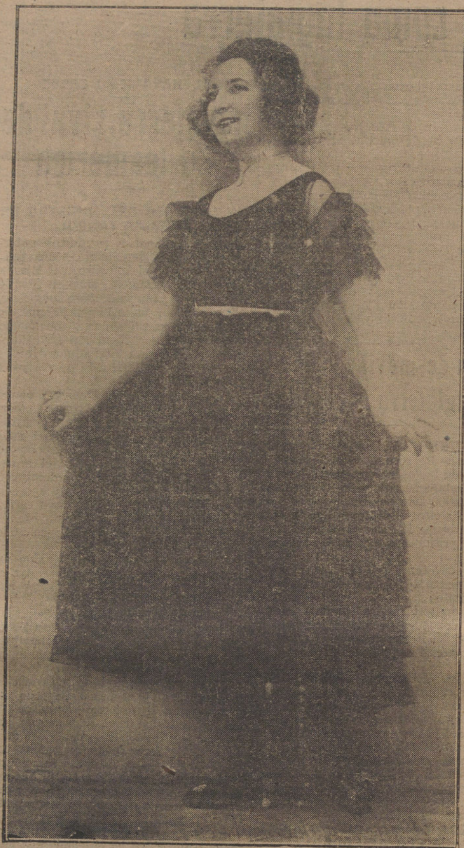
Elegante traje de tul plisado negro modelo de la casa Jenny.

Finlandia, para combatir contra los bolchevikis.