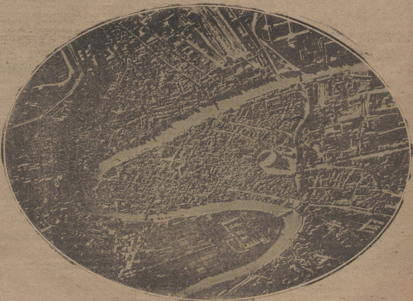
LA AVIACION Y LA GUERRA.—Vista de la ciudad de Verona, tomada a poca altura, desde un aeroplano austrohúngaro.

Una «paz Wilson» que reconcilie a los pueblos, que calme sus pasiones y sus odios, y dé a las gentes, enloquecidas por la guerra, nuevas esperanzas y