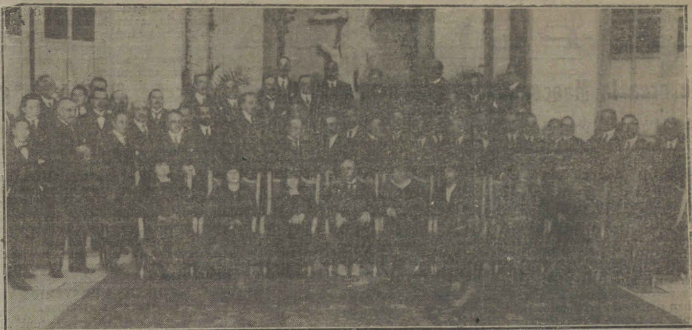
Grupo de asistentes al banquete, en honor del pintor Pinazo.

Ingenieros.—Dos comandantes, cuatro capitanes y cuatro tenientes.