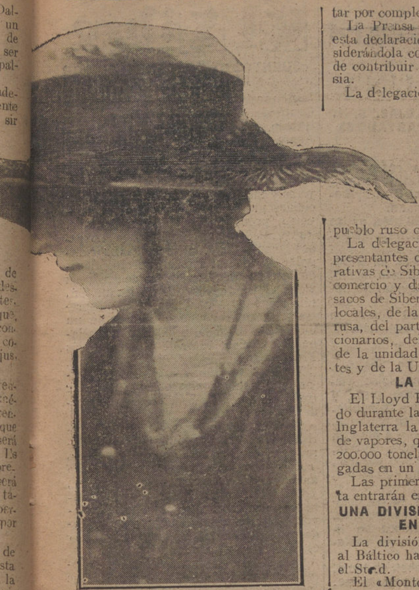
LA MUJER Y LA MODA. —Último modelo de sombrero, lanzado por las hadas de la moda madrileña.

nuevas perspectivas, podría todavía salvar a Europa.