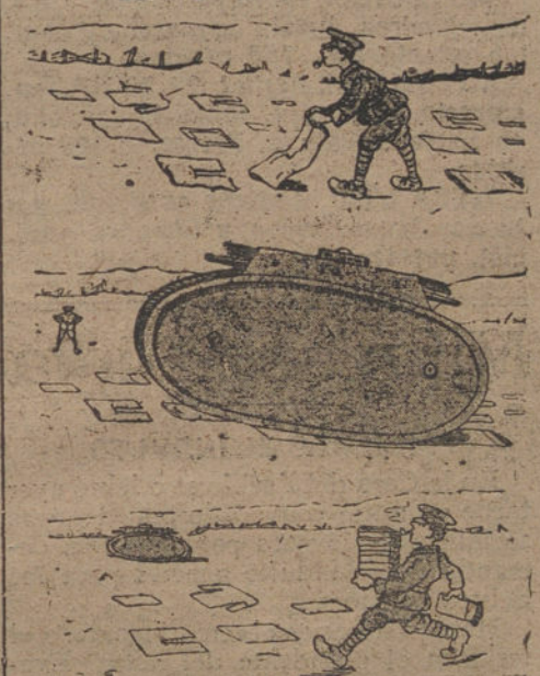
Cómo se las arregló el «Tommy» en campaña que le plantase un tanque la ropa de la compañía. (Del «Péle-Méle».)

Los aliados han sido advertidos del deseo del Presidente Wilson de que los Estados Unidos lleven la dirección y la administración de estos auxilios.