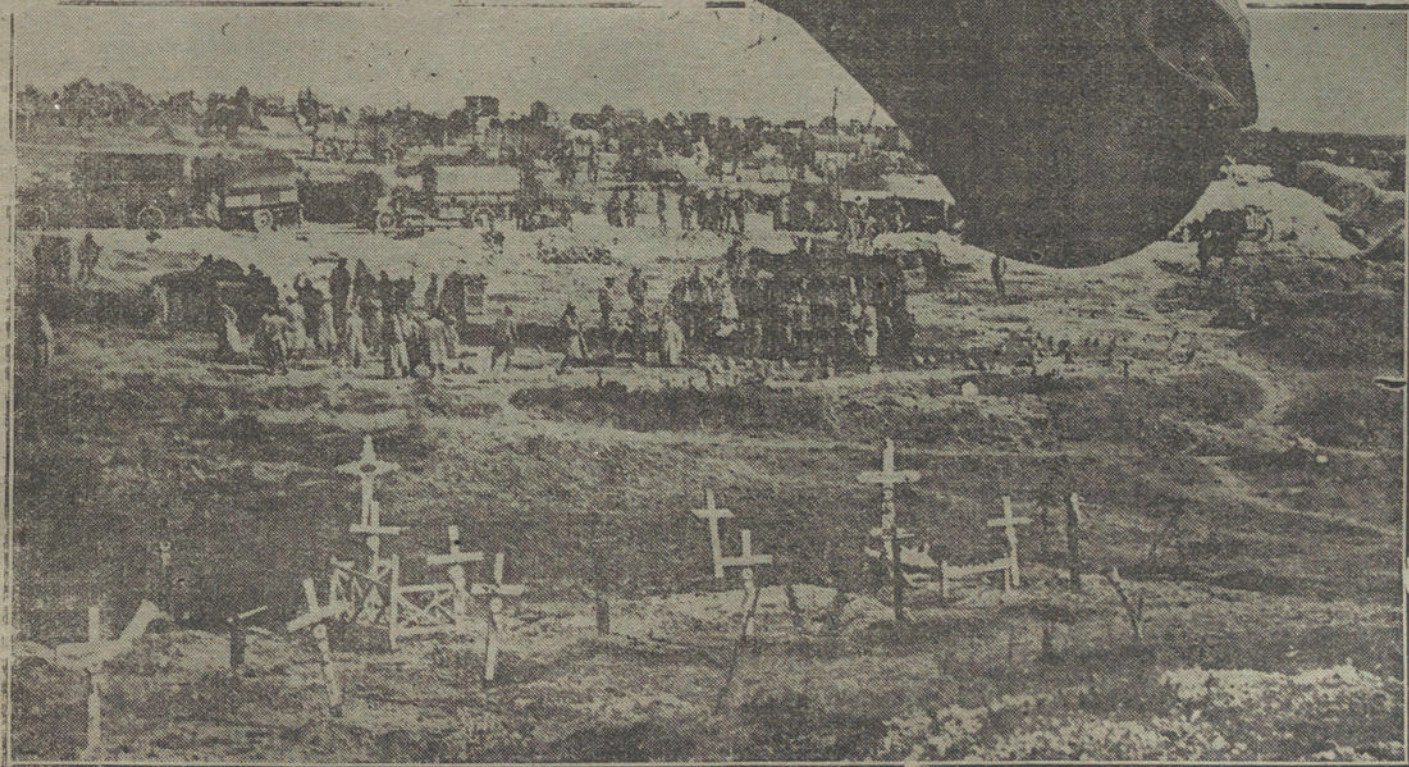
DURANTE EL ARMISTICIO. —Elevación de un globo francés de prácticas, sobre un campamento-cementerio, en Alerona.

Al final de la admirable conferencia, el insigne maestro, Amadeo Vives, fué aplaudido con entusiasmo y felicitadísima.