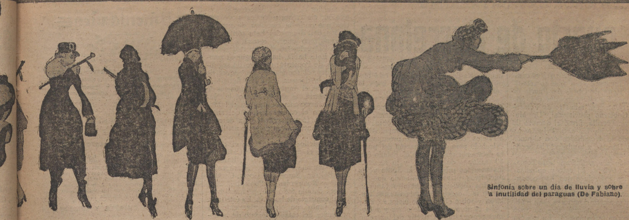
Sinfonía sobre un día de lluvia y sobre la inutilidad del paraguas (De Fabiano).