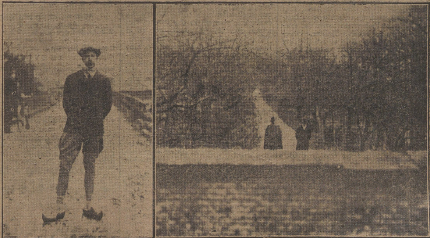
LOS REYES EN EL DELTERRO.—Fotografías del ex Kaiser y del Kronprinz, hechas hace unos días en el parque del castillo de Amerongen (Holanda), donde actualmente viven. Al ex Kaiser le acompaña el capitán von Exelmaus.