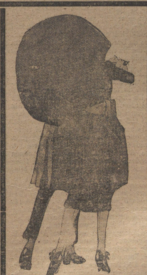
Acorde final y demostración de que el paraguas no es inútil.

Procedente de Nueva York entró el vapor «Harmuru», que trae importante cargamento de algodón. Durante la