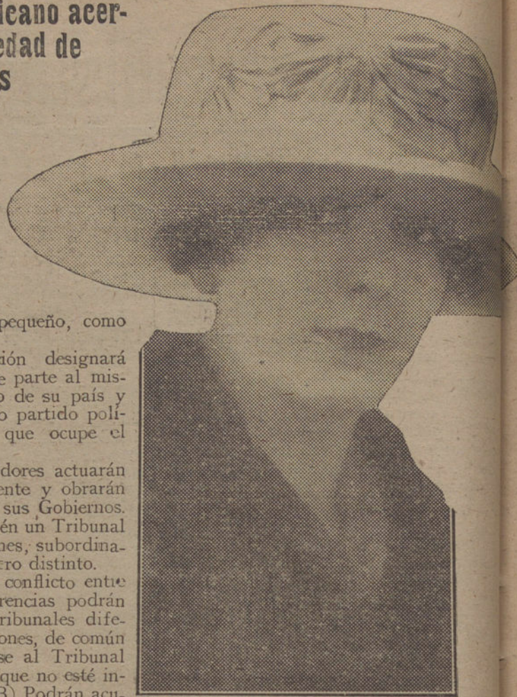
Elegante sombrero de mañana, última creación de las modistas madrileñas.

nuevo sus puertas oficialmente, bajo el reglamento de 1914. Hasta nueva orden, únicamente continuarán siendo admitidos los valores cotizados en 1914.