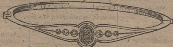
Núm. 4.—6 brillantes y zafiro. Pesetas 250.