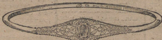
Núm. 5.—4 brillantes, diamantes y zafiro. Pesetas 275.