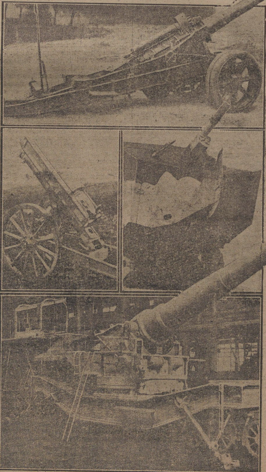
EL ARTE DE DESTRUIRSE.—Cañones y obuses de largo alcance, últimos modelos de la Artillería francesa.