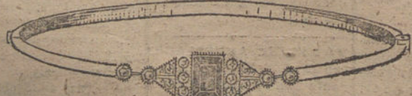
Núm. 7.—10 brillantes, diamantes y zafiro. Pesetas 350.