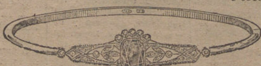
Núm. 8.—14 brillantes, diamantes y zafiro. Pesetas 400.