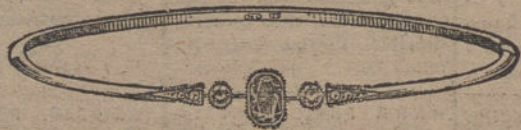
Núm. 1.—2 brillantes, diamantes y zafiro. Pesetas 175.

CON BRILLANTES DE PRIMERA CALIDAD :: :: DIAMANTES ROSAS DE HOLANDA ZIFROS FINOS :: MONTURAS DE PLATINO Y ORO DE LEY 18 QUILATES