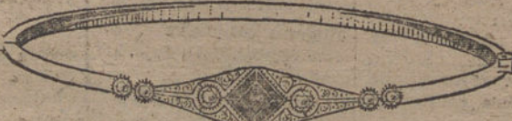
Núm. 6.—6 brillantes, diamantes y zafiro. Pesetas 300.