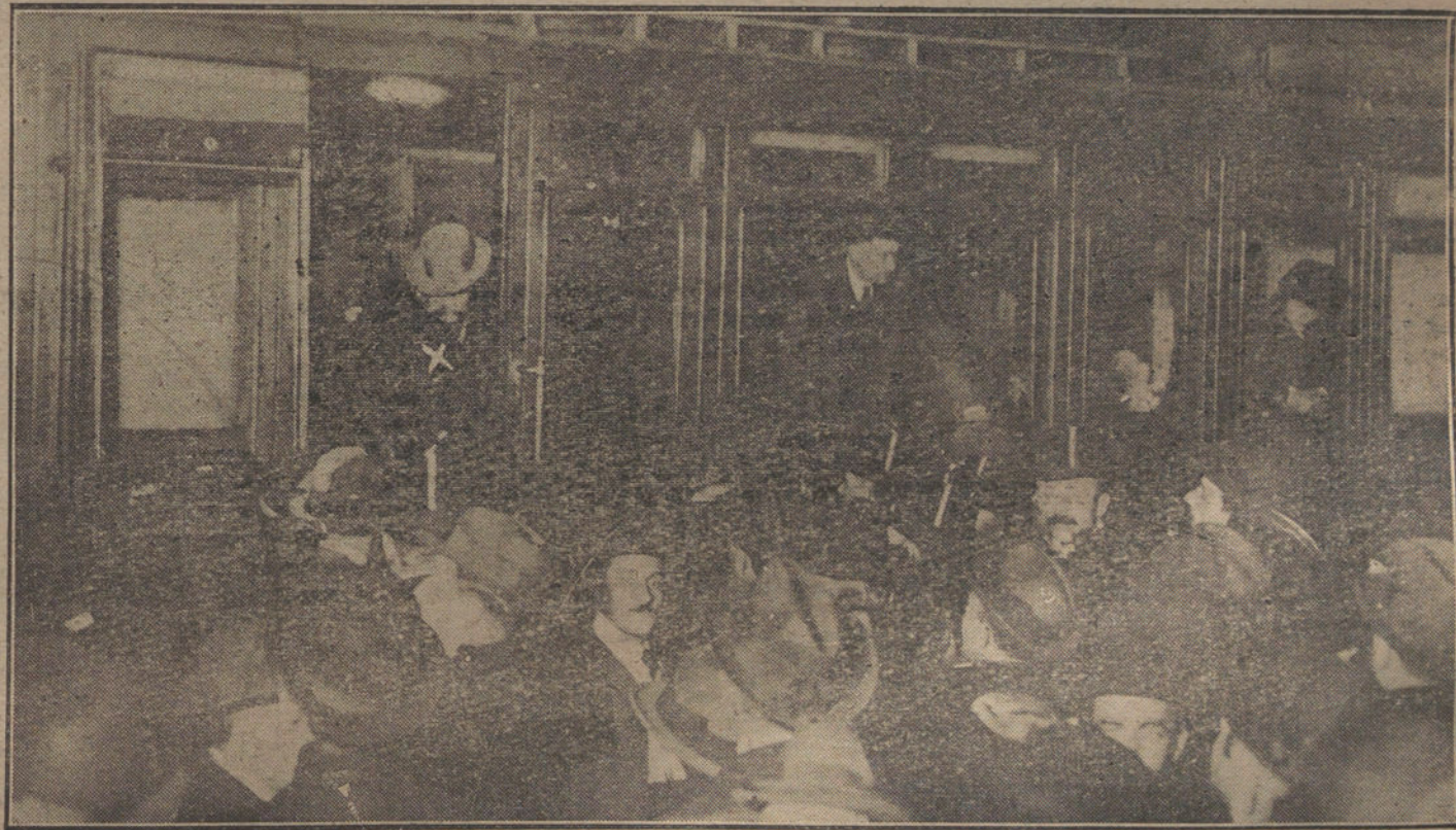
El público en los andenes de la estación de Atocha, despidiendo al embajador de Alemania (x), que marcha a Suiza.

«Hemos venido representando a las Corporaciones económicas y sociales de