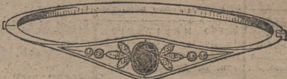
Núm. 3.—4 brillantes, diamantes y zafiro. Pesetas 225.