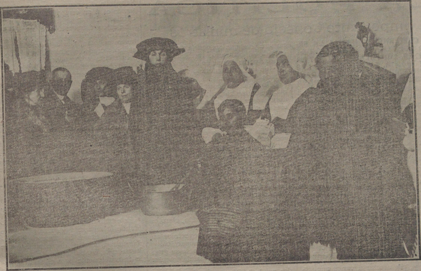
Su Majestad la Reina Doña Victoria, repartiendo comidas a los pobres del distrito de la Inclusa.

No es solamente en nombre del Derecho; en nombre de las grandes tradiciones revolucionarias de nuestro país, como protestamos de esas ideas locas y criminales de Clemenceau y Pichon. Es en nombre de los intereses franceses de todos los órdenes, y especialmente para que la desmovilización se efectúe rápidamente y para que no se imponga a nuestros heroicos soldados nuevos sacrificios, que no se tiene derecho a pedir, porque tales sacrificios no tendrán nada de común con la defensa nacional.