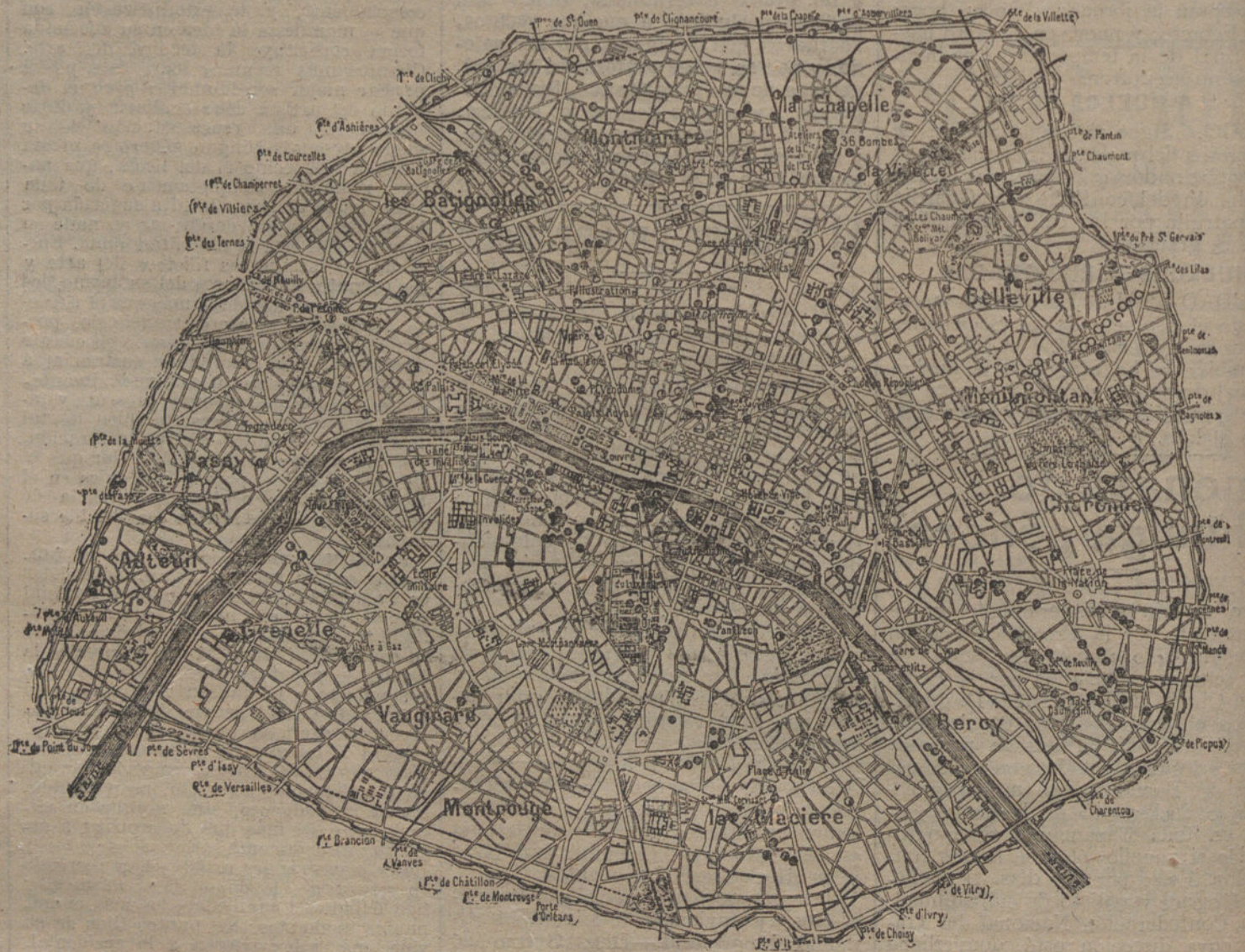
Gráfico de los sitios bombardeados en París por los zeplines y aviones alemanes durante la guerra, á pesar de los esfuerzos de la vigilancia aliada. Los círculos indican las bombas de los zeplines. Los medios puntos, las de los aviones, en 1914. Y los puntos, las de los aeroplanos, en 1918.

Entre los puntos importantes figura la prohibición para todo patrono, bajo pena criminal, de impedir la asociación.