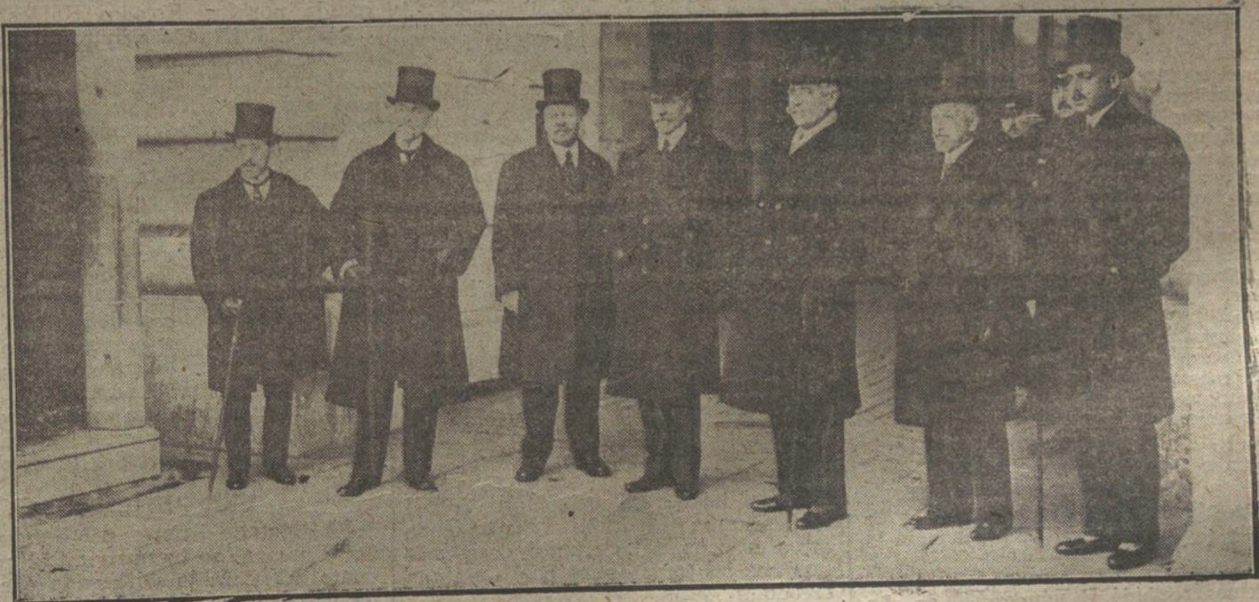
La Comisión de ingenieros civiles, que ha estado esta mañana en Palacio para ofrecer a Su Majestad la presidencia honoraria del próximo Congreso de Ingeniería.

Y la verdad es que sólo hay un perjudicado constante y resignado: el consumidor. Sólo éste; él es el pagano y el más desamparado.