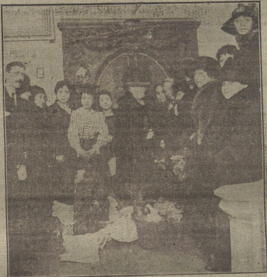
Su Alteza la Infanta Isabel, durante la visita que ha hecho hoy a la benéfica Institución del Taller del Obrero.

paz? Es posible creer en la sinceridad de estas afirmaciones?