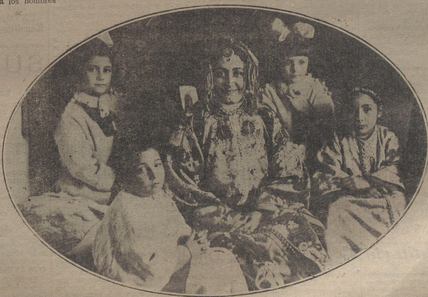
La notable tiple de ópera Mercedes Capis, que está actuando en el teatro de la Reina Victoria, de Melilla, durante el té que le fué ofrecido en casa del moro Sid Amad D'Amor.

Es también propósito del Gobierno pedir a las Cortes y obtener de ellas todas aquellas medi-