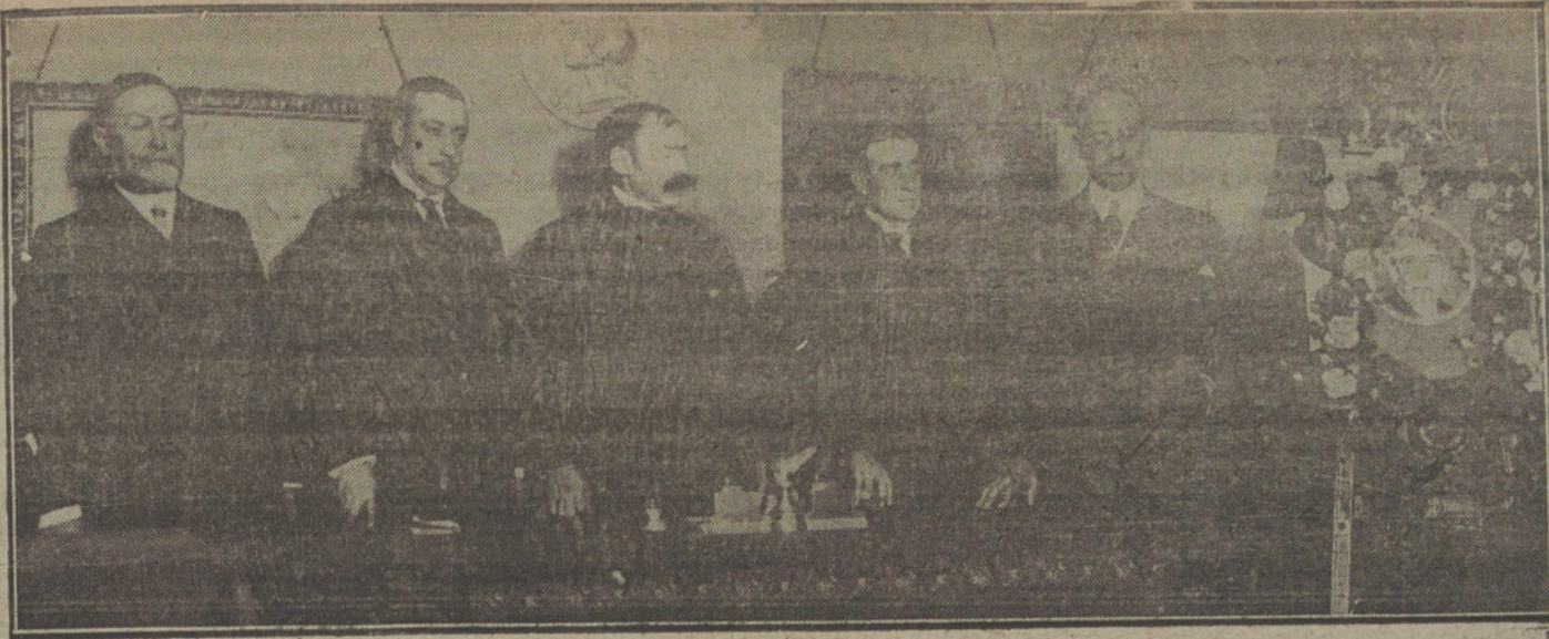
La presidencia de la sesión necrológica a la memoria del ilustre pintor valenciano Sr. Agrassot, celebrada en el salón del Circulo de Bellas Artes.

Sin embargo, es de absoluta necesidad se cumpla por todos la práctica sanitaria de la vacunación, único medio de combatir con éxito contra la viruela, enfermedad afrentosa para todo pueblo culto. En Madrid hay que insistir siempre en esta campaña, porque constantemente está recibiendo gente vacunada, procedentes de