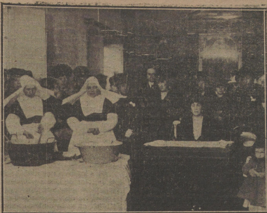
La Reina Doña Victoria repartiendo comida a los pobres en el Hospital del Carmen, acto celebrado hoy.

DEBE USTED LEER CADA DIA LA SECCION DE COMPRA-VENTA DE «LA TRINA». ENCONTRARA ALGO QUE PUEDE CONVENIRLE. BUNA».