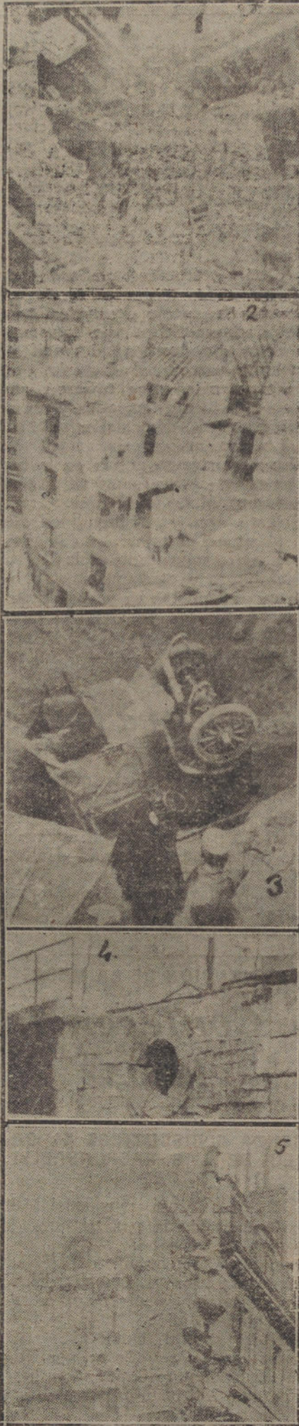
Fotografías de los destrozos causados por el bombardeo de París por el cañón gigante, en 1918.—1: En la calle de San Jorge.—2: En la calle de San Antonio.—3: En la calle Drouot.—4: En las Tuilerías.—5: En la calle de Richelieu-Mardi.

la mayor autoridad sobre las vías y el material.