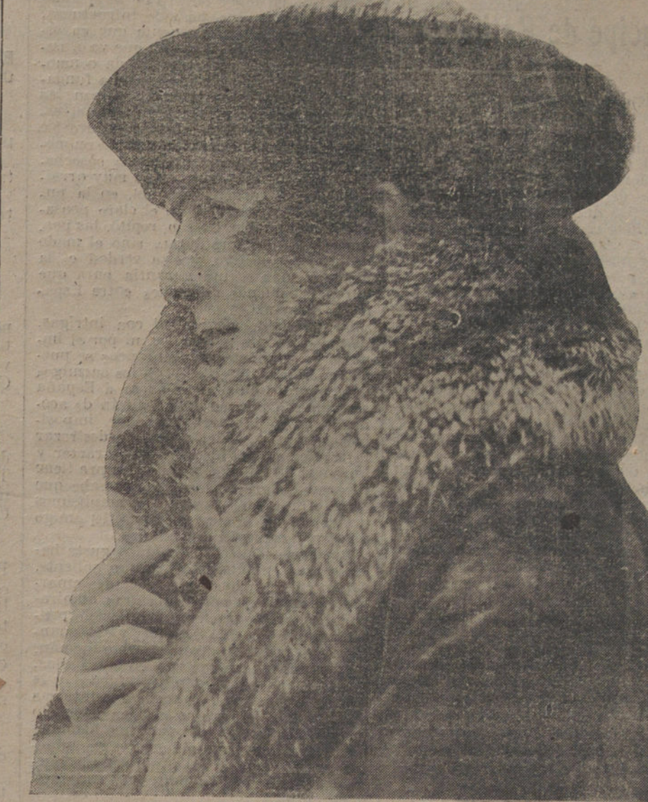
Sombrero de invierno y pieles, última creación de las casas madrileñas de modas.

Indicó la escasa fe que les merecía la Comisión extraparlamentaria, y que