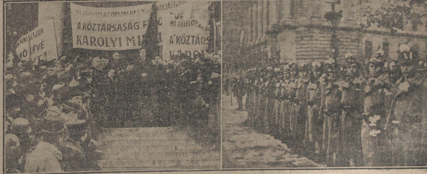
PROCLAMACION DE LA REPUBLICA EN VIENA Y BUDAPEST. —En las capitales de Austria y Hungría el movimiento revolucionario no revistió caracteres de desorden sistemático ni de sangrienta revuelta popular como en Rusia y en Alemania. Fué un cambio político, efectuado con entusiasmo, pero con disciplina. En nuestras fotografías se aprecian bien claramente estas características. La fotografía de arriba está sacada en el momento de proclamar la República de la Austria alemana en Viena, ante el Palacio del Parlamento (12 de Noviembre de 1918).—En la del centro se ven camiones cargados de soldados; éstos, así como los transeúntes, dan muestras de gran alegría y confraternidad.—Abajo, a la izquierda, el conde Miguel Karoly anuncia a la multitud, ante el Parlamento de Budapest, la proclamación de la República húngara.—A la izquierda, un destacamento de soldados luce los crisantemos blancos que les han regalado las mujeres, después del pronunciamiento.