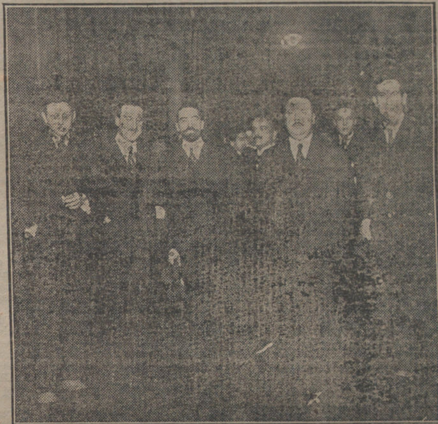
Don Indalecio Prieto (x), al terminar la conferencia que dió ayer en el Ateneo.

En la Mancha llegarchi á tener las de Andalucía un cuerpo de operaciones, que estuvo por bastante tiempo acampado en Manzanares, y obedecía á las órdenes, no de un general, sino de un procurador á Cortes. En vano se las quiso disolver por un decreto ni vencer por las armas; no se logró que desapareciera, ni aun después de una amnistía y de grandes reformas. Las deshizo, al fin, Mendizábal; pero no con la fuerza, si con la intriga y las esperanzas que hizo concebir á los pueblos. ¿No pensarían esas Juntas en confederarse como las de 1820 y 1808? No lo pensaron todas, por considerarse instrumentos más de guerra que de organización política; pero lo pensaron y lo hicieron las de Andalucía. Tuvieron éstas su Junta central en Andújar, y hablaron de potencia á potencia con el Gobierno de Cristina («Historia de España», por Dunham.—«Continuación