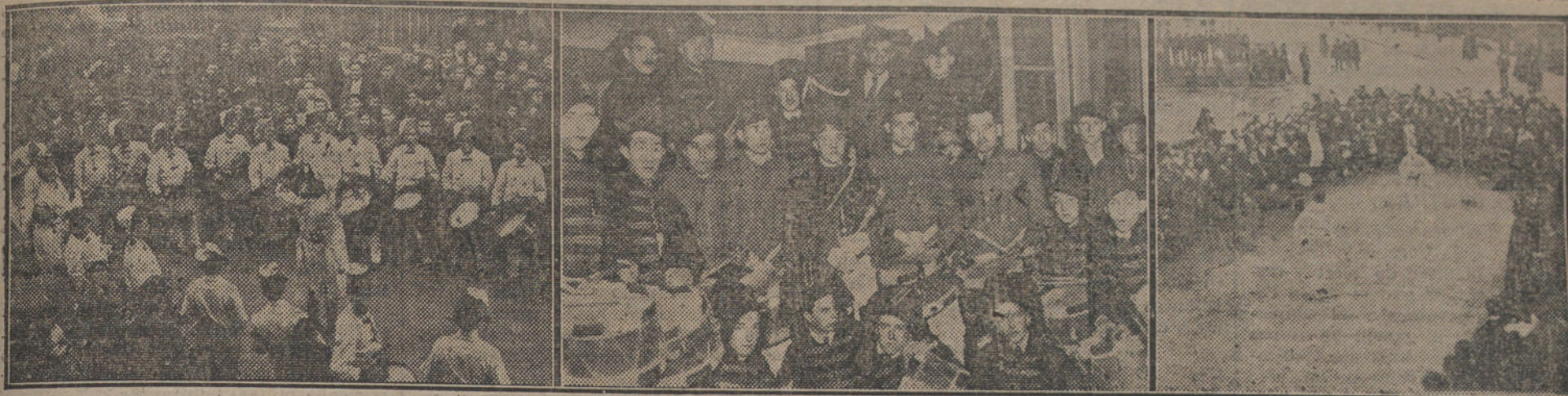
LAS FIESTAS DE SAN SEBASTIAN, EN SAN SEBASTIAN. —Para celebrar el día del Santo patrón, hubo infinidad de festejos en la preciosa capital. Nuestras fotografías reproducen una tamborilada en el barrio del Antiguo; los socios del Basti.Club disfrazados para hacer otra tamborilada; «Aurreskun» al aire libre en la plaza del Mercado.