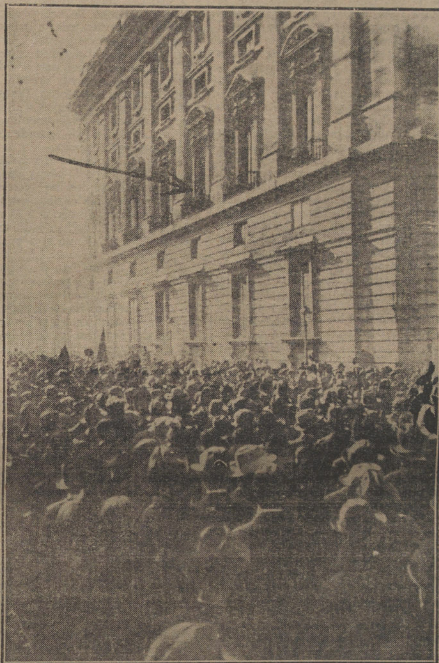
Imponente manifestación de cariño á Don Alfonso XIII. El pueblo aclamándole esta mañana. El Rey saluda desde uno de los balcones de la plaza de Oriente