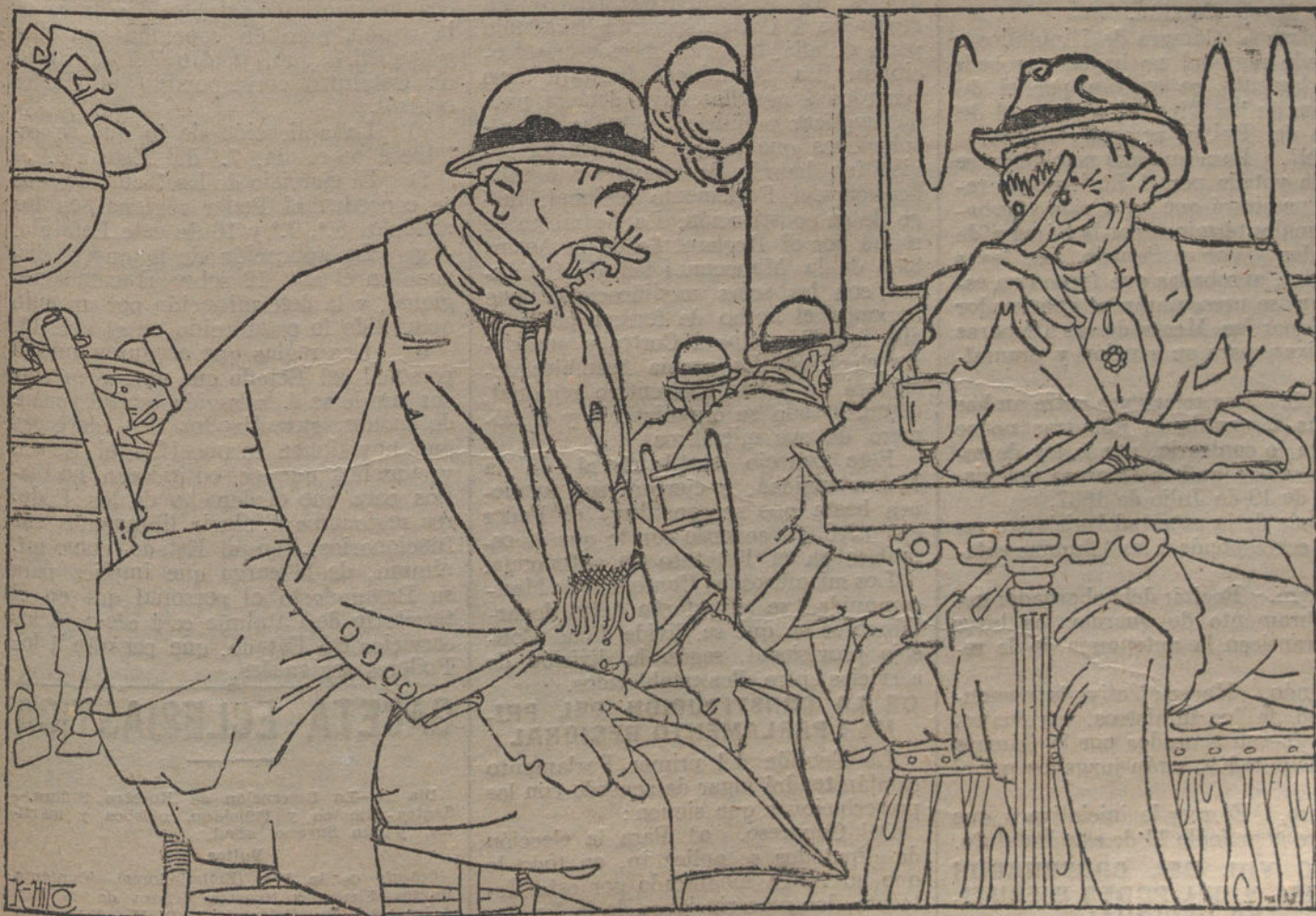
EL RESIDENTE EN MARRUECOS

Todos los bienes del Estado, comprendidos en los artículos 339 y 340 del Código civil, afectos al cumplimiento de los servicios de que se hará cargo el Poder regional, pasarán á ser de la propiedad de la región. Quedarán, igualmente, transferidos los derechos del Estado, nacidos de actos de soberanía ejercitados en el territorio de