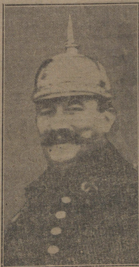
El general Berenguer, nuevo residente en Marruecos.

El jefe del Gobierno ha conseguido, al fin, que acepte el general Berenguer el cargo de alto comisario en Marruecos.