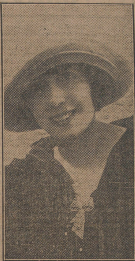
La graciosa artista francesa mademoiselle Mistinguett, sirviendo de maniquí para exhibir uno de los últimos modelos de sombrero.

Se están formando muchos batallones de voluntarios, que irán a someter a las fuerzas monárquicas.