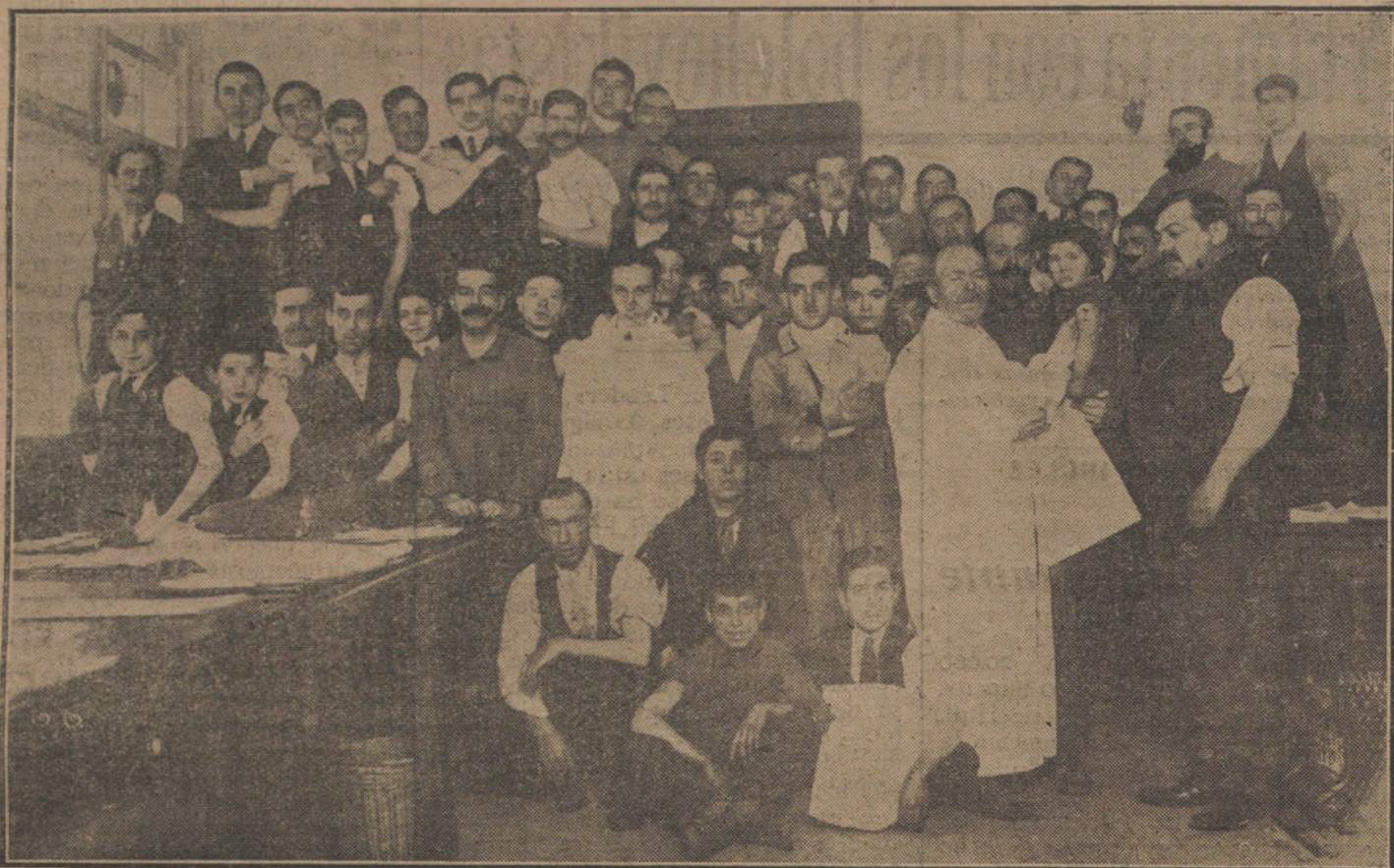
LA CAMPANA CONTRA LA VIRUELA. Los operarios de los talleres de imprenta, fotografiado, estereotipia y máquinas, vacunándose.