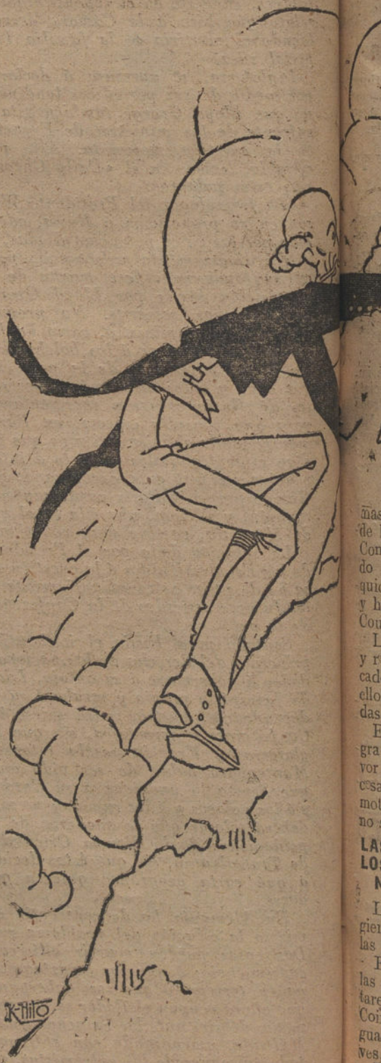
SUBE, MARIANA, SUBE La cuesta de Enero. (Caricatura de K-HITO.)

JEREZ. Con motivo de la fiesta del santo del Rey, se inauguró el nuevo cuartel de Caballería. Lo ocupa el regimiento de Caballería de Villaviciosa.