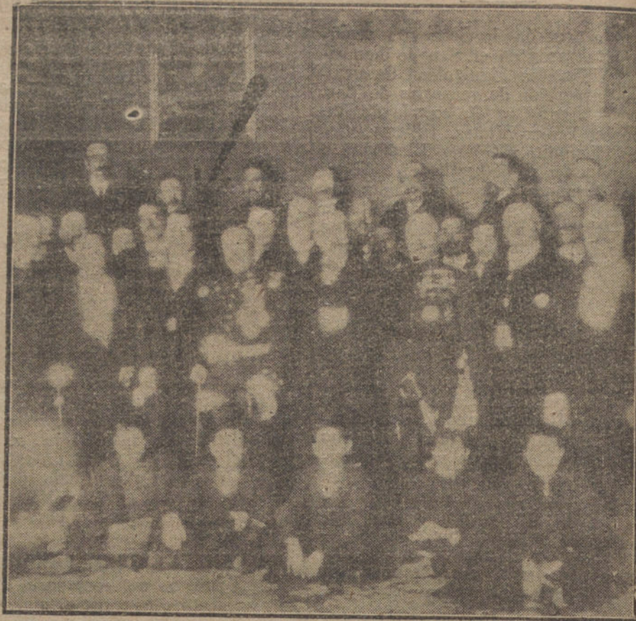
EL SANTO DEL REY, EN AVILA.—El Gobernador, D. Cristóbal de Castro, en la recepción oficial, que se celebró por primera vez, a iniciativa suya, en el Gobierno civil.

«Parlamento catalán» llaman los catalanes al organismo que el Gobierno central llama «Diputación general de Cataluña». A poco que rasquemos en la corteza del léxico nos encontramos con que la organización es igual en ambos sentidos. Parlamento o Diputación, en una y otras bases, se componen de dos grupos: uno, electivo—por sufragio universal—(nombrado Congreso en catalán y «parte electiva» de la Diputación en castellano), y otro corporativo, en el cual tendrán representación, según el Estatuto del Gobierno, los Ayuntamientos y Diputaciones, y, según la Mancomunidad, los senadores «elegidos por el voto de los concejales de Cataluña».