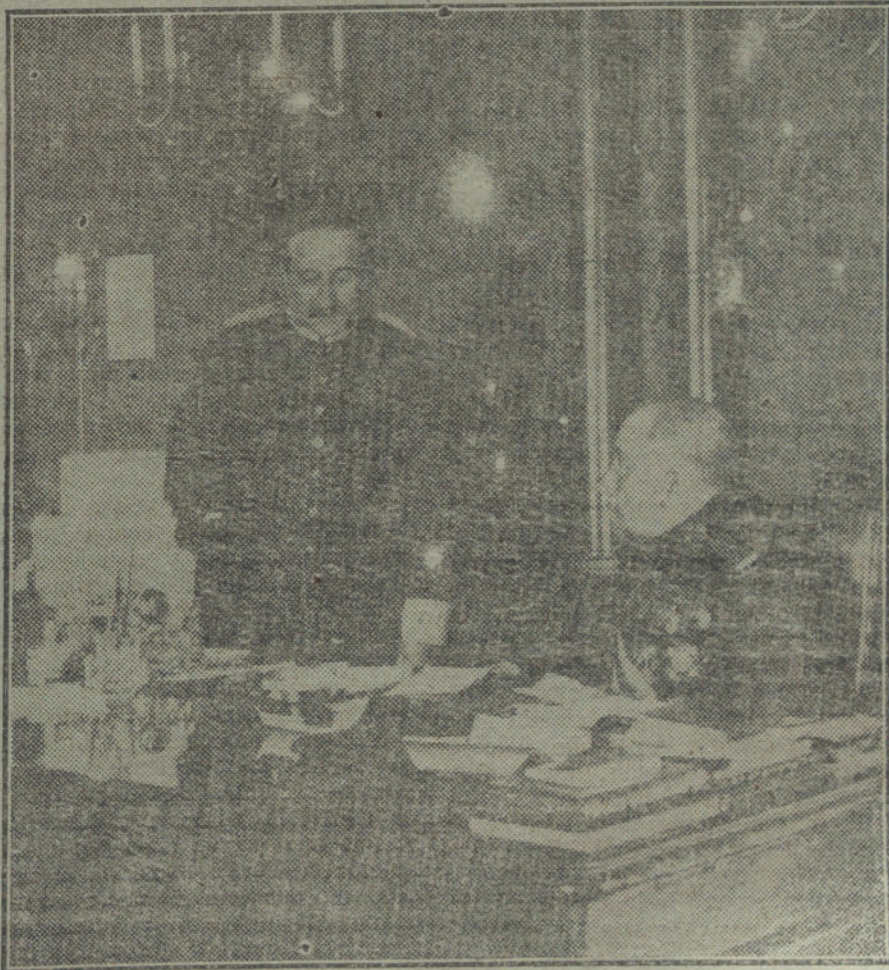
El nuevo ministro de la Guerra, general Muñoz Gago, despachando con el subsecretario del ministerio, después de haber tomado posesión de su cargo.

El problema catalán no se arregla a tiros ni con dictaduras suicidas. Semejante política sería el fin de España en corto plazo.