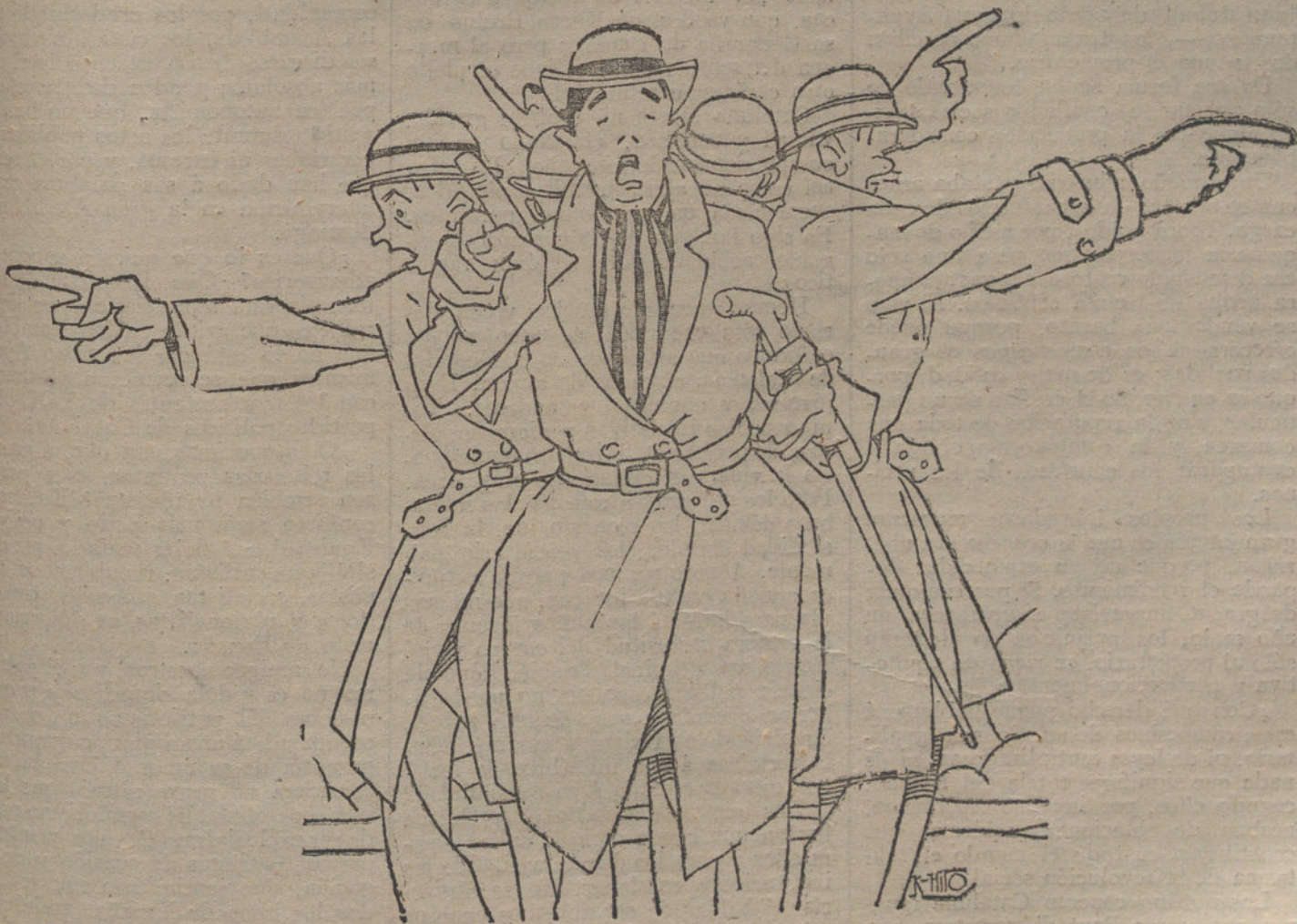
EL DARADERO DE BRAGANZA

La Artillería cañoneó con excelente resultado Cacia y Aujo.