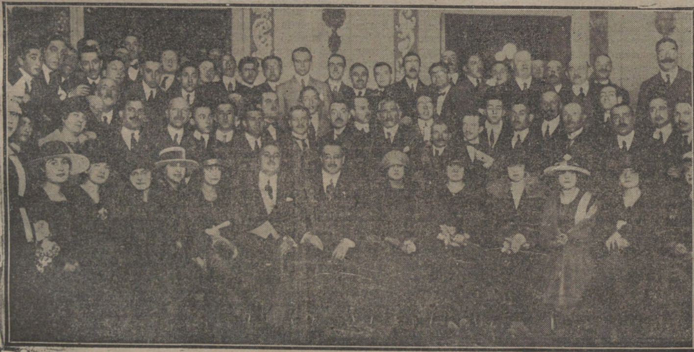
El alcalde, rodeado de los invitados a la recepción de ayer en el Ayuntamiento, con motivo del Congreso de Sanidad civil.

Se tomaron diferentes acuerdos sobre el régimen interior de la Institución. El