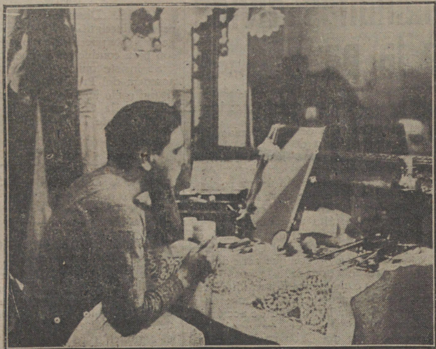
LA FUNCION DE LA PRENSA.—El formidable TITO SCHIPA, preparándose para hacer el «Leonardo», de «La bruja».

Afirmase que ninguno de los nuevos Estados constituidos en el territorio de la antigua Rusia participará en la Conferencia de la isla de los Príncipes.—Hallet.