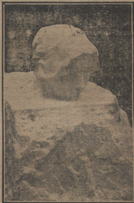
«Pensamiento», mármol firmado por Rodin, del que se han hecho reproducciones vendidas como originales, no sabiéndose hoy, a ciencia cierta, cuál es ni dónde está el verdadero original.