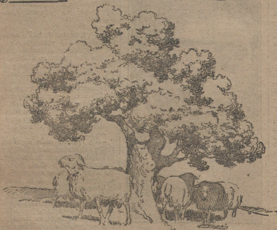
(Dibujo de AGUSTIN.)

—Eso que voy a contaros ocurrió cuando los animales tenían el don de hablar; así me lo aseguró el tío Lucas, dueño del rebaño. Si es verdad o no, allá él. Mi cuento sólo se reduce a referir el suceso como él me lo contó, sin añadir ni punto ni coma.