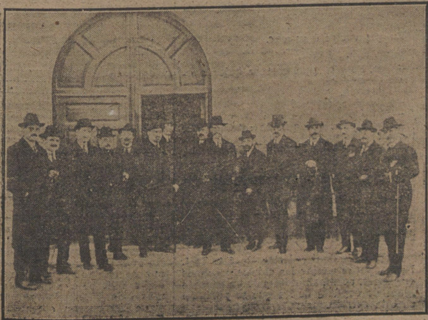
LA ACTUALIDAD EN BADAJOZ.—Comisiones de las Diputaciones provinciales de Badajoz y Océano, que en reciente reunión han formulado el proyecto de bases para la autonomía municipal y regional de Badajoz.

ALGECIRAS. En el correo llegó el general Berenguer. Le esperaba el alcalde, el gobernador militar, los jefes y oficiales de la guarnición. Embarcaba en el «Príncipe de Asturias», que le conducirá a Tetuán.