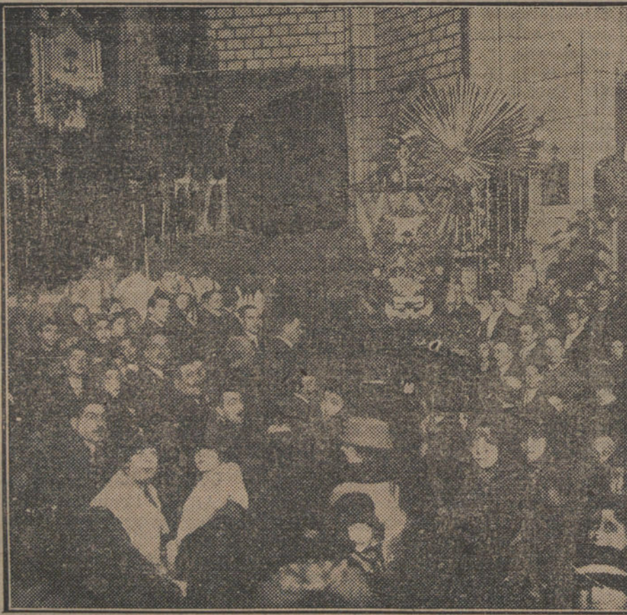
LA ACTUALIDAD EN MADRID.—Bendición del estandarte que han regalado a la Asociación del Montepío Comerciario Madrileño sus fundadores, en conmemoración del XX año de su fundación.

huelguistas de esa industria, y la razón que tenía estaba en su demanda de aumento de jornal. La agitación empezó en una sola fábrica; pero, como suele acontecer en la India, y también algunas veces en Inglaterra, el movimiento huelguista se extendió como un reguero de pólvora por todas las fábricas de algodón en aquella región. Como consecuencia de la huelga, se produjeron desórdenes, que motivaron la intervención de la tropa, y en varios casos fué preciso disparar desde un automóvil blindado sobre la muchedumbre, causando víctimas.