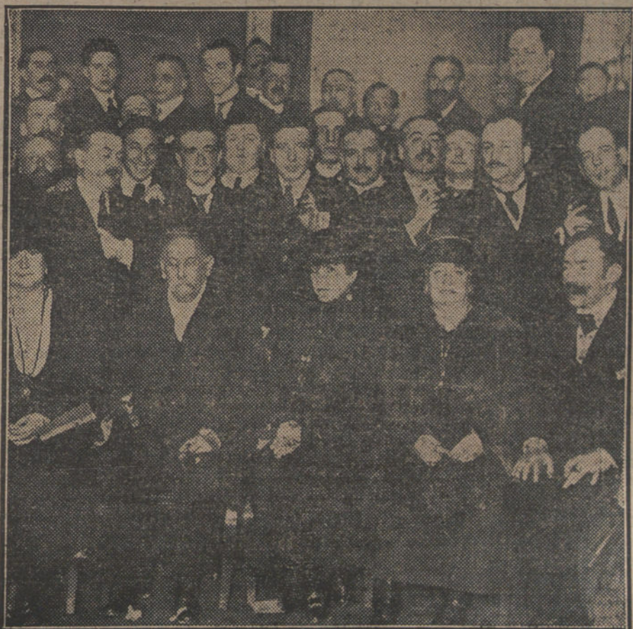
LA ACTUALIDAD EN MADRID.—Asistentes al banquete dado en honor del gran asustador Vitorio Macho, que ha regalado á Madrid la estatua de Galdós, metalada recientemente en el Retiro.