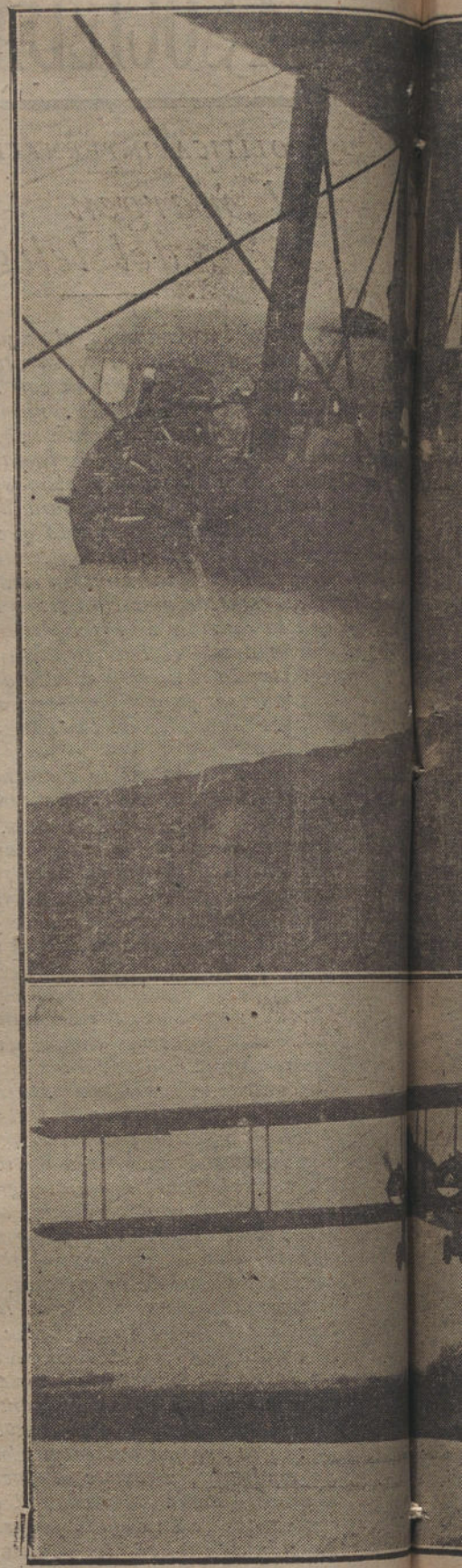
DENTRO DE POCO TIEMPO VIAJAREMOS EL... sido adoptado para hacer el trayecto París-Madrid... bina.—II: Interior de la misma, capaz para... III: El biplano de dos hélices, en plena... cialmente, muy en... Fotogr...

«Los telegramas llegados con retraso, que se ocupan de los recientes motines ocurridos en las fábricas de algodón de Bombay, no explican con mucha claridad la causa de estos desórdenes. Ha habido más de 100.000 obreros