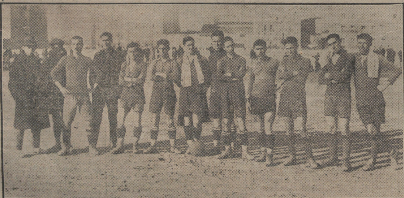
EL DEPORTE EN MADRID. —El equipo Alfonso XIII, de Palma de Mallorca, que jugó ayer un partido de «foot-ball» contra el Ayuntamiento de Madrid.