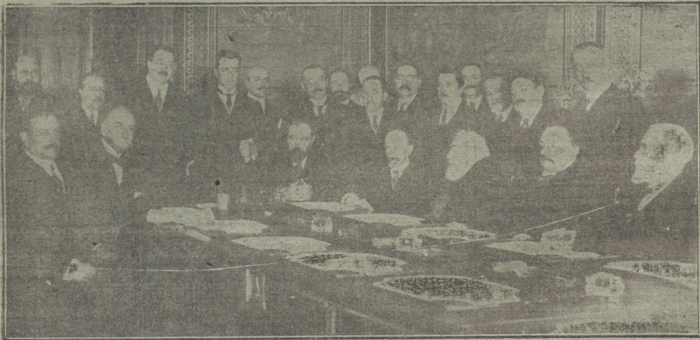
EL DIRECTO A VALENCIA. —Los diputados y senadores por Madrid, Cuenca y Valencia, los presidentes de las Diputaciones, reunidos bajo la presidencia del alcalde de Madrid para acordar la mejor manera de ejecutar el proyecto.

DEBE CONSTRUIRSE EL DIRECTO MADRID-VALENCIA, PORQUE MADRID ESTARA A MENOS DE SEIS HORAS DEL MAR; PORQUE ES DE NECESIDAD ESTRATEGICA; PORQUE DARA VIDA A TRES PROVINCIAS; PORQUE ABARATARA LAS MERCANCIAS QUE VENGAN DE ORIENTE AL INTERIOR; PORQUE EL FERROCARRIL SERA PROPIEDAD DEL ESTADO; POR MUCHAS RAZONES MAS