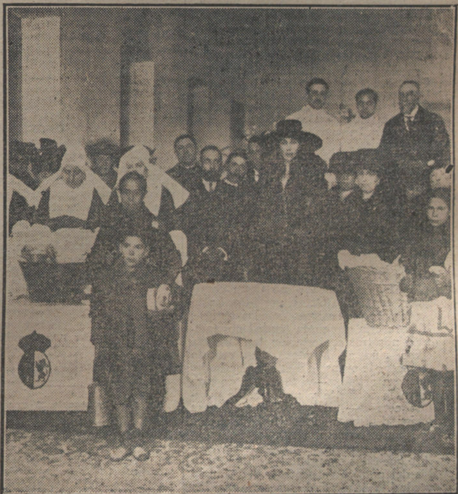
LA CARIDAD DE LA REINA.—S. M. Doña Victoria repartiendo comida á los pobres que proteja el Patronato de San José.