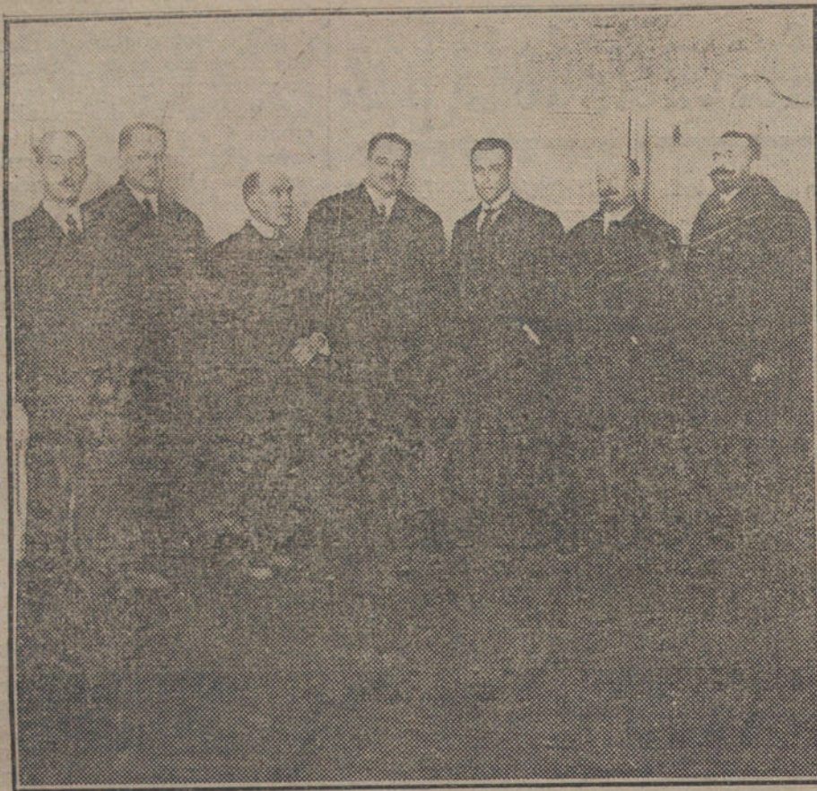
EL DIRECTO A VALENCIA. —El alcalde de Madrid con los presidentes de las Diputaciones de Madrid y Valencia y los representantes en Cortes de ambas provincias, en la reunión que celebraron ayer para dar un impulso definitivo al beneficioso proyecto.