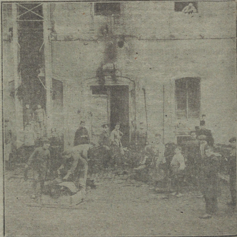
EL INCENDIO DE ANOCHE. —Soldados sacando ropas y útiles de entre los escombros, una vez sofocado el fuego.