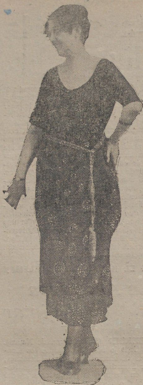
Elegantísima bata de casa, creación de una modista madrileña.

que los instigadores no son precisamente los alemanes que tienen otras preocupaciones de más importancia que la de ocuparse en crear dificultades á España, cuya hospitalidad no han de olvidar nunca.