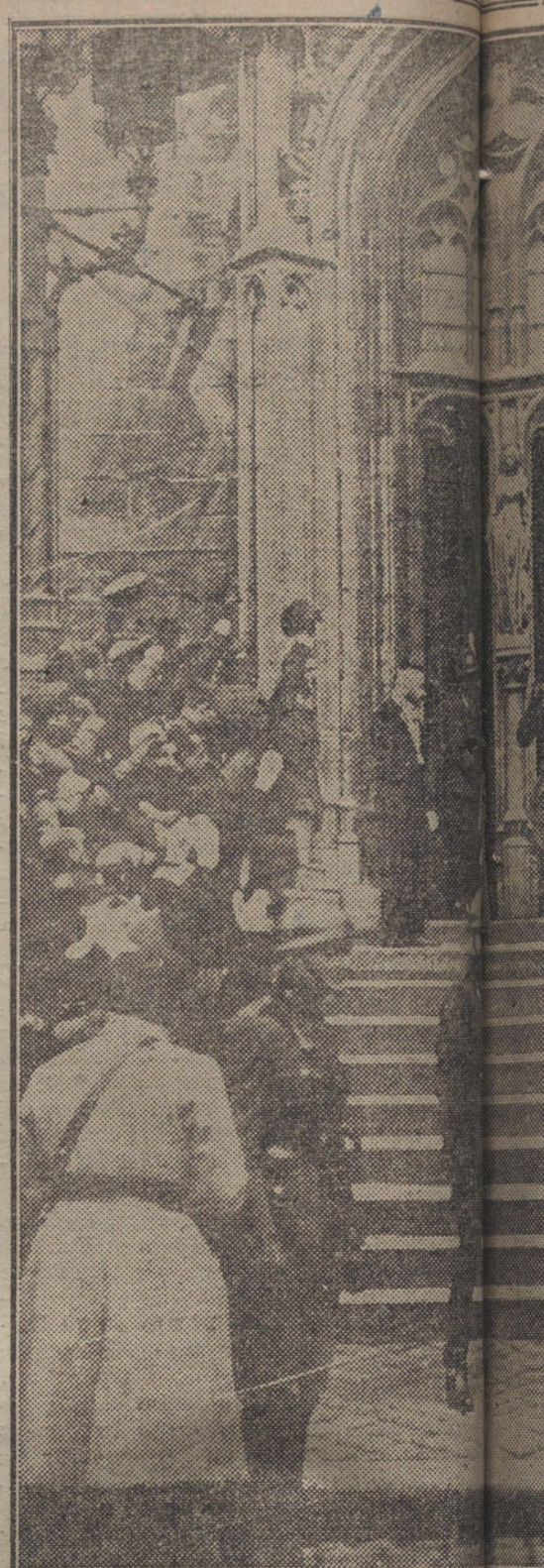
DESPUES DE LA GUERRA.—La Reina y las aclamaciones de la Fotografía

Oficial» un decreto que decide que el idioma judicial en Alsacia y Lorena será la lengua francesa, en la cual deben ser redactados los pleitos, requerimientos, sentencias, juicios, órdenes y decretos, tanto ante el Tribunal Superior, como ante los Tribunales regionales; los debates podrán tener lugar en el dialecto local ó en alemán; pero únicamente por decisión del presidente de la Audiencia y cuando todas las personas que tomen parte declaren saber el dialecto local ó el alemán y no poseer el francés de un modo suficiente para ello.