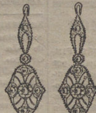
Núm. 2.—4 brillantes y diamantes. Ptas. 250.