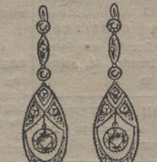
Núm. 7.—6 brillantes y diamantes. Ptas. 400.