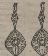
Núm. 6.—4 brillantes y diamantes. Ptas. 375.