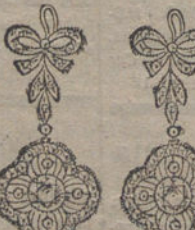
Núm. 10.—6 brillantes y diamantes. Ptas. 550.