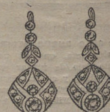
Núm. 8.—8 brillantes y diamantes. Ptas. 450.