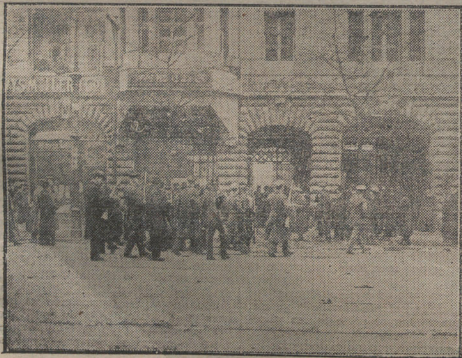
LA REVOLUCION EN BERLIN. —Grupo de espartaquistas, asaltando la redacción del «Vorwärts».

Si las proposiciones del Presidente Wilson quedan enterradas, el capitalismo colonial, cuyos excesos son har-