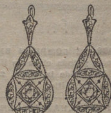
Núm. 4.—2 brillantes y diamantes. Ptas. 300.