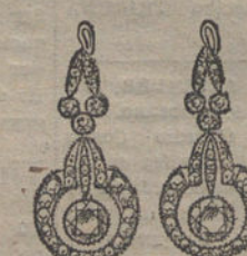
Núm. 11.—8 brillantes y diamantes. Ptas. 625.