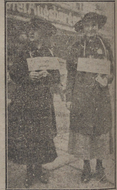
LAS ELECCIONES EN BERLIN. —Dos muchachas repartiendo candidaturas del partido nacional alemán.

«La cuestión de las colonias alemanas ha quedado en suspenso. El con-