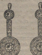
Núm. 5.—4 brillantes y diamantes. Ptas. 325.