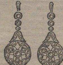
Núm. 3.—2 brillantes y diamantes. Ptas. 275.