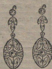
Núm. 1.—4 brillantes y diamantes. Ptas. 225.

CON BRILLANTES DE PRIMERA CALIDAD :: :: DIAMANTES ROSAS DE HOLANDA MONTURAS DE PLATINO FINO Y ORO DE LEY 18 QUILATES CONTRASTADO