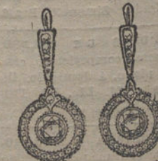
Núm. 12.—4 brillantes y diamantes. Ptas. 700.

Factura de garantía en todas las compras.