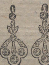
Núm. 9.—10 brillantes y diamantes. Ptas. 500.