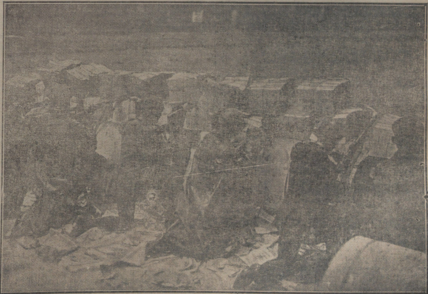
LA REVOLUCION EN BERLIN.—Grupo de espartaquistas, que después de asaltar y saquear la redacción del «Vouwaerter», hacen frente á las tropas gubernamentales, parapetados en una barricada improvisada con botinas y paquetes del periódico.