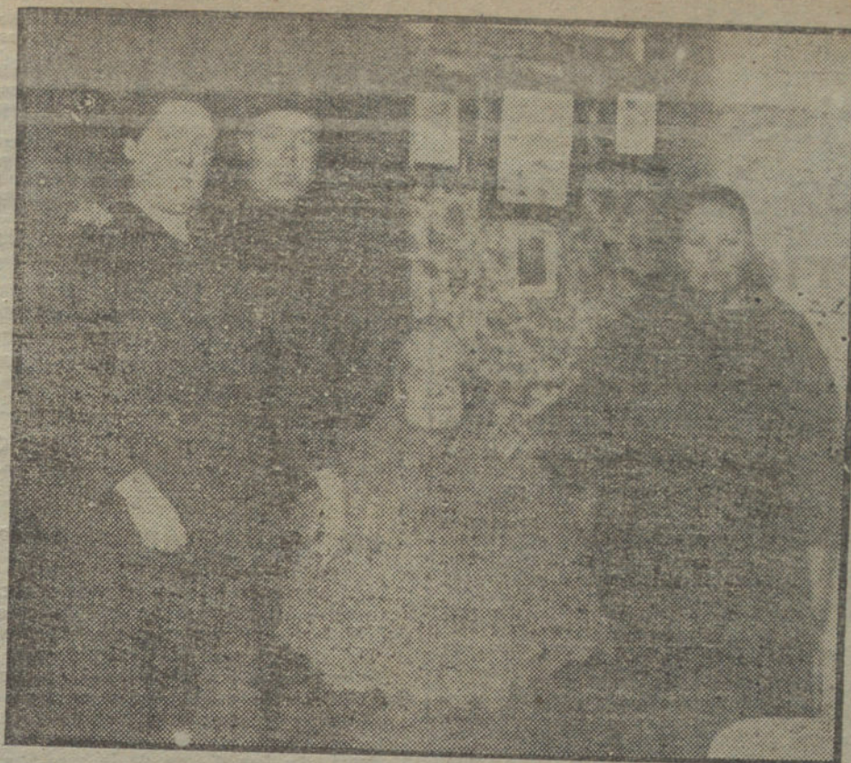
LA DESAPARICION DEL «FEDERAL».—La familia del popular industrial: En el centro, la esposa; a su izquierda, la hermana, y a su derecha, los hijos pequeños.