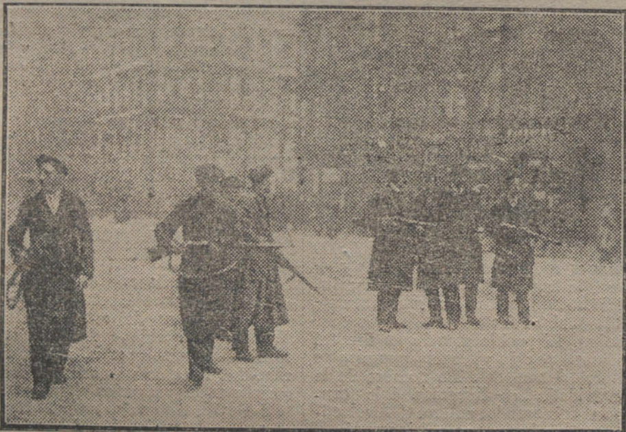
LA REVOLUCION EN BERLIN.—Paisanos ayudando á las tropas gubernamentales á mantener el orden y combatir á los espartaquistas

Fomento.—Real orden disponiendo que la Compañía naviera The Liverpool Brazil and River Plate Steam Navigation abone una patente de 1.500 pesetas por sus buques «Herschel» y «Holbein», para poder dedicarse al transporte de emigrantes.