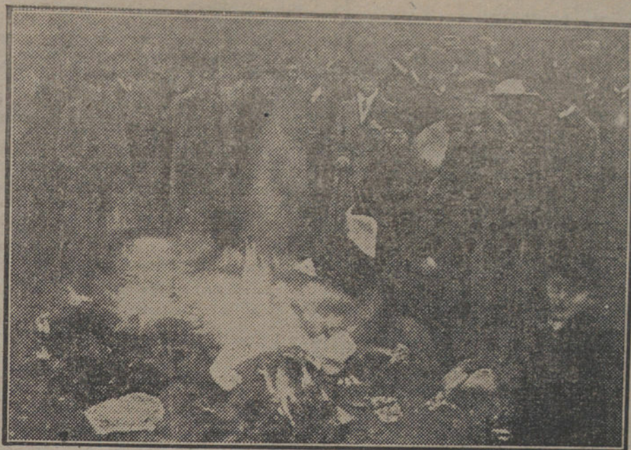
LA REVOLUCION EN BERLIN.—Los espartaquistas quemando en plena calle los documentos que contenían el archivo de la Dirección de Policía.

BADAJOS. Los diputados portugueses y el teniente Garboso entraron en la Redacción del periódico local «La Región Extremeña», pretendiendo que rectificase la información publicada sobre la conspiración.