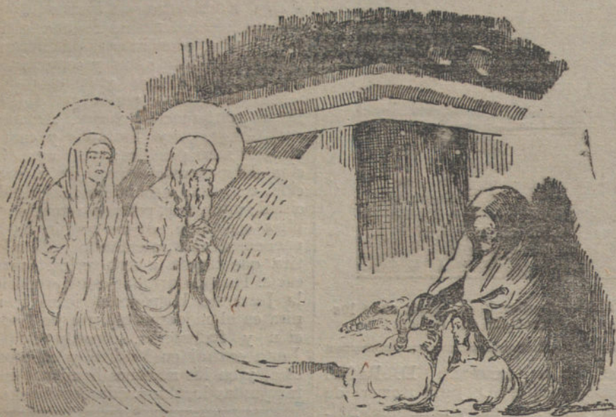
(Dibujo de AGUSTIN.)

Una intensa nevada tapizaba el suelo con una mullida y alba alfombra, y en el espacio, los copos, agitados en miles de direcciones, formaban extraños y caprichosos laberintos, cual bandada de innumerosas y blancas mariposas.