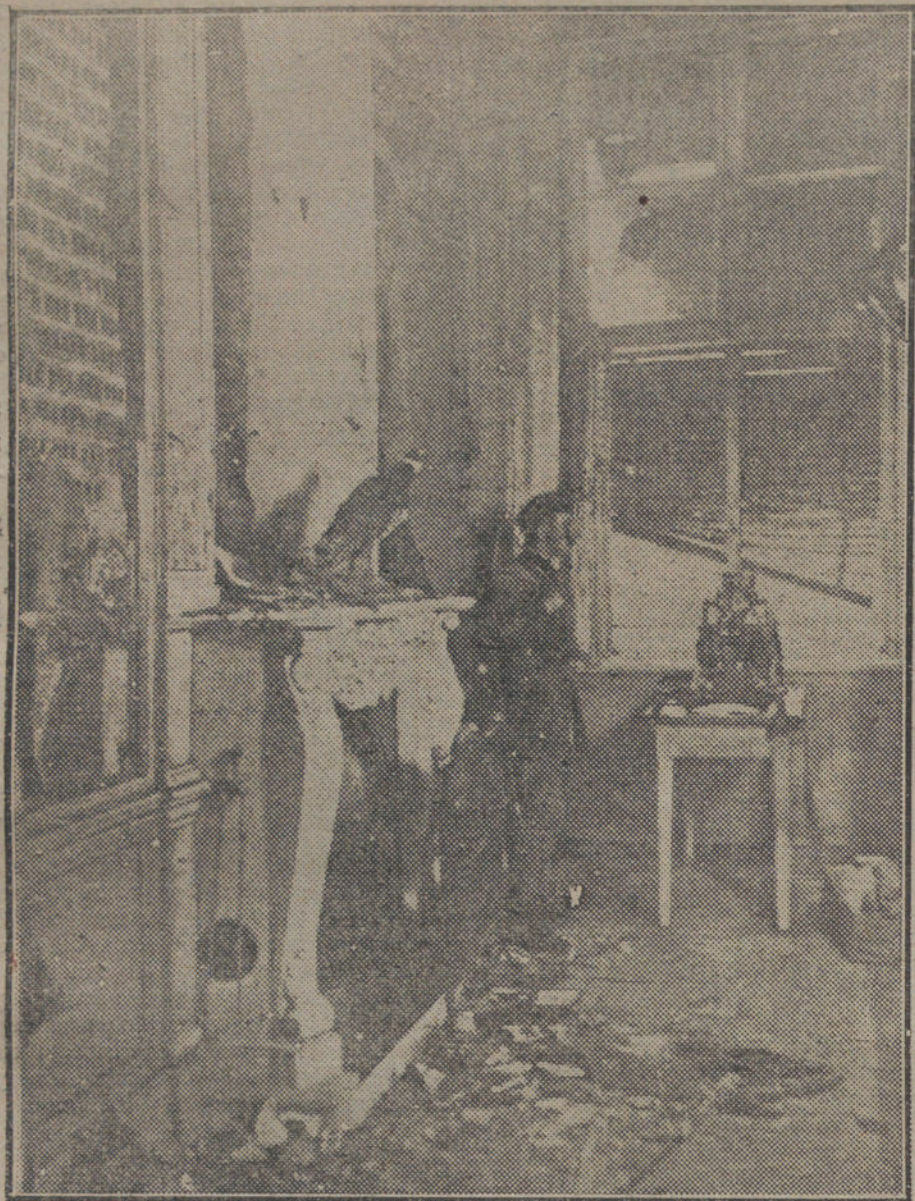
LA REVOLUCION EN BERLIN.—Habitación del Palacio Imperial y Real, después de recuperado el edificio por las tropas gubernamentales. En la ventana, una ametralladora, vigilada por el centinela.

civilización, seguramente magnífica, pero muy costosa al principio?