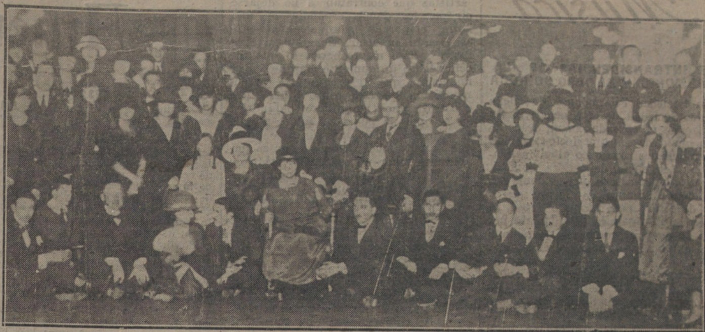
LA ACTUALIDAD MADRILEÑA.—Concurrentes al té-baile celebrado en el Hotel de la Unión Francesa.

Después, en uno de los trenes descendentes, se los condujo á Madrid.