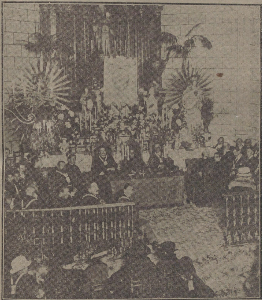
LA ACTUALIDAD MADRILEÑA.—Solemne Asamblea anual de la V. O. Tercera de San Francisco, celebrada ayer tarde en la Iglesia de San Fermín de los Navarros.

En Chaves se espera de un momento á otro un ataque.