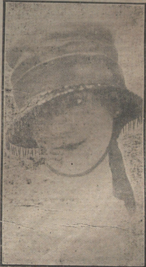
LA MUJER Y LA MODA.—Elegantísimo sombrero, último grito de la moda para señoritas.