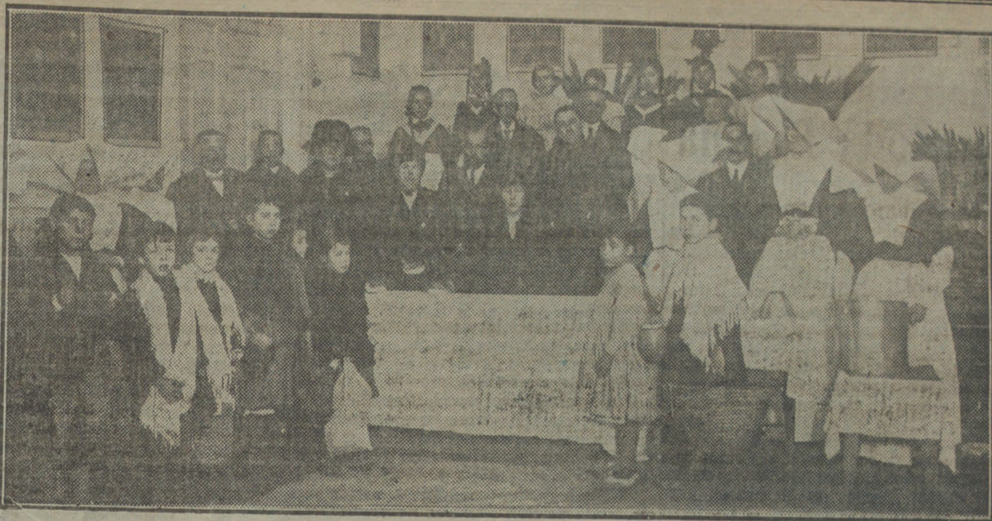
Su Majestad la Reina Doña Victoria en el reparto de comidas a los pobres, verificado hoy al medio día.

En la Comedia lleva su mes y medio de ensayos «La casa de la Troya», la