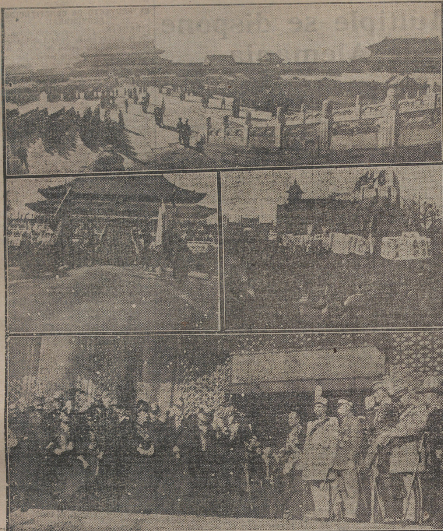
HASTA EN LA CHINA: —Cómo se ha celebrado la victoria de los aliados en el Oriente Imperial.—Nuestras fotografías dan idea de las curiosas ceremonias, celebradas con tal motivo: Arriba, revista militar; en el centro, a la izquierda, presentación de las banderas aliadas, después de la revista; a la derecha, manifestación popular con carteles alegóricos; abajo, discurso del Presidente a las tropas, rodeado de diplomáticos aliados.

sivos, para la extracción de aceites ligeros, de donde se saca el benzol; para las transacciones sobre las cubiertas metálicas, la fabricación de glicerina, la producción y el comercio del carburo de calcio, etc.