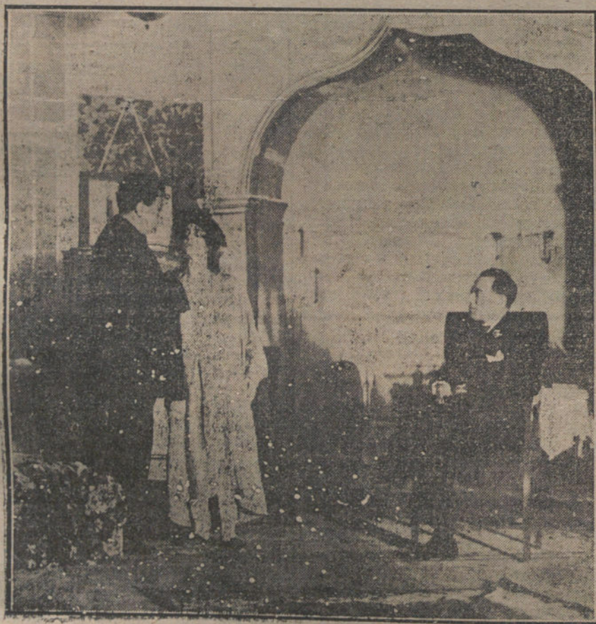
Una escena de «El conuco dominio», drama estrenado anoche en el teatro del Centro.