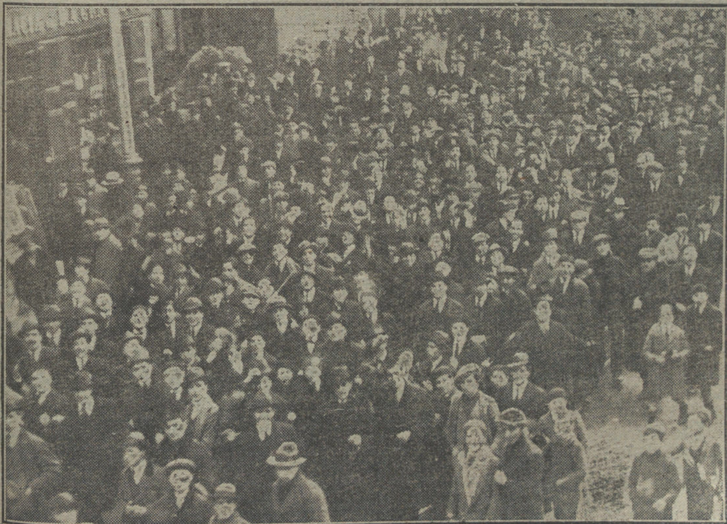
CONTRA EL CACIQUISMO.—Manifestación de estudiantes, al salir esta tarde del mitin que celebraron en la Universidad para protestar enérgicamente contra el caciquismo.

Marcharon luego frente al Congreso, con una bandera, en la que se leía: «¡Mueran los caciques!», y allí permanecieron, a la hora de cerrar esta edición, dando mueras a La Chica y a los malos políticos.