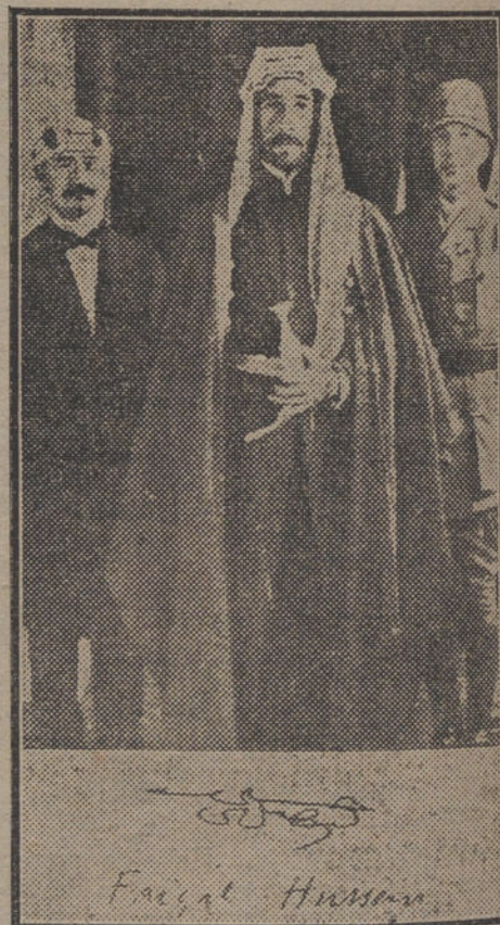
El Emir Faizal, hijo y delegado del Rey del Hedjaz, que, atribuyéndose la representación de todos los pueblos árabes de Asia, ha pedido, ante la Conferencia de la paz, la resurrección del Imperio árabe, bajo la tutela de Inglaterra, de cuyo protectorado depende el actual reino del Hedjaz.

Claro es que la soberanía de ese nuevo Imperio árabe — en el que entrarían Palestina, Arabia, Mesopotamia y Siria — correspondería al Hedjaz, y,