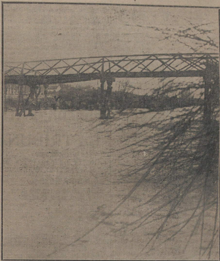
EL MANZANARES, DE MAL HUMOR.—Aspecto que presentaba el Manzanares esta mañana, por la parte del puente Verde, al que ha quebrantado mucho la fuerza de las aguas.

Pues bien; aprovechemos la oportunidad que nos ofrece esta contradicción que existe entre lo acordado en 1916 y lo que ahora pretende el Rey del Hedjaz, protegido británico, para decir por nuestra parte que el Tratado de 1916 debe ser revisado, porque la cesión que hicimos á Inglaterra del puerto de Caiffa y la internacionalización de Alejandreta priva á la Siria francesa de sus comunicaciones naturales, y lo que es más grave, ese Convenio divide á Siria en dos partes, dejando la oriental aislada y á merced de la atracción que sobre ella ejerce-