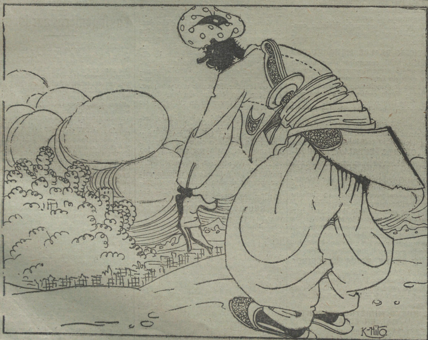
EL CACIQUISMO EN GRANADA

Después de asistido en la Casa de Socorro pasó al Hospital.