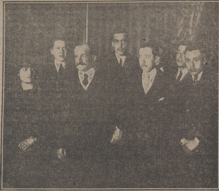
Visita al conde de Romanons de la Comisión de estudiantes para entregarle las conclusiones del mitin anticuáquill.

Se redoblarán los esfuerzos para llegar pronto á la paz, reclamando, al