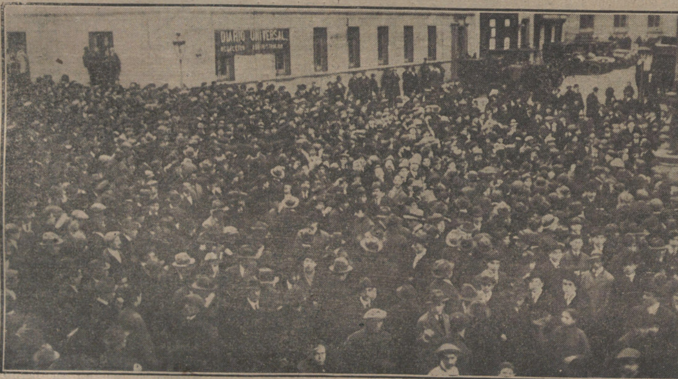
CONTRA EL ODIOSO OACIQUISMO.—Imponente manifestación de estudiantes, al llegar ayer tarde al Congreso, para protestar contra los desmanes de La Chica y sus cómplices.