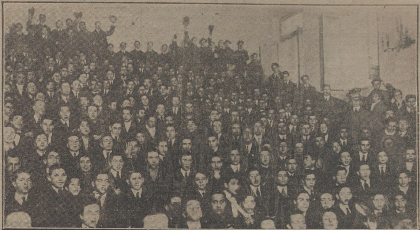
LOS ESTUDIANTES PROTESTAN CONTRA LOS SUCESOS DE GRANADA.—Mitin estudiantil en la clase de Química de la Universidad, para pedir el castigo de los culpables de los sucesos granadinos.

Es una información interesante que deben consultar cuantos hayan de intervenir en la preparación del profesorado.