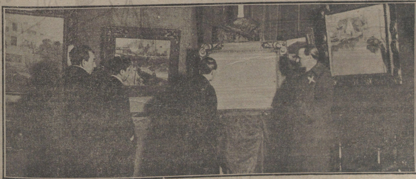
En la Exposición de cuadros del notable artista Sr. Mignoni (x), inaugurada en la casa estudio, calle del Carmen.

No se trata de deleitar con cuadros amenos y narraciones literarias, sino de una obra de práctica utilidad, como no la había hasta ahora y que hacía mucha falta. Pero, ¿qué mayor deleite para una persona culta y para cuantos se deleitan en la historia que hallar en un libro bien cribado y cerificado las noticias de la nuestra, de nuestra cultura y civilización, con las fuentes de donde manan y los libros donde se cuentan, verifican y tratan más extensa y particularmente? El que quiera enterarse de la prehistoria española, tiene aquí, por primera vez, un muy completo y bien hecho compendio que le aborrecerá la rebusca y lectura de