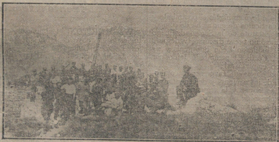
DESPUES DE LA GUERRA.—Un puesto de Artillería antiáerea en los Alpes, servido por el Ejército italiano.