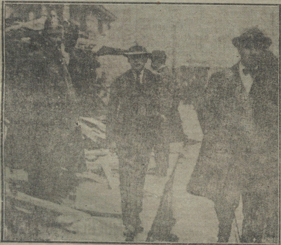
LA FAMOSA VALLA DE VITORICA.—Conducción a la Comisaria de un estudiante, detenido durante la destrucción de la valla de la casa del Sr. Vitorica.