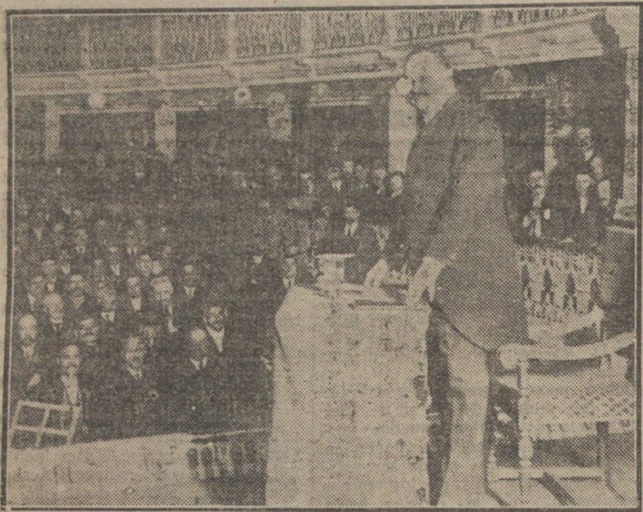
El alcalde de Madrid, Sr. Garrido Juaristi, dando su conferencia sobre Subsistencias en el teatro Español.

El alcalde habla de las subsistencias; pero ya verán ustedes cómo no bajan de precio