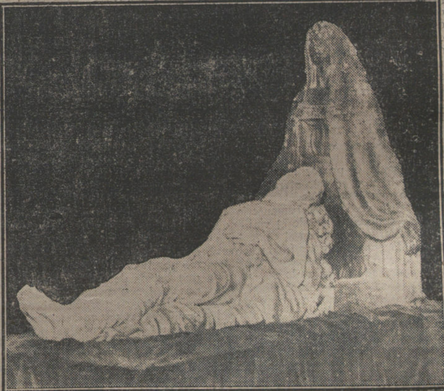
La última obra del genial escultor.