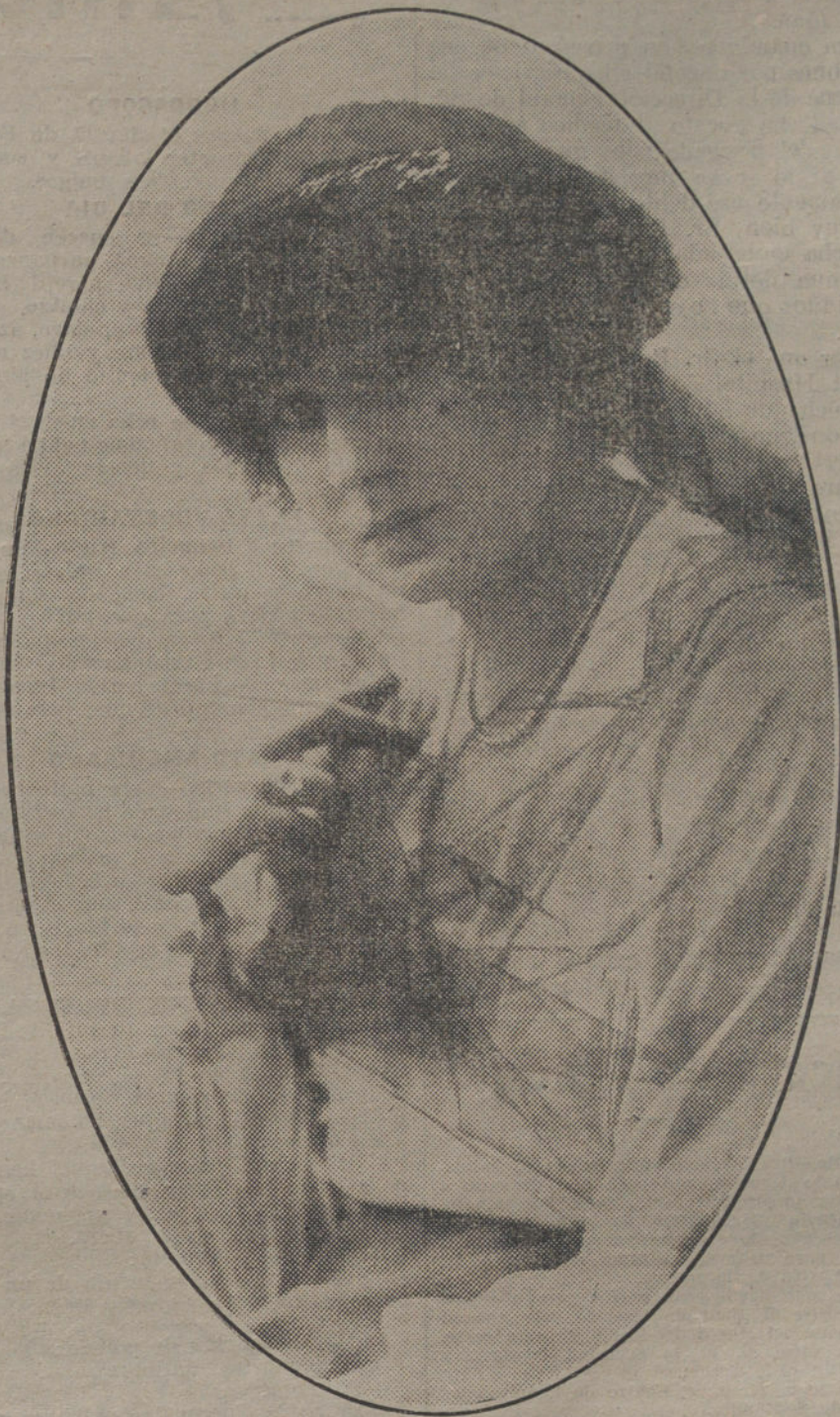
Elegante sombrero de invierno, con velo de tul, para jovencitas.

Después de unos párrafos en los cuales late un fondo de escepticismo, afirma el disertante que siempre las alianzas de paz fueron las que engendraron las guerras. (Aplausos.)