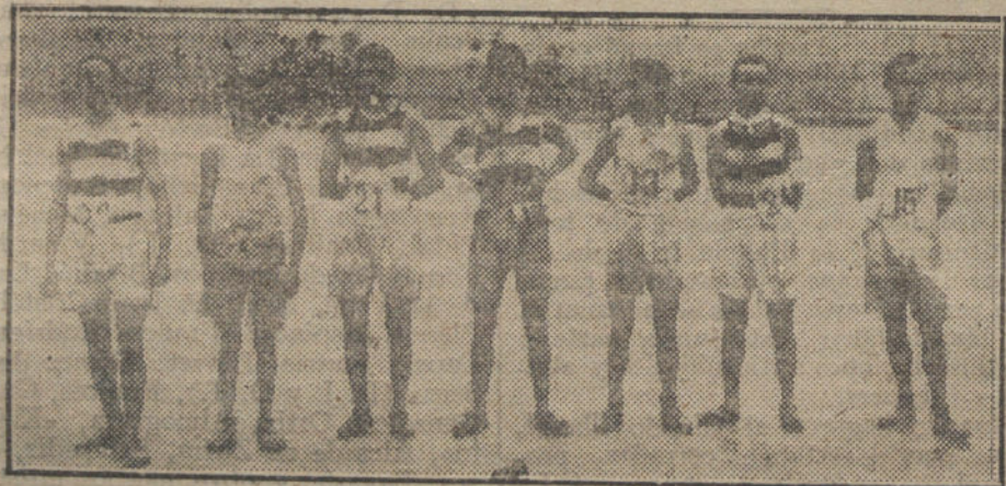
SIETE VALIENTES.—Los ganadores de carreras á pie celebradas esta mañana.

El presupuesto municipal que ha de comenzar á regir el día primero de Abril está hecho á base de las carnes y el vino, sin perjuicio de desear el Ayuntamiento, ante la Junta municipal, la sustitución por el Gobierno de ambos artículos.