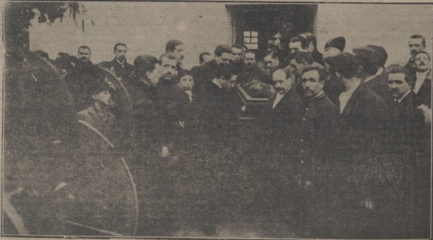
ENTIERRO DEL GENIAL ARTISTA JULIO ANTONIO.—Momento de sarcar el féretro del Sanatorio, donde falleció.

LISBOA. Desde Villarreal, la columna monárquica que allí estaba envió parlamentarios á las fuerzas republicanas, rindiéndose sin condiciones.