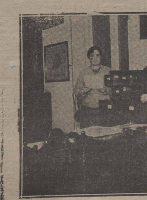
La directora-secretaria y escribiente en la Secretaría de la Normal.