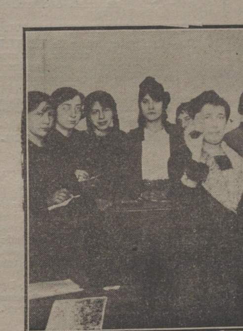
La señorita La Rigada en su clase de Geometría.

cursiones (a Toledo, El Escorial y Segovia), formada cada una por cuatro secciones de alumnas, a cargo de cuatro profesoras. Después de realizado este proyecto, para el que la Superioridad se ha mostrado pródiga, facilitándonos los recursos pecuniarios que hemos solicitado, merced a re-