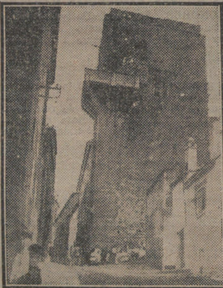
Torre de los Cáceres.

Todo parece muerto a nuestro alrededor. Es tal que una faz cadavérica, apérgaminada y enjuta. Cuencas solitarias, y cráneos mondos, y narices deruidas, y mandíbulas fofas. El esqueleto de la vieja ciudad se nos presenta trágicamente bajo la luz tibia de este día, que huele a tierra mojada de campamento. Los buhos, las águilas, los buitres, todas las aves que comen de las cosas muertas y espeluznantes han comenzado a desgastar con sus picos robustos las piedras de las torres. Allí