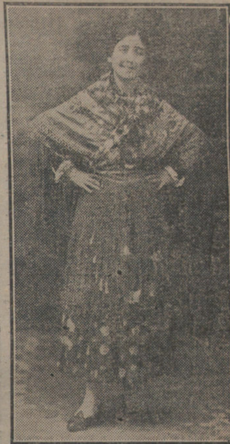
OFELIA DE ARAGON.—Notable artista, que con gran éxito ha actuado en los principales coliseos de esta corte.

—Se anuncia un baile en el hotel de la duquesa viuda de Valencia.