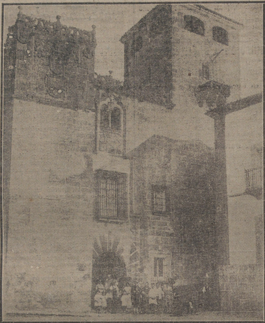
Casa de los Gólfines, donde residieron los Reyes Católicos, en Cáceres.

Unos palacios honestos y magníficos, con esa honestidad de las arcaicas rejías españolas y aquella magnificencia de los grandes señores, cristianos, aventureros y galantes, han surgido de pronto ante nuestros ojos, un poco fatigados de la áspera visión del paisaje extremeño. Estamos en Cáceres, la antigua. Y es una mañana húmeda, de cielo gris, á veces alumbrado por un sol amarillo, como es de amarilla la llama de los cirios funerarios.